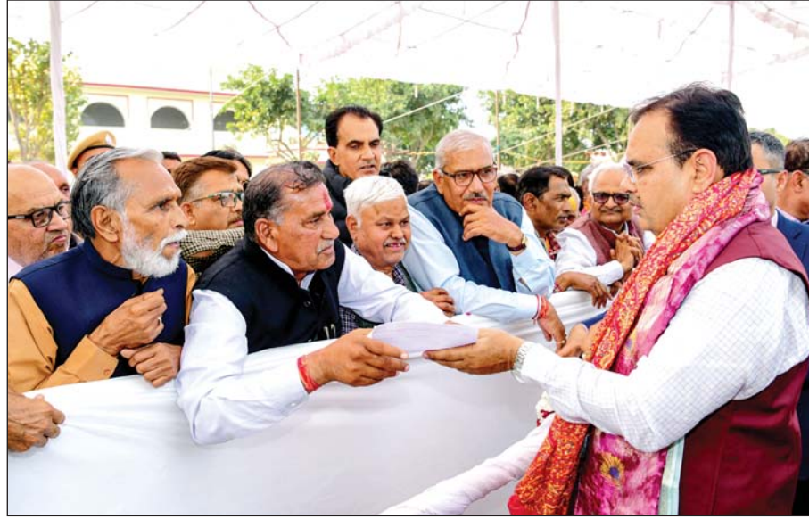
मुख्यमंत्री भजनलाल शर्मा शनिवार को भरतपुर दौरे पर रहे। जिले के विभिन्न सामाजिक संगठनों व आमजन ने सर्किट हाउस में उनसे मुलाकात की और बजट में भरतपुर एवं डीग जिले को दी गई सौगातों के लिए आभार जताया।

मुख्यमंत्री ने सर्किट हाउस में जनसुनवाई भी की और संबंधित अधिकारियों को आमजन की समस्याओं के शीघ्र निस्तारण के निर्देश