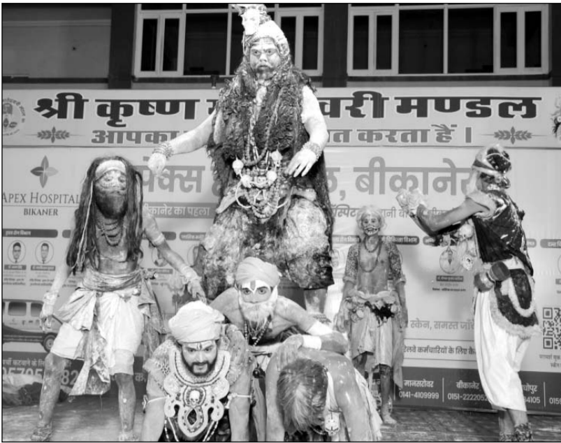
महेश नवमी पर्व पर सांस्कृतिक कार्यक्रम में दी रंगारंगी प्रस्तुतियाँ।