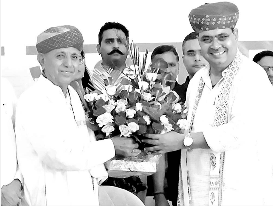
सीएम भजनलाल शर्मा ने केंद्रीय मंत्री भागीरथ चौधरी को जन्मदिन की शुभकामनाएं दी।

समारोह को संबोधित करते हुये उन्होंने कहा कि किसानों के पानी की समस्या को लेकर उदयपुर से बीसलपुर बांध में पानी लाने के लिये विशेष योजना का काम शुरू हो गया है। उन्होंने अजमेर लोकसभा क्षेत्र से भाजपा की जीत के लिये आभार व्यक्त किया। केंद्रीय कृषि राज्य मंत्री भागीरथ चौधरी व आर के मार्बल ग्रुप चेयरमैन अशोक