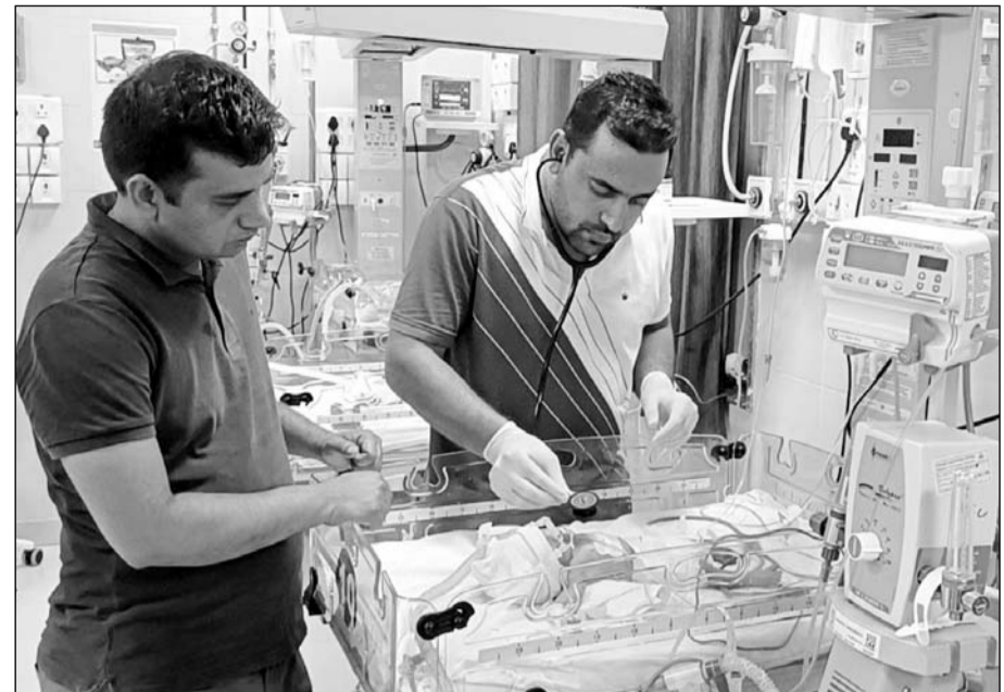
बीडीके अस्पताल के चिकित्सकों ने नवजात बच्चे को बचाने की कोशिश की।

जयपुर ले जाते समय नवजात ने रास्ते में दम तोड़ा