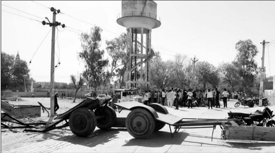
बिजली व पानी की समस्याओं को लेकर सिद्धमुख में ग्रामीण धरने पर बैठे।

सिद्धमुख के ग्रामीणों ने बताया कि भीषण गर्मी में कस्बे के लोगों को बिजली व पानी की किल्लत का सामना करना पड़ रहा है। कहीं बिजली की लाइनों में फाल्ट आ रहा है, तो कहीं वोल्टेज कम आने की समस्या बनी है, तो कहीं पर रात और दिन में कई-कई घंटे तक लगातार बिजली आपूर्ति बाधित हो रही है। इसे लेकर लोगों का गर्मी में बुरा हाल बना है। लोगों को पेयजल की किल्लत से भी जुझना पड़ रहा है। लोग पानी की बूंद-बूंद को तरसने को मजबूर हैं। ग्रामीणों ने कहा कि भीषण गर्मी के प्रभाव से क्षेत्र में तापमान बढ़ता जा रहा है और ऐसे में कस्बे के लोग बिजली-पानी की समस्या से जुझ रहे हैं। गर्मी में लोगों को बिजली और पानी की जरूरत सबसे ज्यादा होती है, लेकिन विद्युत निगम बिजली आपूर्ति देने और