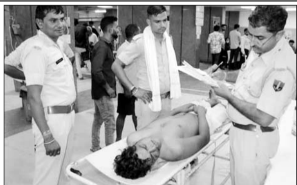
पुलिस ने अस्पताल में घायल युवक के बयान लिये।

अजमेर, (कासं)। रामगंज थाना क्षेत्र के खानपुरा में रहने वाले एक युवक का वैन और बाइक पर सवार होकर आए बदमाशों ने अपहरण कर मारपीट की और जौहरगंज क्षेत्र में अधमरा सड़क किनारे पटक कर फरार होने का मामला सामने आया है। परिजन ने मामले की शिकायत थाने में दर्ज कराई है। पुलिस ने युवक को अस्पताल पहुंचाया, जहां उपचार जारी है। युवक दो माह पहले जेल से छूट कर बाहर आया था। पुलिस ने मामला दर्ज कर जांच शुरू कर दी है।