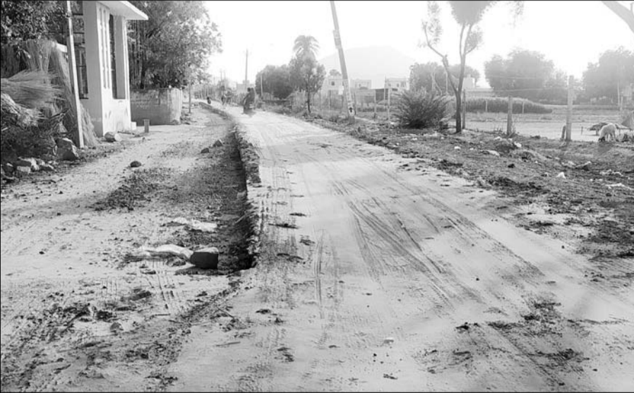
संवेदक द्वारा अधूरे सड़क मार्ग कार्य को छोड़ देने से लोग परेशान हो रहे हैं।

पावटा से कुनेड मार्ग तक दो किमी सड़क मार्ग पर सड़क निर्माण की अवधि के चार से पांच माह बाद निर्माण कार्य शुरू हुआ था, लेकिन सड़क निर्माण की अवधि समाप्त होने के पांच माह बाद भी अभी तक पूरा होने का नाम नहीं ले रहा है। विभागीय अधिकारियों द्वारा ध्यान नहीं देने जाने की वजह से निर्माण अटकता ही जा रहा है। संवेदक द्वारा अधूरे सड़क मार्ग को छोड़ देने से लोग खराब सड़क को झेल रहे हैं। इस मार्ग से जो भी गुजरता वह