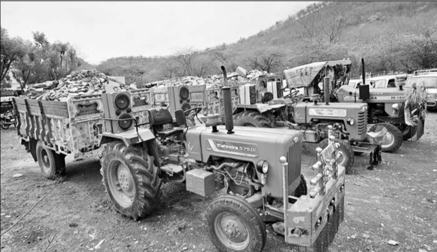
काछोला पुलिस ने अवैध खनन का ग्रेवल पत्थर परिवहन करने के मामले में ट्रैक्टर-ट्रॉली जब्त किये।

जस्सूजी का खेड़ा पंचायत क्षेत्र मिमरल के बगतपुरा के ग्रामीणों ने आरोप लगाया कि सरथला इलाके में लगी दो ग्राइंडर को फैक्ट्रियों में अवैध खनन के मिमरल को ग्राइंडिंग कर कई राज्यों में भेजा जा रहा है। फैक्ट्री संचालक और खनन माफिया की प्रशासन से सांट-गांट के चलते लम्बे समय से सरकारी भूमि में पड़े पैमाने पर अवैध खनन का सिलसिला बदनूर जारी है। पिछले दिनों भी ग्रामीणों की शिकायत पर खजुरी (जहाजपुर) के तहसीलदार ने ग्रेवल मिट्टी परिवहन करते खनन माफिया के एक डम्पर को जब्त कर गोधपुरिया से जब्त किया