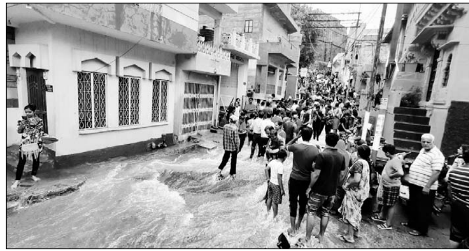
पदमसर तालाब ओवरफ्लो होने के बाद जोधपुर के लोग वहां घूमने व पूजा करने पहुंचे।

फतेहपोल क्षेत्र में भी एक मकान की दीवार भरभरा कर सुबह गिर गई। गनीमत रही कि कोई जनहानि नहीं हुई। मंगलवार की रात को भी फिर से मूसलाधार बारिश हुई। अब तक 262 मिलीमीटर पानी बरस गया है। शहर के नदी, नाले उफान पर हैं तो कई जगहों पर पानी का भारी जमाव है। रेलों और रोडवेज के पहिए मंगलवार से ही थम गए हैं। कई ट्रेनों के समय में परिवर्तन किया जा चुका है। भीतरी शहर का जायजा लेने के लिए खुद जिला कलेक्टर, पुलिस आयुक्त रविदत्त गौड सुबह निकले। नागौरी गेट जनता कॉलोनी में गिरे मकान का