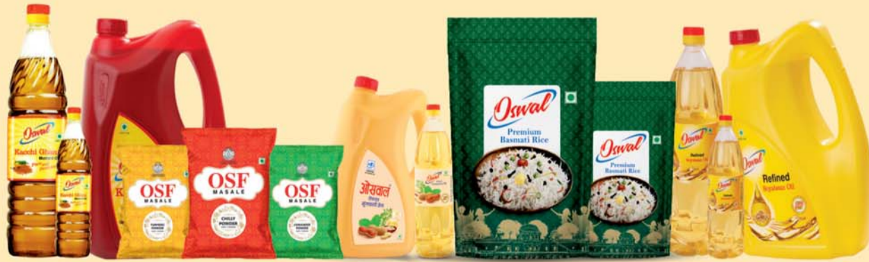
कच्ची घानी तेल

कहते हैं, अच्छे दिन का सीक्रेट अच्छे नाश्ते में छिपा होता है। जैसे, स्वाद और पौष्टिकता का कॉम्बिनेशन - ओसवाल पोहा। इसका हर दाना पूरी तरह खुला-खुला और खिला-खिला रहता है, ताकि आपको पोहे की खिचड़ी नहीं बल्कि रियल पोहा खाने को मिले। और रही बात टेस्ट की, तो हर मेहमान यही पूछेगा - इस पोहे का नाम तो बताओ?