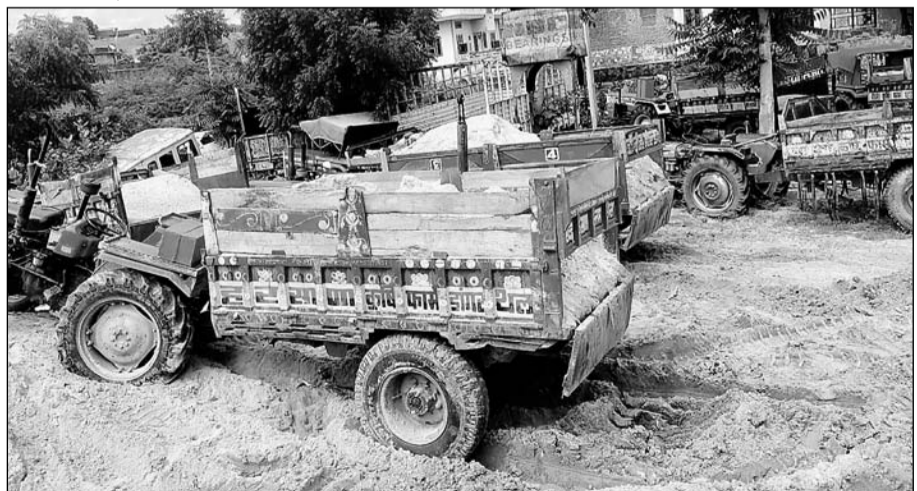
अवैध बजरी से भरे हुए ट्रैक्टर-ट्रौली जप्त किए।