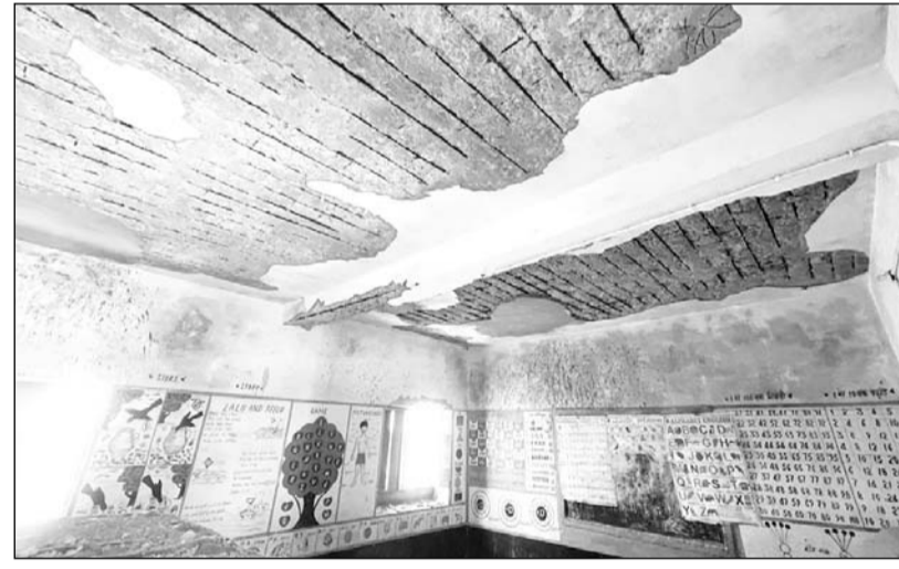
छत में लगे लोहे के सरिये बाहर नजर आने लगे हैं।

बताया कि सन 2020 से ही लगातार प्लास्टर गिरने का सिलसिला जारी है। बारिश में सभी कमरों से पानी टपकने लगता है। छत में लगे लोहे के सरिमें बाहर नजर आने लगे हैं। इसकी सूचना उपखंड अधिकारी सहित बीडीओ, ग्राम विकास अधिकारी, ग्राम प्रधान को कई बार लिखित में दी जा चुकी है लेकिन किसी ने अभी तक कोई भी ध्यान नहीं दिया है।