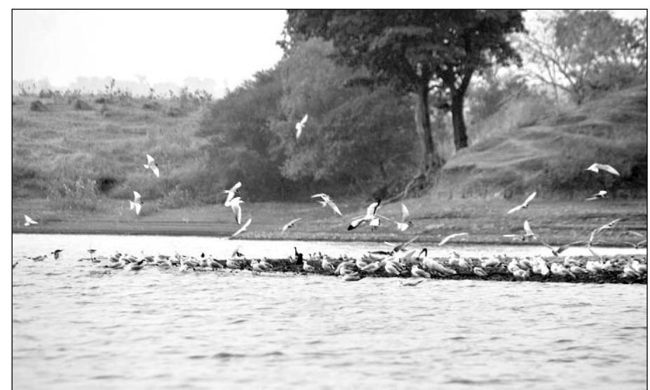
माही डेम की अथाह जलराशि में अठखेलियां करते प्रवासी परिंदे।

बांसवाड़ा, (नि.सं.)। सर्दी बढ़ने के साथ जिले में प्रवासी परिंदों की संख्या बढ़ती जा रही है। पर्यावरण प्रेमियों को इनकी गतिविधियां आकर्षित कर रही हैं। वहीं माही डेम में प्रवासी पक्षियों का कलरव गूज रहा है।