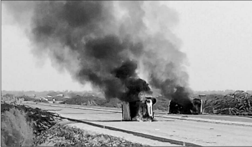
आक्रोशित लोगों के आग लगाने के बाद गाड़ियां धू-धू कर जलने लगी।

घटना के बाद अधिकारी और प्रदर्शनकारी आपस में भिड़ गए। पत्थरबाजी भी की गई। मामला बढ़ता देख पचपदरा पुलिस उप अधीक्षक