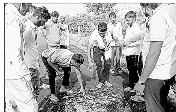
घटिया सड़क निर्माण को दिखाते स्थानीय ग्रामीण।

वैर (निस)। पी डब्ल्यू डी मंत्री भजन लाल जाटव के विधानसभा इलाके में सार्वजनिक निर्माण विभाग द्वारा सड़क बनाने का काम चल रहा है। लोगों का कहना है विधानसभा वैर से विधायक भजन लाल जाटव राजस्थान सरकार में पी डब्ल्यू डी मंत्री हैं। जहां बनाई जा रही सड़कों में घटिया क्वालिटी को लेकर स्थानीय लोग विरोध जताने लगे हैं। जिले के कई विधायक अब तक कई बार सवाल उठा चुके हैं। इसके बावजूद भी ठेकेदारों द्वारा घटिया निर्माण सामग्री से सड़कें