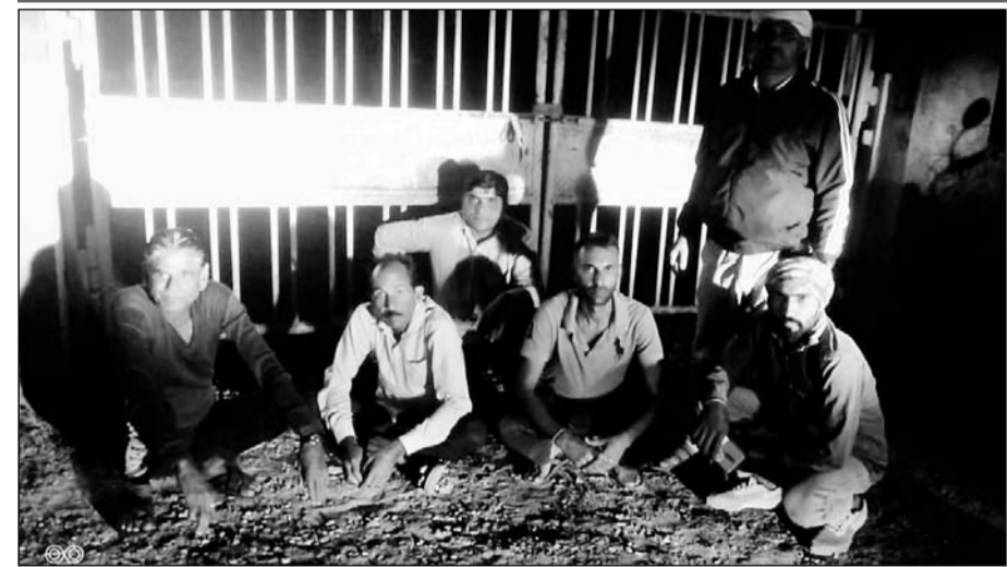
सेफरागुवार जीएसएस का घेराव कर बैठे किसान।

रात के समय 11 बजे से सुबह 4 बजे तक बिजली दी जाती है