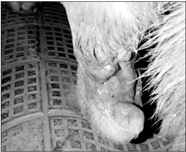
हाउसिंग बोर्ड चूरू की गली नंबर 9 में पिछले एक माह से जिम्मी नाम का एक खान गंभीर रूप से घायल है।