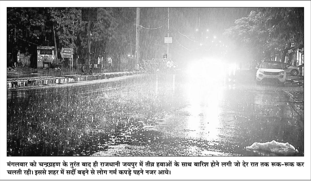
मंगलवार को चन्द्रग्रहण के तुरंत बाद ही राजधानी जयपुर में तीव्र हवाओं के साथ बारिश होने लगी जो देर रात तक रूक-रूक कर चलती रही। इससे शहर में सर्दी बढ़ने से लोग गर्म कपड़े पहने नजर आये।