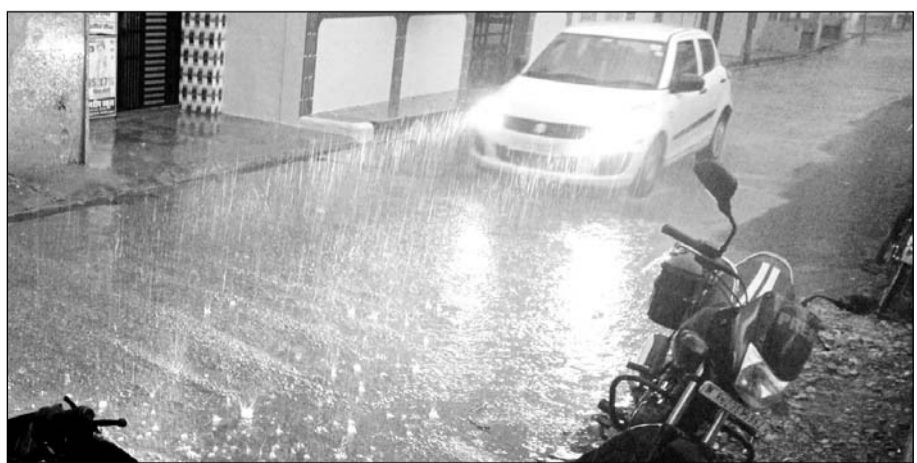
श्रीमधोपुर में शाम चार बजे बाद बारिश का दौर शुरू हुआ।

श्रीमधोपुर, (निसं)। क्षेत्र में नवंबर के दूसरे सप्ताह के शुरूआत में मंगलवार शाम 4 बजे मौसम का मिजाज अचानक बदल गया। शाम चार बजे ही अंधेरा सा छा गया और और वाहन चालकों को वाहनों की लाइट जलानी पड़ी। इसके बाद तेज हवा और बादलों की गर्जना के साथ शाम 4.45 बजे बारिश का दौर शुरू हो गया। मौसम विभाग के