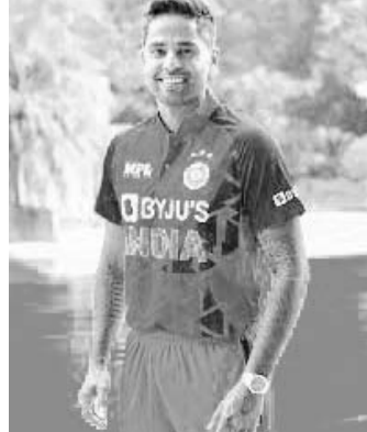
संभल कर खेलने के बाद गेंदबाजों पर दबदबा बनाता है। यह देखा दिलचस्प है

की अपनी क्षमता से विशेषज्ञों और प्रशंसकों को आश्चर्यचकित किया है। इस 32 साल के खिलाड़ी ने बल्लेबाजी के लिए मुश्किल परिस्थितियों में भी मन मुताबिक रन खेले। सूर्यकुमार ने दक्षिण अफ्रीका के खिलाड़ी सूर्यकुमार ने दक्षिण अफ्रीका के बल्लेबाजों में ऐसी ही पारी खेली थी। डिविलियर्स से अपनी तुलना को खारिज करते हुए सूर्यकुमार ने कहा था कि सिर्फ एक ही खिलाड़ी 'मिस्टर 360 डिग्री' जैसे तमगे का हकदार है लेकिन दक्षिण अफ्रीका के पूर्व कप्तान ऐसा नहीं मानते। उन्होंने कहा, मैं सूर्यकुमार के लिए बहुत खुश हूँ। मुझे लगता है कि वह बहुत लंबा सफर तय कर चुका है। मुझे उम्मीद नहीं थी कि वह इतना बेहतर करेगा।" डिविलियर्स ने कहा, "वह शुरुआत में