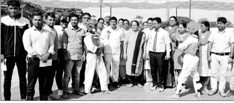
विभिन्न प्रतियोगी खिलाड़ियों के साथ विद्यालय का स्टाफ।

झुंझुनूं। स्थानीय राजस्थान पब्लिक उच्च माध्यमिक विद्यालय गणपति नगर में चल रही 66वीं जिला स्तरीय खेलकूद प्रतियोगिताओं में मंगलवार को शतरंज, कुडो, ताड़क्वांडो खेल प्रतियोगिताओं में विभिन्न विद्यार्थियों ने बाजी मारी।