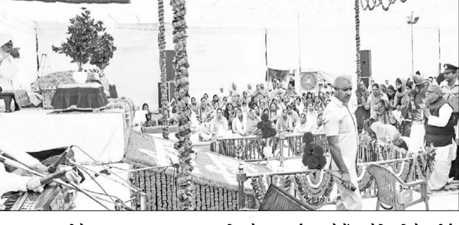
गुरु नानक जयन्ती के अवसर पर राज्यपाल कलराज मिश्र ने राजा पार्क गुरुद्वारे में आयोजित विशेष कीर्तन में भाग लिया।

जयपुर, (का.सं.)। राज्यपाल कलराज मिश्र ने श्री गुरु नानक देव जी के 553वें प्रकाश पर्व गुरु नानक जयन्ती के अवसर पर मंगलवार को राजा पार्क गुरुद्वारे में विशेष कीर्तन दिवान आयोजन में भाग लिया। राज्यपाल ने सभी को बधाई और शुभकामनाएं देते हुए कहा कि गुरु नानक देव जी ने सामाजिक कुतियों,