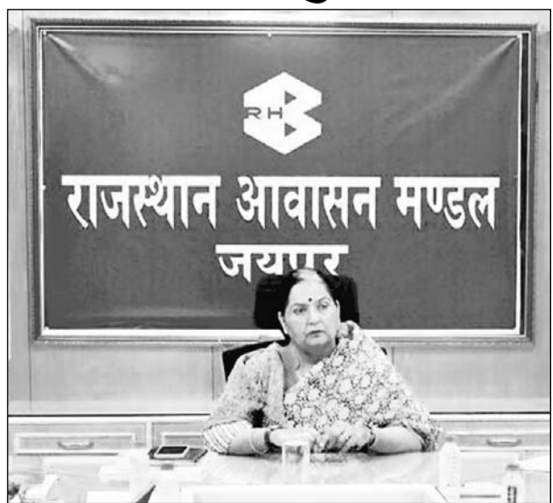
आवासन आयुक्त डॉ. रश्मि शर्मा

प्रीमियम प्रॉपर्टी ऑक्शन में ई-नीलामी के तहत कुल 54 सम्पत्तियों के निस्तारण से आवासन मण्डल लगभग 142.54 करोड़ रुपए का राजस्व अर्जित करेगा। जिसके तहत जयपुर से 90 करोड़ 69 लाख 59 हजार, जोधपुर से 23 करोड़ 63 लाख 46 हजार, अलवर तथा भिवाड़ी में 27 करोड़ 31 लाख 48 हजार, बीकानेर में 14 लाख