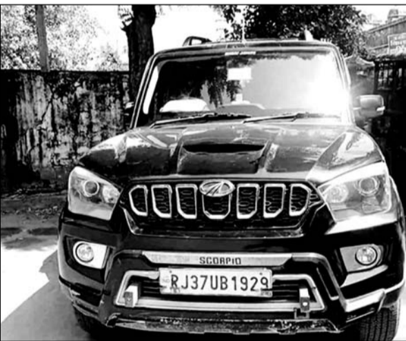
पुलिस द्वारा जब्त की गई गाड़ी।