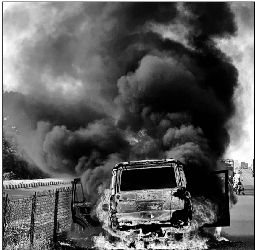
आग लगने चलती स्कॉर्पियो में उठता हुआ धुआं।

भीलवाड़ा, (नि.सं.)। जिले के मंडल थाना क्षेत्र से गुजर रहे नेशनल हाईवे-48 पर अजमेर-भीलवाड़ा के बीच बेरां चौहाने के निकट रविवार सुबह एक बड़ा हादसा टल गया, जिससे एक परिवार के छह सदस्य बाल-बाल बच गये।