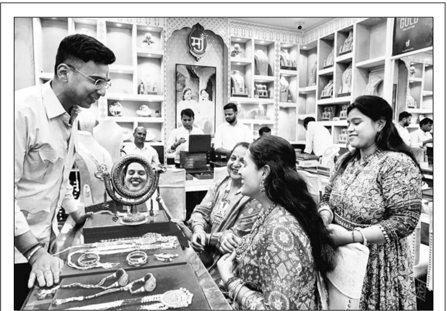
सोने की कीमते बढ़ती ही जा रही हैं फिर भी सबसे बड़े त्यौहार दीपावली व करवा चौथ के लिए खरीदारी शुरू हो चुकी है। लोग अब धन तेरस का इंतजार नहीं करते। नवरात्रि में कोई नई गाड़ी खरीद रहा है तो कोई प्रोपर्टी लेकिन सामने महिलाओं के सुहाग के सबसे बड़े त्यौहार करवा चौथ पर घर की बड़ी महिलाएं अपनी घर की बहुओं को ज्वेलरी खरीदने ले जा रही हैं। विद्याधर नगर में एक ज्वेलरी की दुकान पर करवा चौथ की खरीददारी करती महिलाएं।