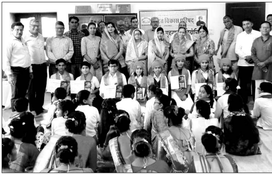
शाखा स्तरीय राष्ट्रीय समूह गान प्रतियोगिता का हुआ आयोजन

इस दौरान भवन निर्माण में सहयोग देने वाले भामाशाहों व संस्था के माध्यम से बैंकों और अन्य राजकीय सेवाओं में नियुक्त होने वाले छात्र-छात्राओं को भी