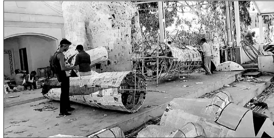
अजमेर शहर में दशहरा महोत्सव को लेकर रावण के पुतलों का निर्माण करते कारीगर।

अजमेर में तीस साल से मुस्लिम कारीगर रावण का पुतला बनाते आ रहे हैं