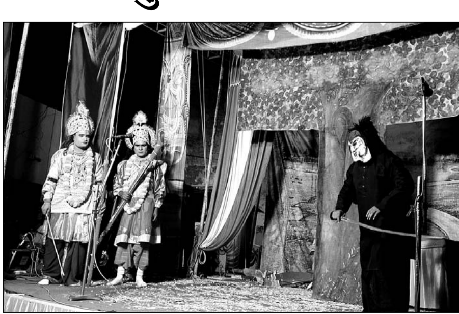
राजलदेसर में चल रही राम लीला में भगवान श्रीराम ने ताड़का वध किया।

राजलदेसर, (कासं)। कस्बे में वीर हनुमान सेवा समिति लाल कुआं व कस्बेवासियों के सहयोग से रामलीला का आयोजन किया जा रहा है। शनिवार को रामलीला के तीसरे दिन रामलीला का मंचन आरती से शुरू हुआ। आरती के बाद रामलीला में ताड़का वध लीला का मंचन हुआ। ऋषि विश्वामित्र राजा दशरथ से उनके दो पुत्र राम लक्ष्मण को यज्ञ की रक्षार्थ करने के लिए अपने साथ ले जाते हैं ऋषि मुनि की रक्षा के लिए भगवान राम व लक्ष्मण खड़े रहते हैं। तभी दंडक वन में भगवान श्रीराम