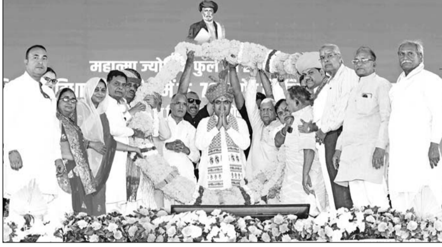
मुख्यमंत्री भजनलाल शर्मा ने शनिवार को कोटा के हिण्डोली में 70 करोड़ के विकास कार्यों का शिलान्यास-लोकार्पण किया। इस मौके पर स्थानीय पदाधिकारियों और आम जनता ने मुख्यमंत्री का गर्मजोशी से स्वागत किया।

बूंदी/जयपुर। मुख्यमंत्री भजनलाल शर्मा ने रामसागर झील के द्वितीय चरण के पर्यटन एवं विकास कार्य तथा महात्मा ज्योतिबा फुले एवं सावित्री बाई फुले की जीवनी पर आधारित पेनोरामा और पुस्तकालय बनाने की घोषणा की। उन्होंने रामसागर झील पर सीपेज की समस्या के समाधान के लिए भी आश्वासन दिया। उन्होंने कहा कि रामसागर झील के किनारे भगवान श्रीराम की 21 फीट ऊंची प्रतिमा बनने पर यह आस्था का भी केन्द्र बनेगा। शर्मा शनिवार को महात्मा ज्योतिबा फुले जयंती के अवसर पर बूंदी के हिण्डोली में विकास कार्यों के शिलान्यास एवं लोकार्पण समारोह को सम्बोधित कर रहे थे। समारोह में मुख्यमंत्री भजनलाल शर्मा ने हिण्डोली में 70 करोड़ रुपये की लागत के 24 विकास कार्यों का शिलान्यास एवं लोकार्पण किया। इस दौरान जन स्वास्थ्य एवं अभियंत्रिकी मंत्री कन्हैयालाल चौधरी, ऊर्जा राज्य मंत्री (स्वतंत्र प्रभार) हिरालाल नागर, सांसद दामोदर अग्रवाल, विधायक गोपीचंद मीना मौजूद थे।