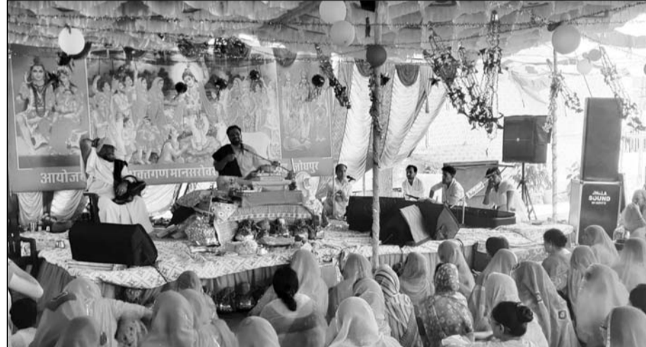
जोधपुर में पाल रौड स्थित मानसरोवर कॉलोनी में दस जून से जारी भागवत कथा का समापन हुआ।