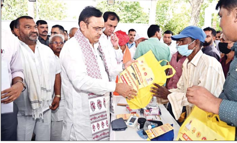
मुख्यमंत्री भजनलाल शर्मा ने बुधवार को उदयपुर में शहरी सेवा शिविर का अवलोकन किया। इस अवसर पर उन्होंने विभिन्न योजनाओं के लाभार्थियों को सहायता प्रदान की।

मुख्यमंत्री भजनलाल शर्मा ने आमजन से अपील की कि वे जरूरतमंद लोगों को शिविर में पहुँचाने में सहयोग करें, ताकि पात्र व्यक्ति को योजनाओं और सेवाओं का लाभ मिलना सुनिश्चित हो।