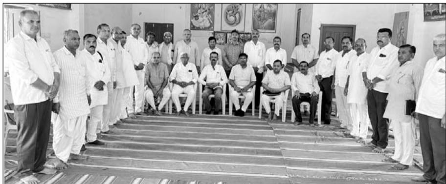
सांचोर के पास सुंथडी स्थित आदर्श विद्या मंदिर के नवीर भवन के शिलान्यास समारोह की तैयारियों को लेकर बैठक आयोजित हुई।