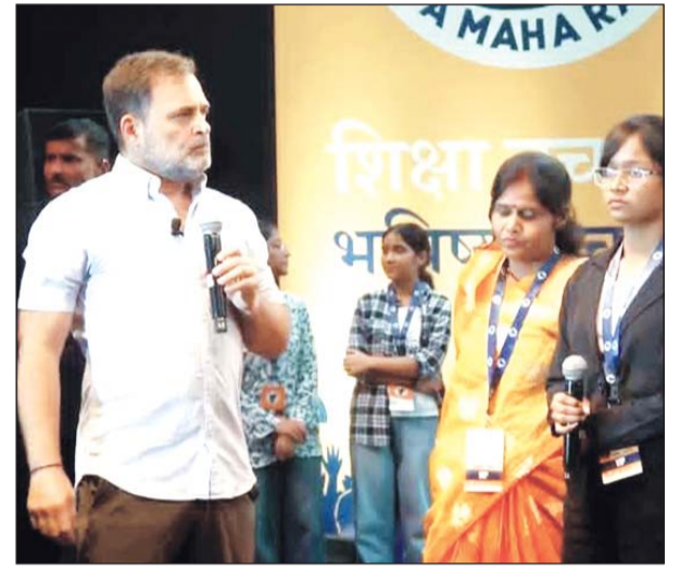
कांग्रेस के वरिष्ठ नेता राहुल गांधी ने कोटा के दशहरा मैदान से पेर लोक मामले में छात्रों से संवाद अभियान की शुरुआत की है।

मध्यम से इसकी जानकारी दी। जारी सलाह के अनुसार, भारतीय नागरिक और सैन्य विमानों के लिए पाकिस्तानी हवाई क्षेत्र का उपयोग प्रतिबंधित रहेगा। नया प्रतिबंध 16 जून को शाम से प्रभावी होकर 24 जुलाई की सुबह तक लागू रहेगा।