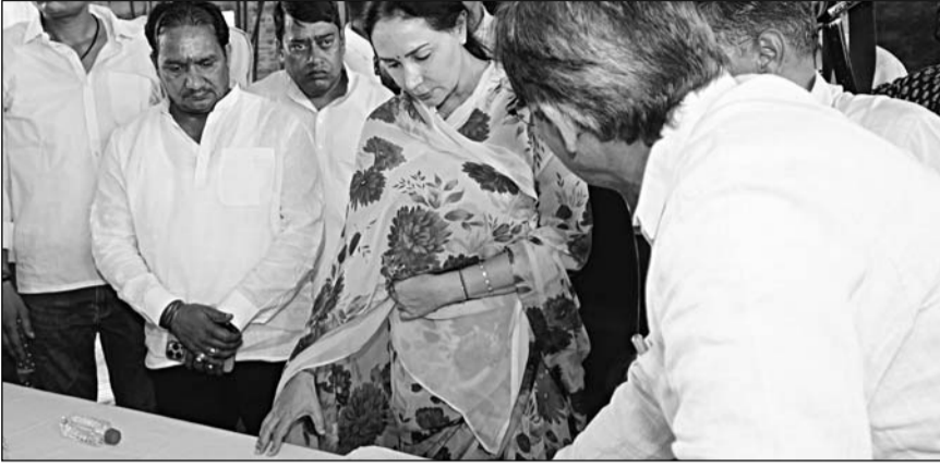
उपमुख्यमंत्री दिया कुमारी ने हॉस्पिटल का निरीक्षण कर निर्माण कार्यों की प्रगति का जायजा लिया।

जयपुर। उपमुख्यमंत्री दिया कुमारी ने बुधवार को 'प्रगति पथ यात्रा' कार्यक्रम के अंतर्गत विद्याधर नगर विधानसभा क्षेत्र में निर्माणाधीन सैटेलाइट हॉस्पिटल का निरीक्षण कर निर्माण कार्यों की प्रगति का जायजा लिया। इस दौरान उन्होंने संबंधित अधिकारियों को निर्माण कार्यों में