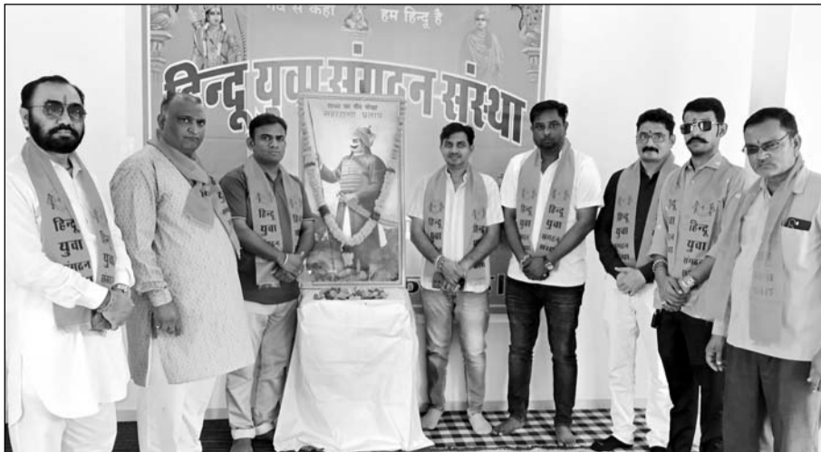
जालोर में हिन्दू युवा संगठन ने महाराणा प्रताप की जयंती मनाई।