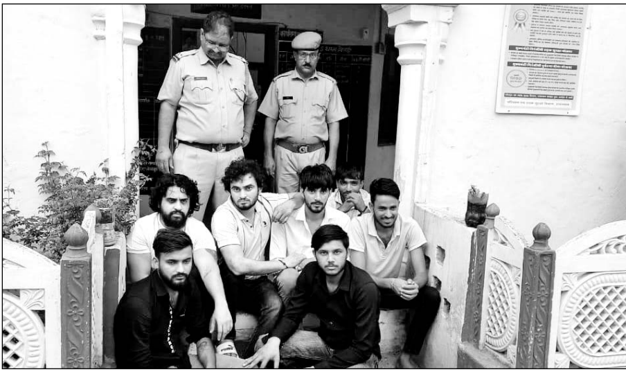
खेतड़ी पुलिस ने देर शाम को बदमाशों को गिरफ्तार किया।