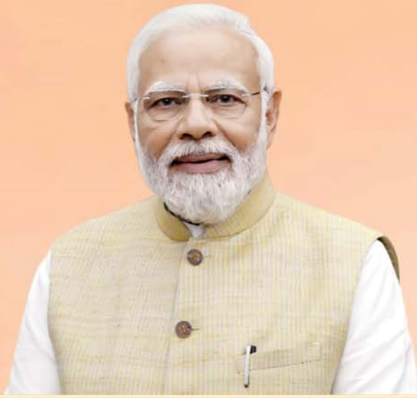
श्री नरेन्द्र मोदी, प्रधानमंत्री