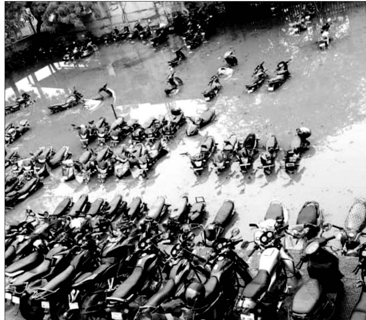
कोटा में भारी बरसात के चलते डकनिया रेलवे स्टेशन के स्टैंड में खड़े वाहन पानी में डूब गए।

बारिश होने से जनजीवन अस्त-व्यस्त, निचली बस्तियाँ और कॉलोनी में बारिश का पानी भरा