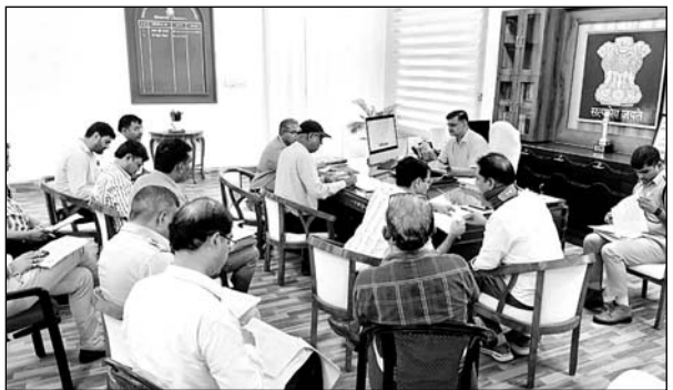
बैठक में कलेक्टर शरद मेहरा ने अधिकारियों को निर्देश दिये।

पाटन, (निर्स)। सड़क दुर्घटनाओं के कारणों और इसे रोकने के उपायों के संबंध में जिला सड़क सुरक्षा समिति की बैठक का आयोजन जिला कलेक्टर शरद मेहरा की अध्यक्षता में किया गया। बैठक में जिला कलेक्टर ने संबंधित अधिकारियों को आवश्यक दिशा निर्देश देते हुए कहा कि उन्होंने जिले में सड़क दुर्घटनाओं के संभावित क्षेत्रों व ब्लैक स्पॉट, घुमावदार सड़क तथा ब्लैक