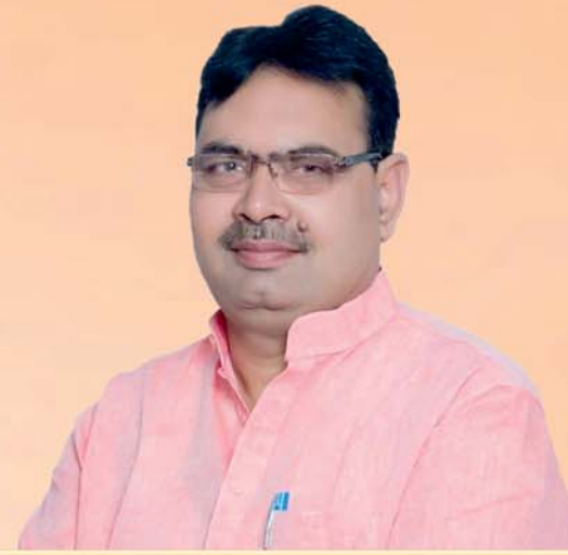
श्री भजनलाल शर्मा, मुख्यमंत्री