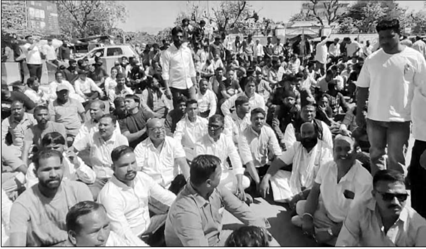
अजमेर में वाल्मीकि समाज के लोगों ने प्रदर्शन किया।

अजमेर, (कासं)। शहर में वाल्मीकि समाज के दो युवकों पर हुए हमले के विरोध में मंगलवार को समाज के लोगों ने जोरदार प्रदर्शन किया। बड़ी संख्या में लोग डाक बंगले से रैली के रूप में कलैक्ट्रेट पहुंचे और आरोपियों की गिरफ्तारी की मांग को लेकर धरना देकर नारेबाजी की। इस दौरान प्रदर्शन इतना उग्र हो गया कि आक्रोशित लोगों ने कलैक्ट्रेट के मुख्य द्वार पर लगी बैरिकेडिंग हटाकर परिसर में प्रवेश कर लिया, जिससे कुछ देर के लिए माहौल तनावपूर्ण बन गया। प्रदर्शनकारियों को रोकने के लिए तैनात पुलिसकर्मियों ने उन्हें समझाने का प्रयास किया, लेकिन भीड़ उग्र होने पर पुलिस और प्रदर्शनकारियों के बीच धक्का-मुक्की की स्थिति बन गई। इस दौरान कुछ समय के लिए अफरा-तफरी का माहौल भी बन गया। बाद में पुलिस ने स्थिति को संभालते हुए प्रदर्शनकारियों को शांत कराया। इसके बाद समाज के लोग पुलिस अधीक्षक कार्यालय के बाहर एकत्र हो गए और आरोपियों की तत्काल गिरफ्तारी की मांग को लेकर नारेबाजी करने लगे। सूचना मिलने पर ग्रामीण अतिरिक्त पुलिस अधीक्षक दीपक शर्मा मौके पर पहुंचे। उन्होंने