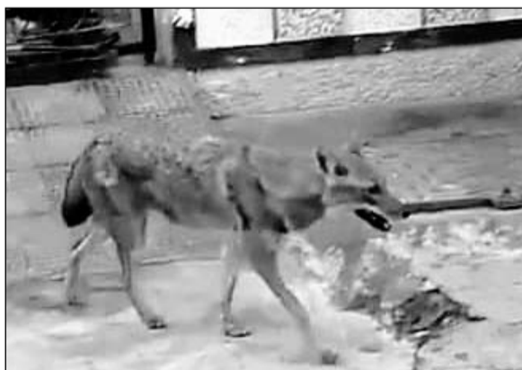
भीलवाड़ा की संजय कॉलोनी में सियार आने से दहशत फैल गई।