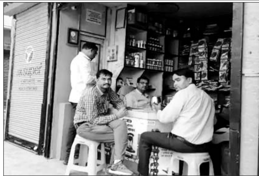
गंगापूर सिटी में खाद बीज की दुकानों का कृषि अधिकारियों की टीम ने निरीक्षण किया।

कृषि विभाग की टीम ने खाद-बीज की दुकानों पर निरीक्षण के दौरान खाद बीज के नमूने लिए