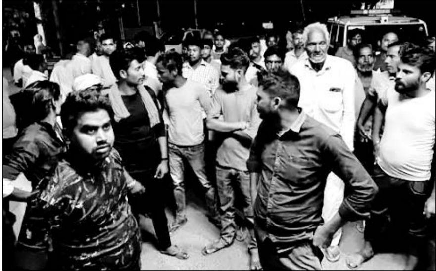
युवक के परिजन और ग्रामीणों ने अलवर सदर थाने के सामने घेराव किया।

मृतक के परिजन और ग्रामीणों ने रात को ही थाने पर हंगामा कर दिया।