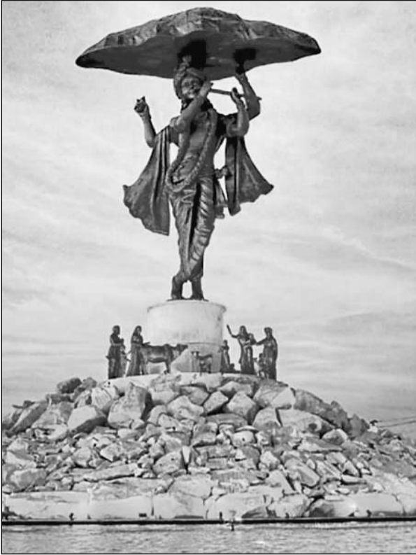
राजस्थान के ब्रज क्षेत्र में विकसित होने वाली पर्यटन नगरी में गोवर्धनधारी श्रीकृष्ण की 100 फीट ऊंची प्रतिमा स्थापित की जाएगी। आर्किटेक्ट अनूप बरतारिया ने पर्यटन नगरी के प्रेजेंटेशन के दौरान श्रीकृष्ण की वह तस्वीर प्रदर्शित की जिसके आधार पर विशाल प्रतिमा बनाई जाएगी।

डवलपमेंट भी किया जाएगा। राज्य सरकार, अप्सरा कुंड और नवल कुंड के मूल वैभव को पुनः लौटाने के साथ-साथ प्रसिद्ध श्रीनाथ जी मंदिर और नृसिंह अवतार मंदिर का भी पारंपरिक स्थापत्य कला के अनुसार सौंदर्यीकरण करेगा। पूरी तरह पर्यावरण अनुकूल इस परियोजना में नेशनल ग्रीन ट्रिब्यूनल गाइडलाइन्स का पूरी तरह से पालन किया जाएगा। परियोजना पूरी होने से राजस्थान के ब्रज क्षेत्र में भी देशी-विदेशी श्रद्धालुओं की आवक में भारी बढ़ोतरी होने का अनुमान है, जिसके कारण बढ़ने वाली आर्थिक गतिविधियों का फायदा स्थानीय लोगों को भी मिलेगा।