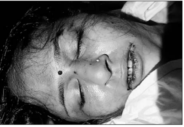
मृतक महिला के शरीर पर चोट के कई निशान थे।