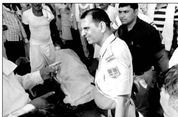
आरोपियों से समझाइश करते पुलिस अधिकारी।

वहीं मोक्षधाम तक जाने के लिए बनाये गये आम रास्ते पर हो रहे