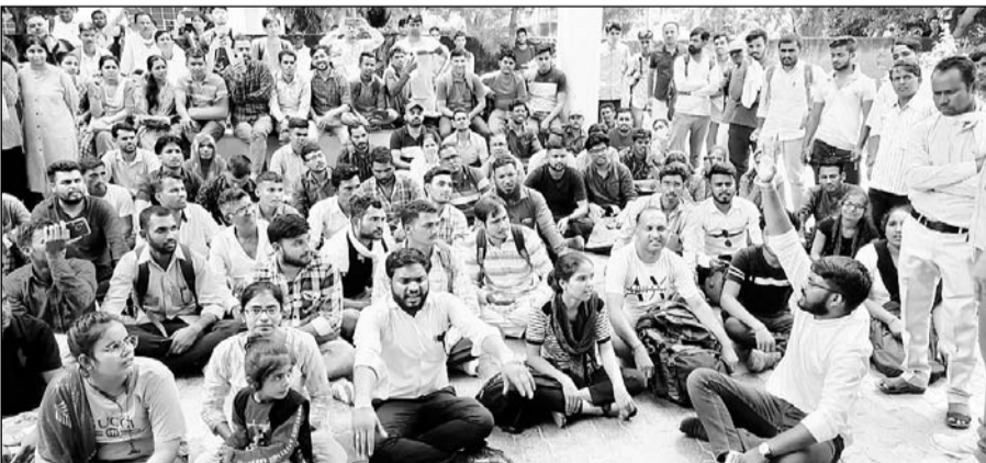
रीट परीक्षा के अभ्यर्थियों ने रीट कार्यालय का घेराव कर प्रदर्शन किया।

अजमेर, (कासं)। राजस्थान माध्यमिक शिक्षा बोर्ड द्वारा आगामी 23 व 24 जुलाई को आयोजित होने वाली प्रदेशस्तरीय रीट-2022 परीक्षा के हजारों की संख्या में अभ्यर्थियों ने सोमवार को रीट कार्यालय का घेराव कर नारेबाजी करते हुए प्रदर्शन किया और परीक्षा के एडमिट कार्ड जारी करने की मांग की।