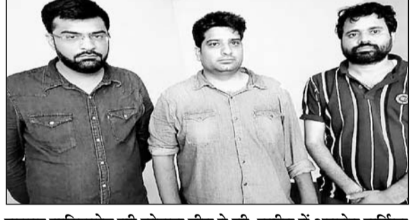
जयपुर कमिश्नरेट की स्पेशल टीम ने सी-स्कीम में अग्रसेन सर्किल पर स्थित स्काई जा रेस्टोरेंट में छापेमारी कर संचालक समेत 3 लोगों को गिरफ्तार किया।