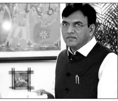
केंद्रीय मंत्री मनसुखभाई मंडाविया ने सांसद को विश्वास दिलाते हुए कहा कि इस संबंध में सकारात्मक कदम उठाते हुए अतिशीघ्र निर्णय लिया जाएगा।

हो पा रहा है। नियमों में मामूली संशोधन से राजसमंद को बड़ी सौगात मिल सकती है। चिकित्सा शिक्षा और स्वास्थ्य लाभ की दृष्टि से यह बड़ा कार्य होगा।