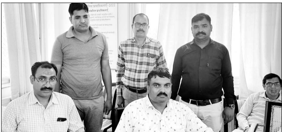
एसीबी के एएसपी ने कार्रवाई कर आरोपियों को गिरफ्तार किया।

भीलवाड़ा, (निसं)। भीलवाड़ा की एसीबी प्रथम ने चित्तौड़गढ़ जिले के चंदेरिया थाने में तैनात एक कांस्टेबल को 2,000 रुपये की रिश्वत लेते री हाथ गिरफ्तार किया है। इस कार्रवाई से थाना स्टॉफ में खुलबली मच गई।