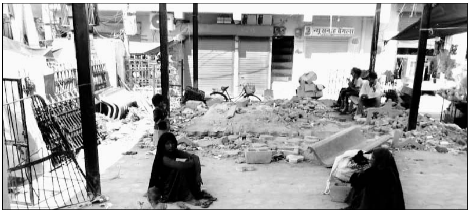
बदहाल हालत में सुभाष चौक स्थित एजे खत्री सार्वजनिक पार्क।