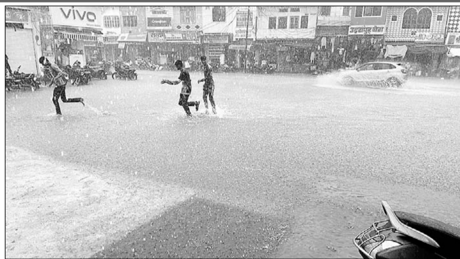
निम्बाहेड़ा करवे में बरसात का लुत्फ उठाते युवक।

लागाया। नवलखा ने बताया कि भाजपा के शासन काल में जिस प्रकार वर्षा ऋतु से पूर्व ही नगर के नालों आदि की सफाई समय रहते करवा ली जाती थी। दूसरी ओर वर्तमान कांठोस बोर्ड ने वर्षों से पूर्व नालों की सफाई के लिए निविदा तक निकालना उचित नहीं समझा, जिस वजह से नालों की सफाई के अभाव में नगर के बस स्टैंड, मोतीबाजार, शेखात सर्कल, इंद्र कॉलोनी, निवेदिता कॉलोनी, शास्त्री मार्केट, छोट्टीसाइड रोड सहित नगर के विभिन्न क्षेत्रों में जलभराव की स्थिति होकर लोगों के घरों में नालों का गन्दा पानी भर गया जिससे आम लोगों को परेशानी उठानी पड़ी। यदि कांठोस शासित नगर पालिका बोर्ड यदि समय रहते नगर के प्रति गम्भीर हो जाता तो आज यह स्थिति नहीं होती।