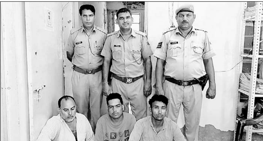
भरतपुर में थाना उद्योग नगर पुलिस ने आरोपियों को गिरफ्तार किया।

करीब दो दर्जन से अधिक वारदातों को दे चुके हैं अंजाम