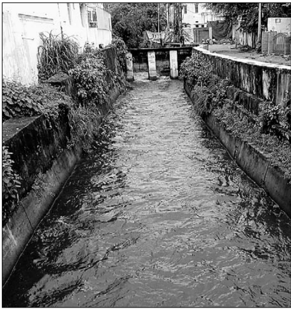
उदयपुर की फतहसागर झील में मदार नहर से आता पानी। झील का जलस्तर साढ़े छह फीट हो गया है।

उदयपुर, (कासं)। लेकसिटी में सावन के पहले सोमवार पर खुशनुमा मौसम के बीच होती बूंदबांदी ने प्रकृति के स्वरूप को निखार दिया। शाम 5 बजे तक जिले में सर्वाधिक बारिश बागोलिया में 6.2 मिमी (करीब ढाई इंच) रिफॉर्ड की गई। दिन के तापमान में चार डिग्री की गिरावट के साथ ही दोनों ही तापमान में केवल ढाई डिग्री