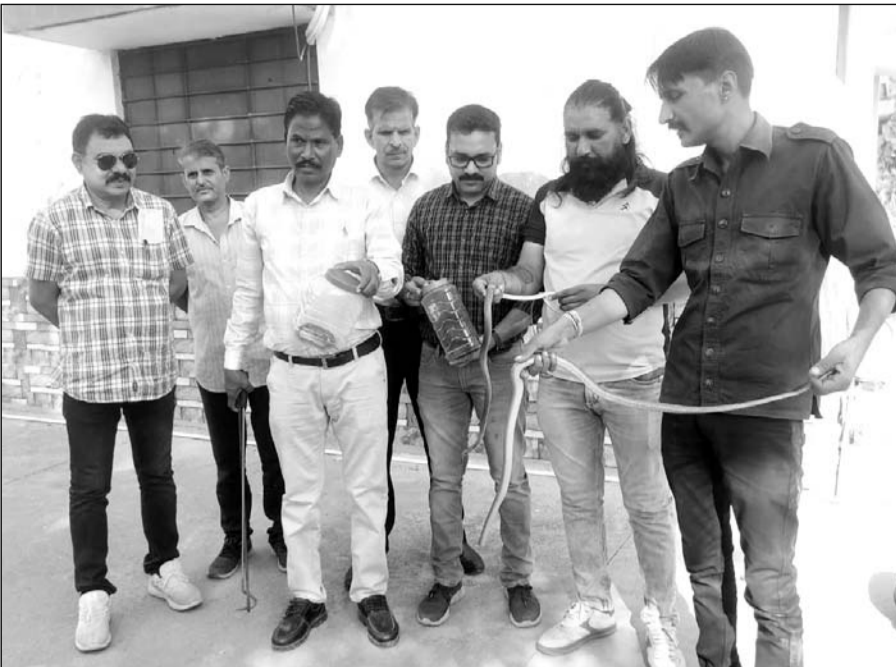
भीलवाड़ा के एसीबी के ऑफिस के पानी के होद में सांप मिलने से कार्यालय में दहशत फैल गई।

भीलवाड़ा। एसीबी के ऑफिस में बनी पानी की होद में सांप नजर आने के बाद कार्यालय में दहशत फैल गई। सांप की सूचना पर एनमल केचर मौके पर पहुंचे तो पानी के टैंक में सांपों का डेरा देख के सभी के होश उड़ गए।