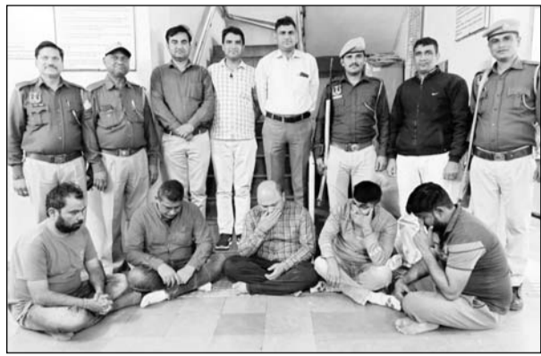
सांगानेर पुलिस ने होटल में जुआ खेल रहे पांच लोगों को रविवार रात को गिरफ्तार किया।