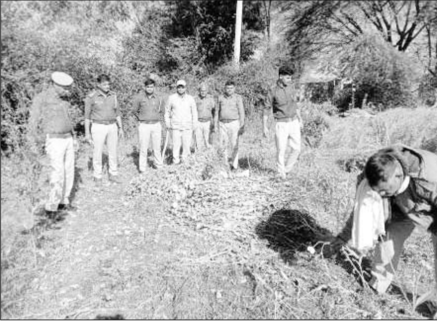
जिला मुख्यालय के समीप पदेवा गांव में पुलिस ने अवैध रूप से की जा रही अफीम की खेती पकड़ी।

पुलिस को पदेवा गांव के खेतों में अफीम की अवैध खेती होने की सूचना मिली थी