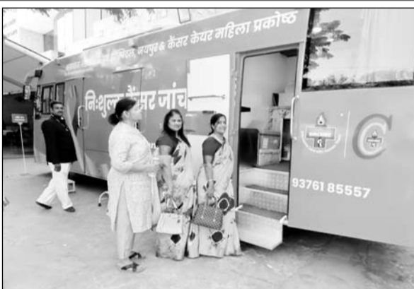
भगवान महावीर कैंसर चिकित्सालय एवं अनुसंधान केंद्र तथा कैंसर केयर महिला प्रकोष्ठ की ओर से कैंसर जांच शिविर लगाया गया।

कोठारी ने बताया कि कैंसर जांच व जागरूकता के लिए प्रदेश के 33 जिलों में पंचायत स्तरों पर कैंसर जांच एवं जागरूकता शिविर का निःशुल्क आयोजन किया जा रहा है। इस मुहिम का उद्देश्य कैंसर रोगियों की पहचान कर उन्हें समय पर उपचार मुहैया करवाना है। अभियान में स्नन कैंसर, सरवाइकल कैंसर, ओवरी कैंसर, ब्रस्ट कैंसर, ओरल कैंसर, प्रोस्टेट कैंसर और लंग कैंसर की जांच सुविधाओं को जोड़ा गया है। इस अभियान के तहत तैयार स्पेशल कैंसर स्क्रीनिंग बस के जरिए मैमोग्राफी, एक्स-रे और खून जांच आमजन को