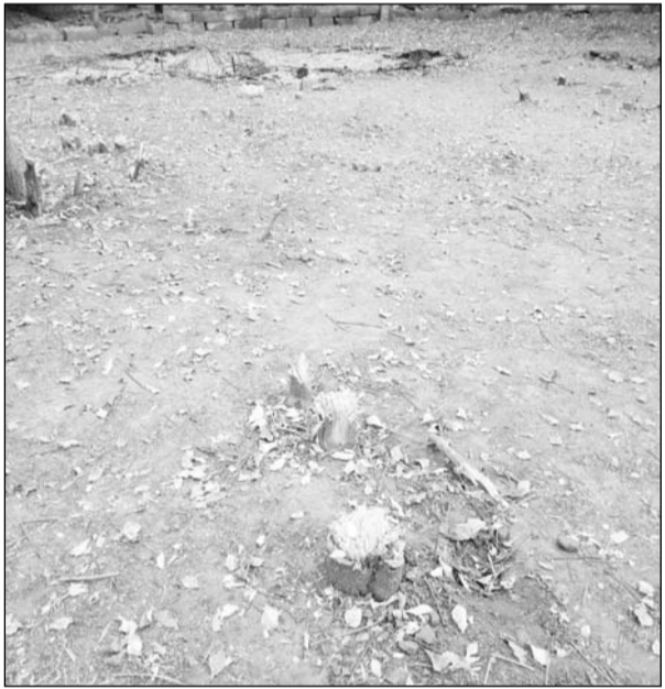
देवली में मनरेगा कार्य की आड़ में हरे पेड़ों की कटाई हो रही है।

देवली, (निसं)। इन दिनों पालिका ने बिना कारण हरे वृक्षों को काटे जाने की हठधर्मिता अपनाई हुई है। यहां आएदिन हरे वृक्ष पालिका की मनमानी व बद नियत के शिकार हो रहे हैं। ऐसा ही एक मामला फिर से सोमवार को सामने आया कि शहर के पेड़ोल पंप चौराहे स्थित सार्वजनिक निर्माण विभाग के विश्राम गृह परिसर में फल फूल रहे अनगिनत वृक्षों में से लगभग 5 दर्जन हरे वृक्षों की कटाई पालिका के नरेगा कर्मियों ने कर डाली।