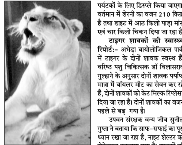
कोटा अभेड़ा बायोलोजिकल पार्क में शेरनी सुहासिनी आई।