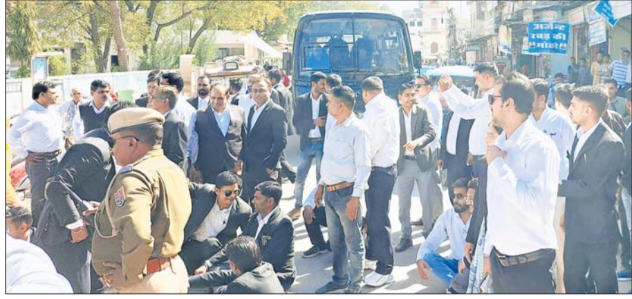
अधिवक्ताओं ने कलेक्टर के बाहर सड़क पर जाम लगाकर जिला कलेक्टर के खिलाफ नारेबाजी की।