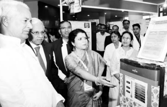
चिकित्सा मंत्री परसादी लाल मीणा ने एम.एम.एस. मेडिकल कॉलेज में लाइफ ऑफ साइंस एग्जीबिशन का उद्घाटन किया।

जयपुर (कासं)। आज गर्व से कह सकते हैं कि हमारा एसएमएस मेडिकल कॉलेज देश के टॉप इंस्टिट्यूट में आता है और राजस्थान के हर जिले में मेडिकल कॉलेज है। 2024 तक सभी मेडिकल कॉलेज में पढ़ाई शुरू हो जाएगी और प्रदेश में डॉक्टरों की कमी नहीं रहेगी। एसएमएस मेडिकल कॉलेज में लाइफ ऑफ साइंस एग्जीबिशन के उद्घाटन पर चिकित्सा मंत्री परसादी लाल मीणा ने यह बात कही। 20 से 28 फरवरी तक एसएमएस मेडिकल कॉलेज के एकेडमिक ब्लॉक में इस एग्जीबिशन में सभी विभागों द्वारा मेडिकल साइंस से जुड़ी जानकारीयों को