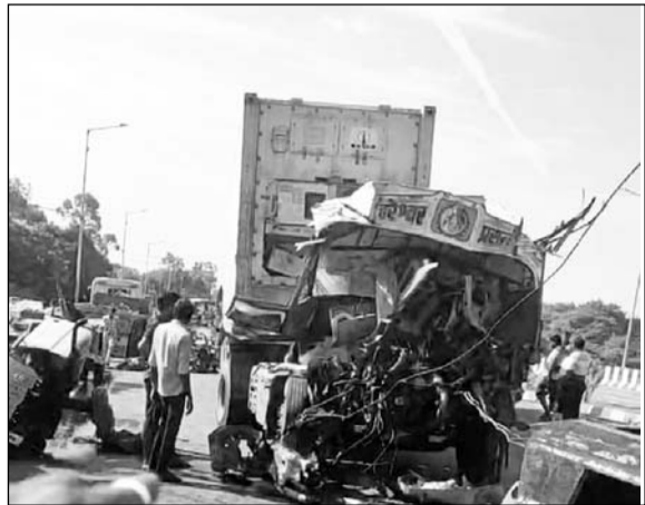
हादसे में ट्रक के आगे का हिस्सा क्षतिग्रस्त हो गया।