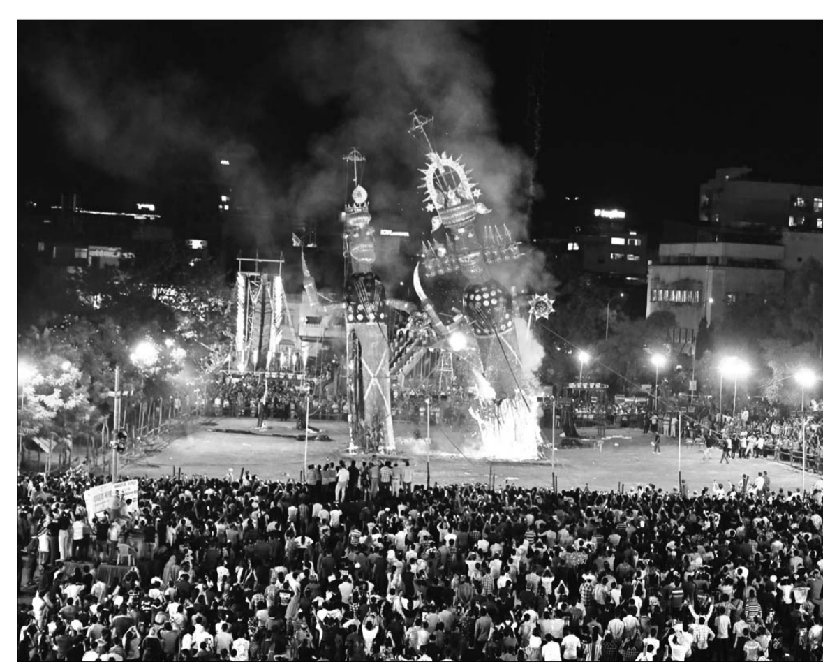
आदर्श नगर मैदान में दशहरा उत्सव पर रिमाझिम बरसात के बीच रावण दहन हजारों दर्शकों की तालियों की गडगडाहट के बीच किया गया।

2023 की तुलना में 2024 में हत्या के मामलों में 13 प्रतिशत, बलाघात में 76 प्रतिशत, और बलात्कार के मामलों में 7 प्रतिशत की कमी दर्ज की