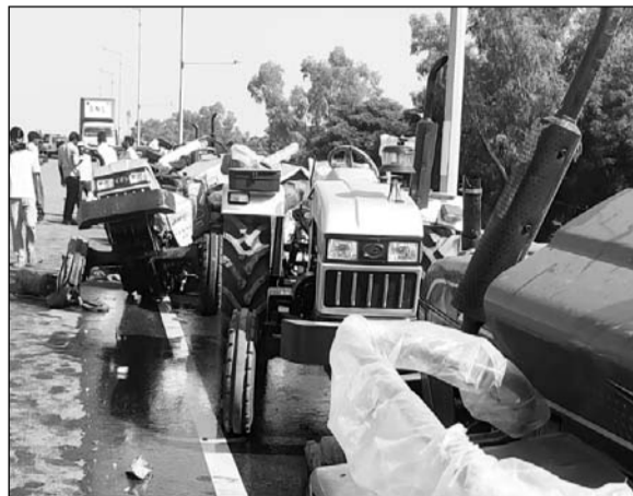
ट्रेलर में ट्रैक्टर भरे हुए थे, वह भी काफी मात्रा में क्षतिग्रस्त हो गए।

ब्रिज पर गुरुवार को बड़ा हादसा हो गया, जहां एक ट्रेलर अनियंत्रित होने के कारण गलत दिशा में चला गया और सामने से आ रहे कंटेनर को टक्कर मार दी, जिसके कारण कंटेनर चालक की मौत पर ही दर्दनाक मौत हो गई। वहीं ट्रेलर चालक गंभीर घायल हो गया, जिसे गुलाबपुरा