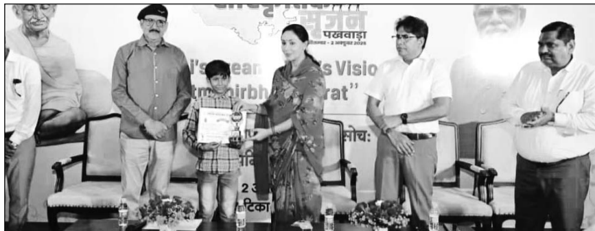
उपमुख्यमंत्री दिया कुमारी ने स्वयंसिद्धा हस्तशिल्प प्रदर्शनी में कलाकारों को सम्मानित किया।

उन्होंने प्रदर्शनी का विधिवत उद्घाटन कर स्वदेशी शिल्प,