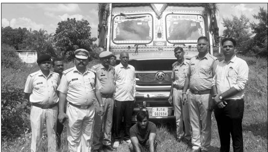
आबकारी निरोधक दल ने अवैध शराब जब्त कर चालक को गिरफ्तार किया।

पेपर रोल की आड़ में हरियाणा की शराब अवैध रूप से गुजरात ले जाई जा रही थी