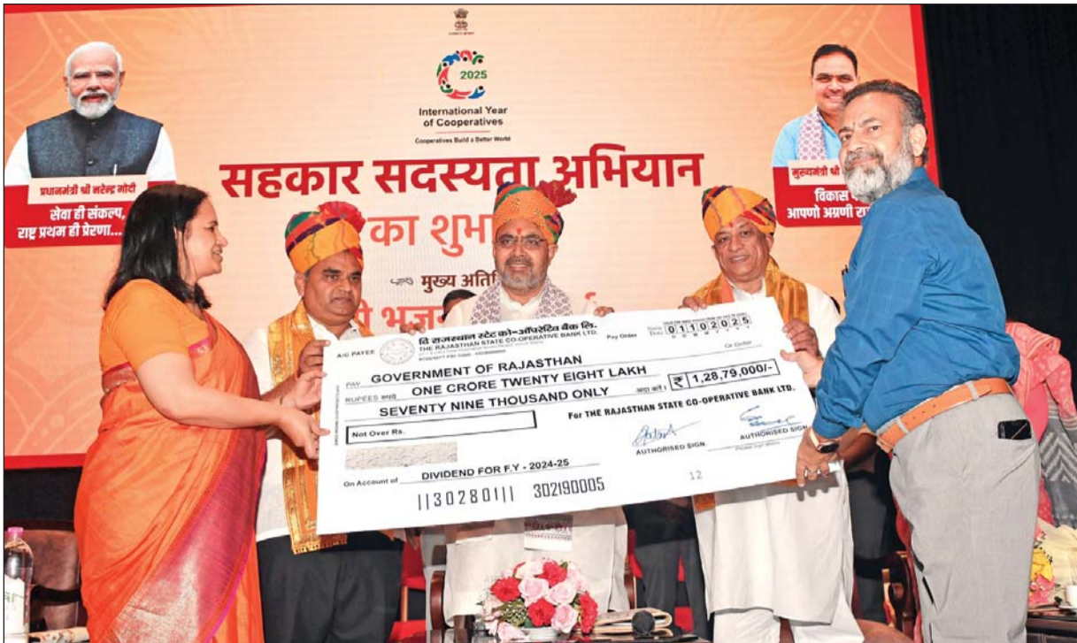
मुख्यमंत्री भजनलाल शर्मा ने संविधान क्लब में आयोजित सहकार सदस्यता अभियान के शुभारंभ समारोह को संबोधित किया। इस अवसर पर उन्हें एपेक्स बैंक द्वारा 1.28 करोड़ रुपये और कॉनफेड द्वारा 21.73 लाख रुपये की लाभांश राशि के प्रतीकात्मक चेक भी भेंट किए गए।