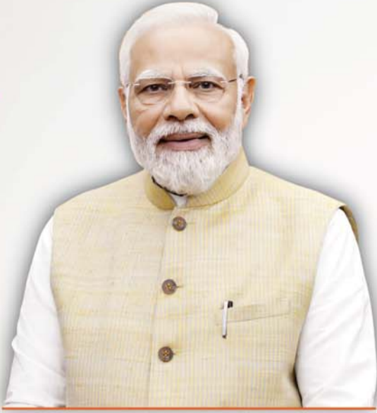
श्री नरेंद्र मोदी, प्रधानमंत्री