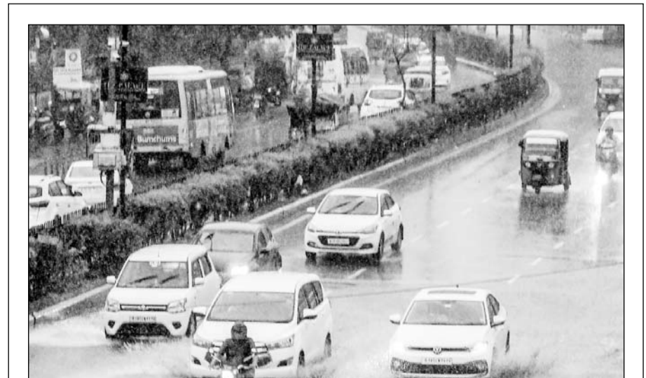
मानसून की आवक के साथ ही शनिवार को सुबह से ही जयपुर में काले-काले बादलों की आवाजाही लगी रही। शाम होते-होते तेज बारिश के कारण सड़कों पर पानी ही पानी भर गया।