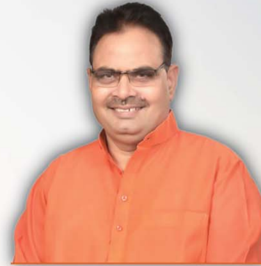
श्री भजनलाल शर्मा, मुख्यमंत्री

समृद्ध किसान - खुशहाल राजस्थान राजस्थान सरकार की ऐतिहासिक पहल 65 लाख से अधिक किसानों को ₹650 करोड़