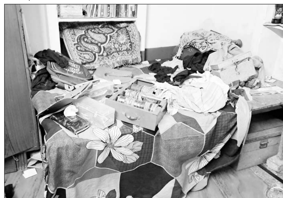
मकान में चोरी की वारदात के बाद सामान बिखरा पड़ा है।

परिवार के लोग उत्तर प्रदेश के इटावा शहर में रिश्तेदारी में शादी समारोह में गए थे