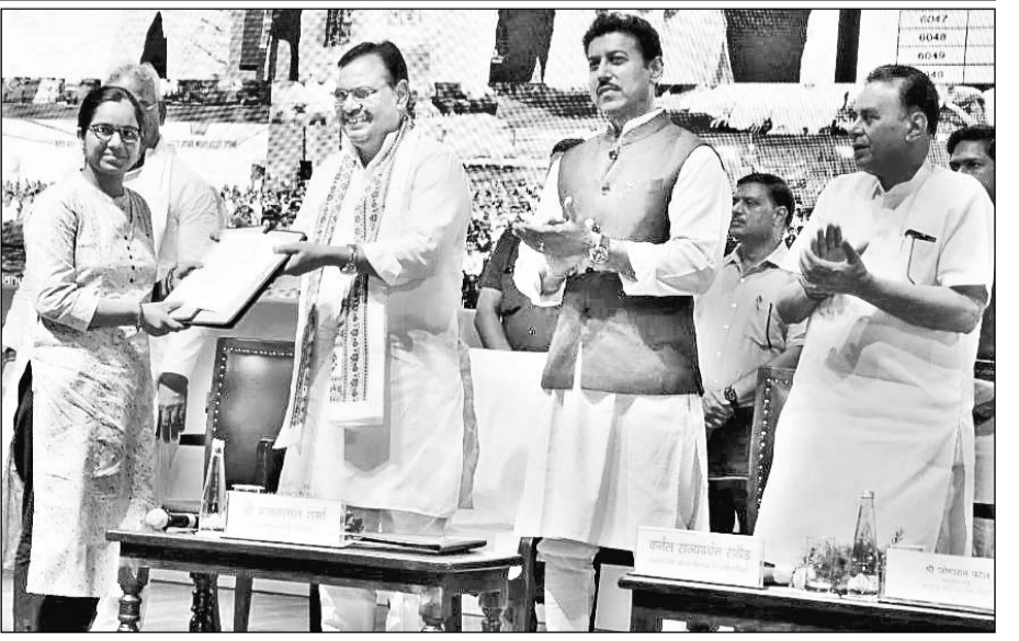
प्रदेश में पहली बार "मुख्यमंत्री रोजगार महोत्सव" आयोजित हुआ। राज्य स्तरीय समारोह का आयोजन मानसरोवर स्थित टैगोर इंटरनेशनल स्कूल के ऑडिटोरियम में हुआ। कार्यक्रम में मुख्यमंत्री भजनलाल शर्मा ने अपने हाथों से राजकीय सेवाओं में नवनि्युक्त कार्मिकों को नियुक्ति पत्र बांटे।

रोजगार उत्सव" आयोजित किए जाएंगे। राज्य सरकार युवाओं को रोजगार देने के संकल्प पत्र के वादे को पूरा करने के लिए पारदर्शी एवं समयबद्ध भर्ती परीक्षाओं का आयोजन सुनिश्चित कर रही है। शर्माने कहा कि, प्रदेश में रोजगार (शेष अंतिम पृष्ठ पर)