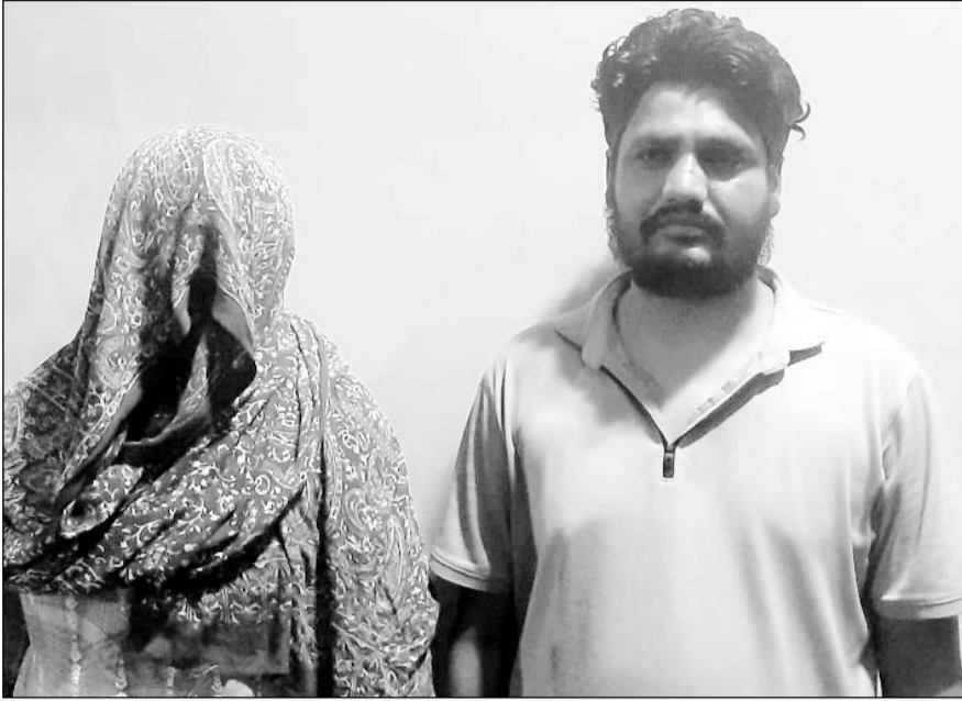
तृतीय श्रेणी शिक्षक भर्ती व अन्य प्रतियोगी परीक्षाओं में फर्जीवाड़े में दो को गिरफ्तार किया।