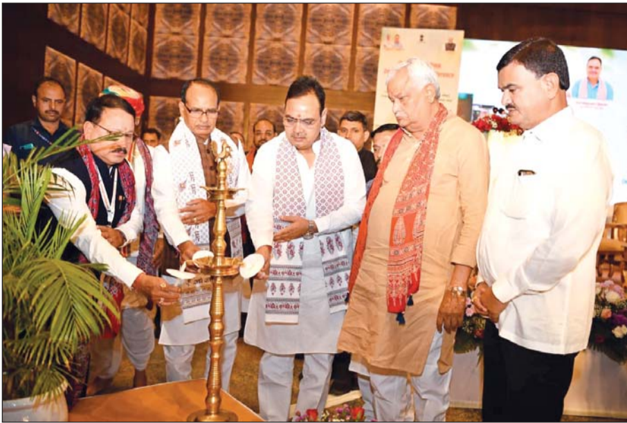
केन्द्रीय कृषि एवं किसान कल्याण मंत्री शिवराज सिंह चौहान व मुख्यमंत्री भजनलाल शर्मा ने मंगलवार को जयपुर में आयोजित पश्चिमी क्षेत्रीय सम्मेलन का उद्घाटन किया।

■ केन्द्रीय कृषि मंत्री शिवराज सिंह ने कहा कि पलने क्षेत्रीय सम्मेलन राजस्थान में हो रहा है। इसमें कृषि क्षेत्र की आवश्यकताओं, चुनौतियों व संभावनाओं को समझने का एक मंच मिलेगा और कृषि क्षेत्र को नई दिशा मिलेगी।