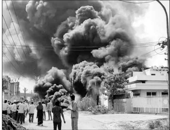
भिवाड़ी के यूआईटी औद्योगिक क्षेत्र में फैक्ट्रियों में लगी आग के बाद मौके पर लोग जमा हो गये।

जानकारी के अनुसार रामको मेटल कंपनी के ऊपर रखे ऑयल टैंकर में ब्लास्ट हुआ और आग लग गई। टैंकर से निकला ऑयल ब्लास्ट के साथ अलशोक एलएलपी कंपनी में फैल गया। जिससे इस कंपनी में भी आग लग गई। अलशोक कंपनी के कर्मचारी ने बताया कि आग की शुरुआत पड़ोस की कंपनी की छत पर रखे एक ऑयल टैंकर से हुई। इसके बाद आग अलशोक एलएलपी में फैल गई। आग लगने के समय कंपनी के