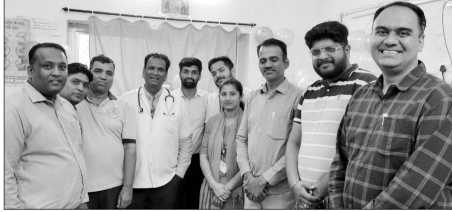
जोधपुर के महिला बाग जिला अस्पताल में सीबीसी 5 130 हेमेटोलॉजी ऑटो एनालाइजर तथा हार्मोन एनालाइजर मशीन से जांच सेवाओं का शुभारंभ किया।

जोधपुर, (कासं)। महिला बाग जिला अस्पताल में मरीजों को बेहतर एवं आधुनिक जांच सुविधाएं उपलब्ध कराने की दिशा में एक महत्वपूर्ण पहल करते हुए सीबीसी 5130 हेमेटोलॉजी ऑटो एनालाइजर तथा हार्मोन एनालाइजर मशीन से जांच सेवाओं का शुभारंभ किया गया।