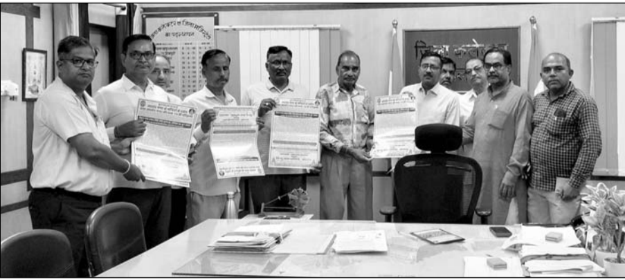
जालोर में हिन्दू सेवा समिति ने नगर परिक्रमा को लेकर संस्थाओं, समाजों तथा प्रशासनिक अधिकारियों को आमंत्रण पत्रिका देकर आमंत्रित किया।

भव्य मन्दिर दर्शन व नगर परिक्रमा शुरूवार को सुबह 6.30 बजे सूरजपोल स्थित गणपति मन्दिर से आरती के साथ प्रारम्भ होगा। बीच रास्ते के मन्दिर दर्शन के साथ रोडवेज डिपो स्थित माताजी मन्दिर, जागनाथ महादेव मन्दिर, कालिका मन्दिर, देवनारायण मन्दिर,