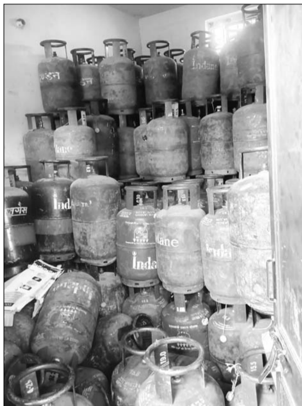
की गई कार्रवाई में कुल 302 धरेलू एवं व्यावसायिक गैस सिलेंडर तथा दो पिकअप वाहन (आरजे-14-जीआर-7835 और आरजे-14-जीएच-5920) जब्त किए गए। मामले में सिलप दो व्यक्तियों के खिलाफ संबंधित पुलिस थानों में एफआईआर दर्ज कराने की कार्रवाई की जा रही है।