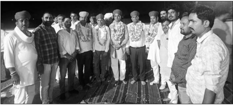
जालोर शहर में गंगा विहार कॉलोनी में लोगों ने भाजपा ओबीसी मोर्चा के प्रदेश उपाध्यक्ष ओबारा म देवासी का स्वागत किया।