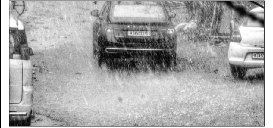
राजधानी जयपुर में शुक्रवार शाम तेज बारिश के साथ ओले भी गिरे। फोटो-राष्ट्रदूत

-कार्यालय संवाददाता- जयपुर । पश्चिम विक्षोभ के असर से शुक्रवार को जयपुर सहित 18 शहरों में बारिश हुई। बीकानेर, जैसलमेर, श्रीगंगानगर, जयपुर, अलवर सहित अन्य कुछ शहरों में ओलावृष्टि देखने को मिली। इससे रबी की फसलों का भारी नुकसान हुआ है। रैगिस्तानी इलाकों में ओलावृष्टि से कश्मीर देखा दृश्य बन गया।