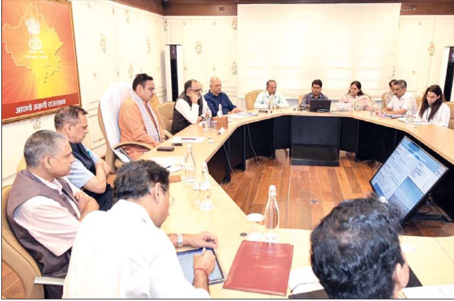
मुख्यमंत्री भजनलाल शर्मा ने शुक्रवार को मुख्यमंत्री कार्यालय में राष्ट्रीय जलमार्ग-48 को लेकर अहम बैठक की।

■ मुख्यमंत्री भजनलाल शर्मा ने भारतीय अंतर्देशीय जल मार्ग प्राधिकरण एवं आईआईटी मद्रास को प्रोजेक्ट के तकनीकी व वित्तीय आंकलन तथा जहाजों के अनुमानित ट्रैफिक की तुलनात्मक व अध्ययन रिपोर्ट तैयार करने के भी निर्देश दिए।