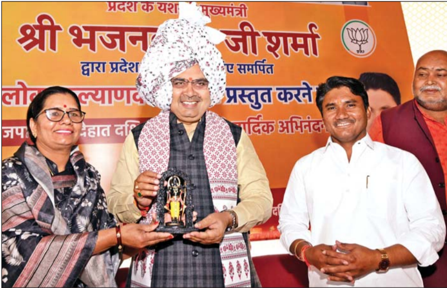
जयपुर देहात (दक्षिण) की ओर से आए प्रतिनिधिमंडल ने बजटीय घोषणाओं के लिए मुख्यमंत्री भजनलाल शर्मा का स्वागत किया। इस अवसर पर आमजन ने मुख्यमंत्री को स्मृति चिन्ह भेंट कर सम्मानित किया।

मुख्यमंत्री ने कहा कि इस वर्ष का मुख्यमंत्री भजनलाल ने कहा कि जयपुर के विस्तार के साथ, आस-पास के इलाकों में सुख-सुविधाओं के विस्तार के लिये बजट में अनेक प्रावधान किये गये हैं।