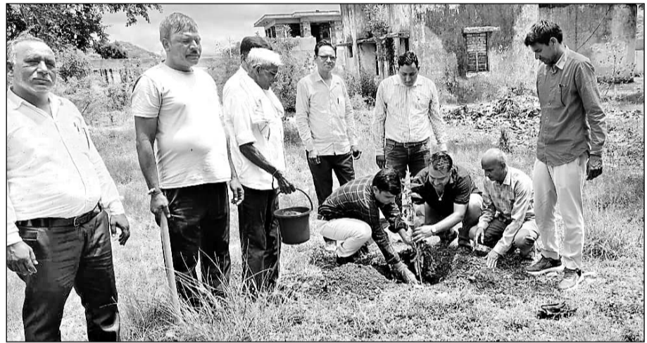
सी.ई.ओ. ने विभिन्न किस्मों के पौधों का रोपण कराकर उनके पालन पोषण के निर्देश दिए।

उन्होंने निर्देश दिए कि ग्राम पंचायत में एसजीएसवाई योजना के तहत निर्मित दुकानों की मरम्मत कराकर नियमानुसार किराए से दी जावे। विभागीय निर्देशानुसार कार्यालय के