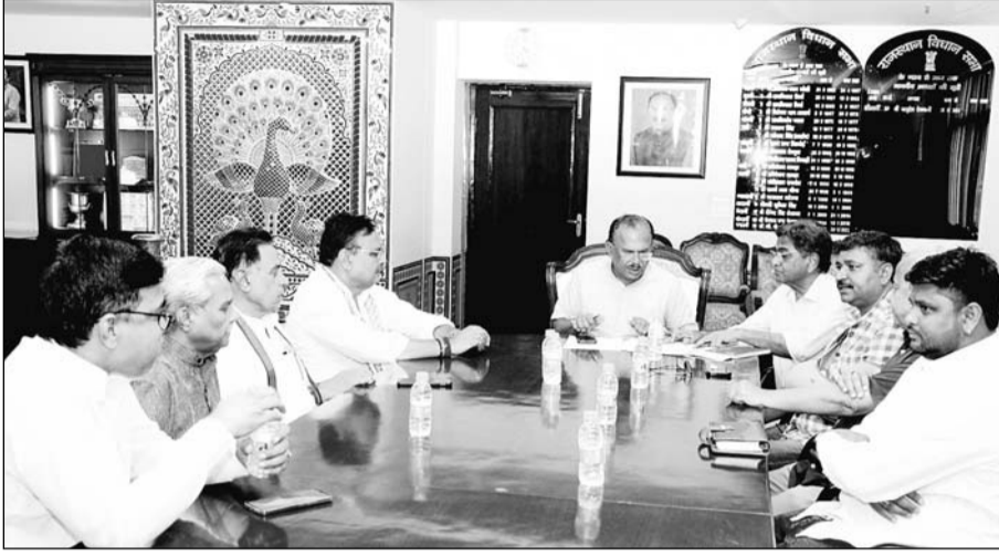
विधानसभा के सत्र की बैठक से पहले मंगलवार को अध्यक्ष वासुदेव देवनानी की अध्यक्षता में सर्वदलीय बैठक बुलाई गई। बैठक में मुख्यमंत्री भजनलाल शर्मा और प्रतिपक्ष नेता टीकाराम जूली सहित अन्य दलों के नेता मौजूद थे।

देवनानी ने कहा कि सदन की कार्यवाही को आम जनता देखती है। प्रदेश की जनता से चुनकर आये जनप्रतिनिधिगण अपने आचरण और व्यवहार को जन आकांक्षाओं के अनुकूल प्रस्तुत करें, ताकि विधान सभा का नाम रोशन हो सके। देवनानी ने कहा है कि विधान सभा सदन नियमों व मर्यादाओं से चलेगा। उन्होंने सभी दलों से सदन को शांतिपूर्ण चलाने में सहयोग करने और सार्विक बहस में अपनी बात समय सीमा में रखने के लिए कहा। विधान सभा अध्यक्ष वासुदेव देवनानी ने सर्वदलीय बैठक की अध्यक्षता करते हुए कहा कि सदन में सार्विक चर्चा होनी चाहिए। सभी सदस्यों को बोलने का मौका मिलेगा।