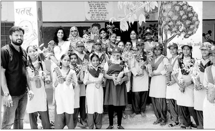
बूंदी डाईट परिसर में पौधारोपण के साथ एक छात्र पांच पौधे लगाने की शुरुआत की।