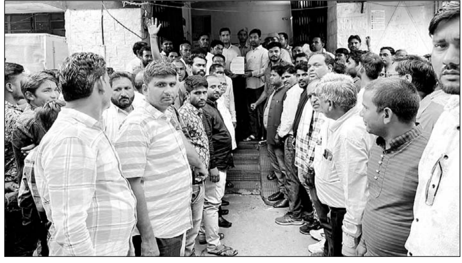
बारां में होटल व्यवसायी व डॉक्टर के मध्य हुए विवाद को लेकर अखिल भारतीय धरणीधर महोत्सव समिति छबड़ा ने कलेक्टर के नाम ज्ञापन प्रेषित कर घटना की निंदा करते हुए निष्पक्ष कार्रवाई की मांग की।

डीएसपी नागर की ईमानदार छवि को धूमिल करने के लिए शड्यंत्रकारी मामला दर्ज करवाया गया है। धाकड़ समाज इस घटना की निंदा करता है। धाकड़ समाज ने जिला कलेक्टर से होटल संचालक व उसके स्टॉफ के