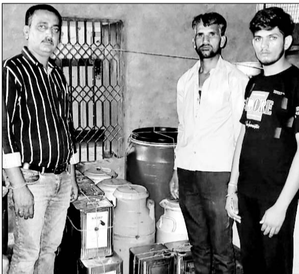
जालौर शहर के निक्ट सारणेश्वर डेयरी पर खाद्य सुरक्षा टीम ने दुध व घी के सैम्पल भरे गये।