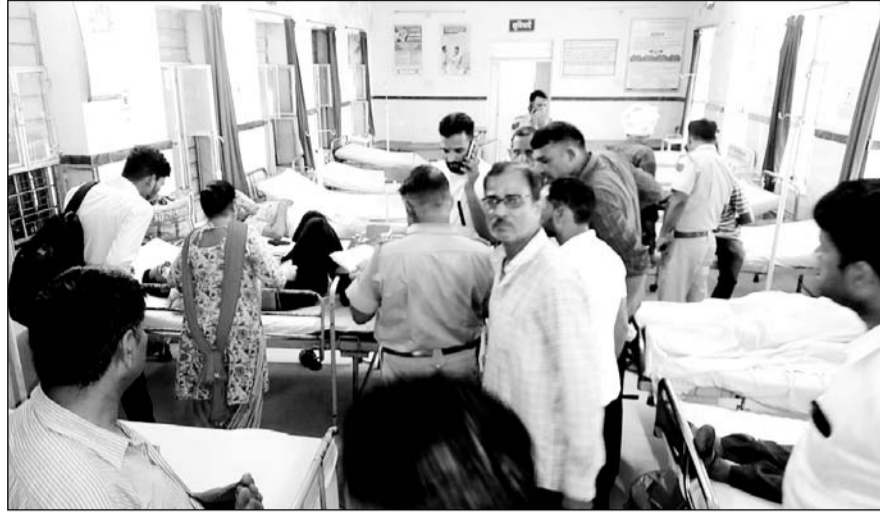
कानरपुरा बस स्टैंड पर हुए हादसे में घायलों को कालाडेरा सामुदायिक स्वास्थ्य केन्द्र में भर्ती कराया।

चौमू/कालाडेरा, (निर्स)। चौमू-रेनवाल मार्ग पर स्थित कानरपुरा बस स्टैंड पर मंगलवार सुबह लगभग 7.30 बजे ट्रेलर-पिकअप और जीप की हुई भीषण टक्कर में 2 लोगों की मौत व 9 लोग घायल हो गये।