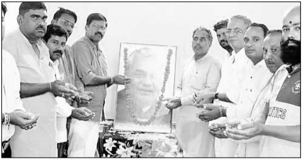
अटल बिहारी वाजपेयी के चित्र पर पुष्प अर्पित करते कार्यकर्ता।