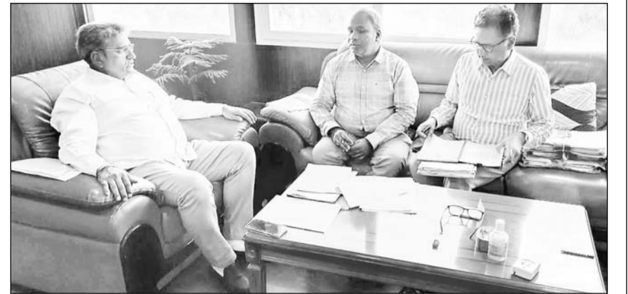
पशुपालन मंत्री लालचंद कटारिया ने लम्पी स्किन डिजीज को लेकर वरिष्ठ अधिकारियों के साथ बुधवार को पंत कृषि भवन में बैठक ली।