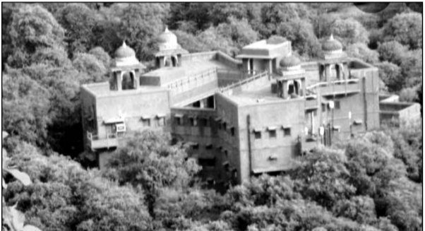
होटल कासल झूमर बावड़ी।

करोड़ रुपये बजट का प्रावधान किया है। उन्होंने कहा कि राज्य सरकार का उद्देश्य न सिर्फ होटल इण्डस्ट्रीज को आर्थिक लाभ पहुंचाना है बल्कि होटल इण्डस्ट्री में बूम भी ले करके आना है। उन्होंने कहा कि होटल कैसल झूमर बावड़ी आरटीडीसी के चुनित्रदा सम्पत्ति में से एक है जिसका 1 करोड़ 2 लाख 58 हजार रुपये की राशि से जौनोंद्वार कर हेरिटेज रूप दिया जायेगा। उन्होंने कहा कि निगम की शाहीरेल गाड़ी पैसेस ऑन व्हील को भी शीघ्र ही शुरू किया जाएगा। इसके लिए निगम रेल मंत्रालय