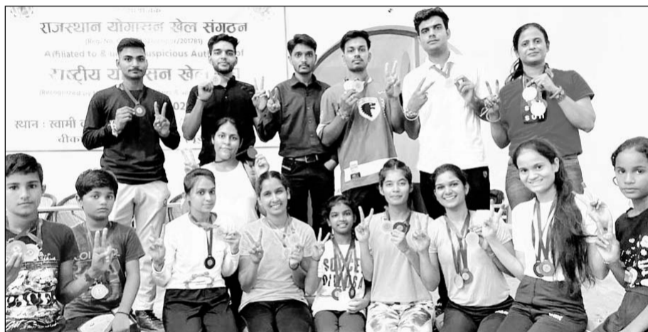
सरदारशहर में आयोजित प्रतियोगिता में सुजानगढ़ के पदकवीर।

सुजानगढ़, (निसं)। नेशनल योगासन स्पोर्ट्स फेडरेशन के तत्वाधान में अमृत महोत्सव के तहत सरदारशहर के जाट विकास द्वारा आयोजित जिला स्तरीय योगा प्रतियोगिता में सुजानगढ़ के 17 प्रतियोगियों ने गोल्ड, सिल्वर व कांस्य कुल 33 पदक जीत कर शहर का नाम रोशन किया है।