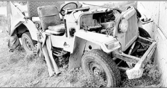
आमने-सामने की टक्कर में कमांडर जीप के परखच्चे उड़ गए।

सादलपुर, (निर्स)। जिले की राजगढ़ तहसील के जाहरवीर गोगापीर की जन्म स्थली ददरेवा में भरने वाले ऐतिहासिक लकड़ी मेले में दर्शन कर वापस लौट रहे उत्तरप्रदेश के जातरूओं से भरी जीप व बोलेरो की हुई टक्कर में जीप में सवार तीन लोगों की मौके पर ही मौत हो गई, जबकि पांच लोग घायल हो गये। घायलों को कस्बा राजगढ़ के श्रीनाथ अस्पताल एवं रायका हॉस्पिटल राजगढ़ में भर्ती करवाया गया, जहाँ उपचाराधीन बताया जा रहे हैं।