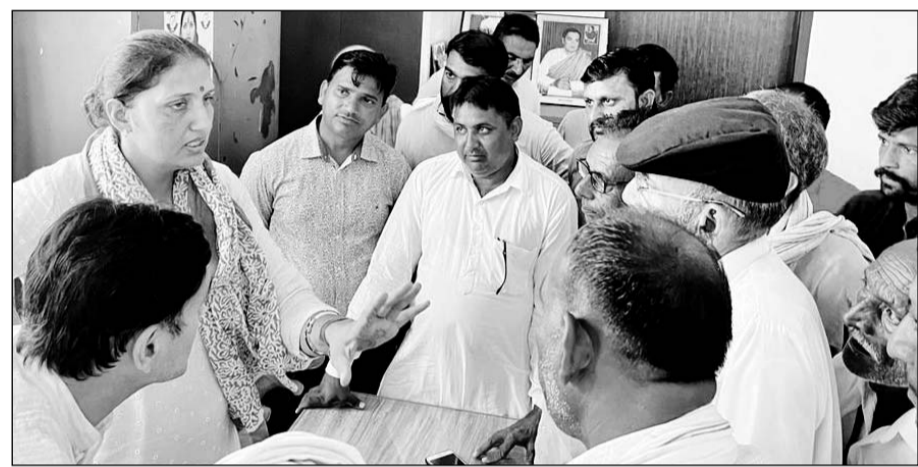
सादलपुर विधायक पदमश्री डॉ. कृष्णा पुनिया ने विधायक निवास पर जनसुनवाई की।

सादलपुर, (निसं)। स्थानीय विधायक पदमश्री डॉ. कृष्णा पुनिया ने बुधवार को विधायक निवास स्थान पर जन सुनवाई की। जिसमें शहरी व ग्रामीण क्षेत्र से आये लोगों की समस्याओं को विस्तारपूर्वक सुना और विधायक पुनिया ने समस्याओं को सुनने के उपरान्त सम्बन्धित अधिकारियों को लोगों की शिकायतों का प्राथमिकता से निपटान करने के निर्देश दिये। विधायक डॉ. कृष्णा पुनिया ने कहा