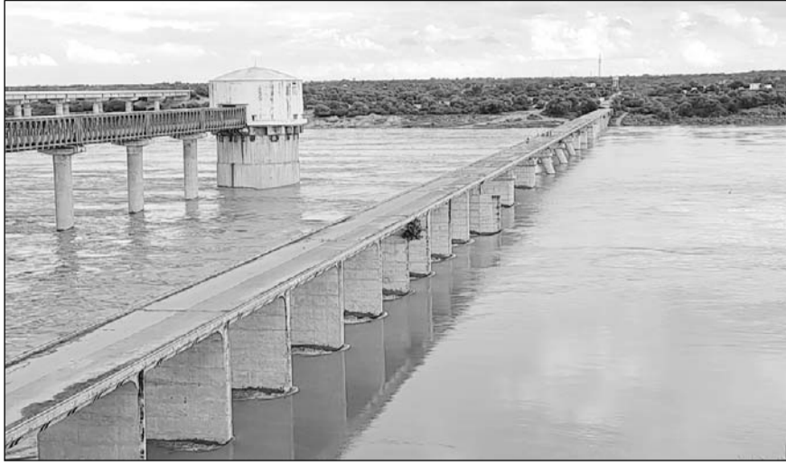
धौलपुर में गुरुवार को चम्बल के खतरे के निशान से ऊपर बहने की संभावना बनी हुई है।

धौलपुर, (निर्स)। कोटा बैराज से पानी छोड़े जाने के कारण चम्बल नदी में लगातार जल स्तर बढ़ रहा है। जिसके चलते गुरुवार को धौलपुर जिले में चंबल नदी रौद्र रूप