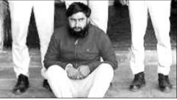
दूध में मिलावट के मामले में पुलिस ने एक जने को गिरफ्तार किया।