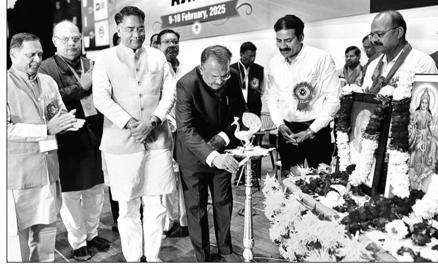
राजस्थान विधानसभा अध्यक्ष वासुदेव देवनानी ने नेशनल ऑर्गेनाइजेशन ऑफ इंड्योरेंस वर्कर्स की 19वीं त्रैवार्षिकी ऑल इण्डिया कॉन्फ्रेंस का शुभारंभ किया।

जयपुर। विधानसभा अध्यक्ष वासुदेव देवनानी ने कहा है कि आज का भारत एक वृहद दृष्टिकोण के साथ आगे बढ़ रहा है। हम विश्वगुरु थे और रहेंगे। प्रधानमंत्री नरेन्द्र मोदी के नेतृत्व में आज पूरे विश्व में भारत की अलग पहचान है। वर्ष 2047 तक हम निश्चित रूप से विकसित भारत बन जाएंगे। नेशनल ऑर्गेनाइजेशन ऑफ इंड्योरेंस वर्कर्स की 19वीं त्रैवार्षिकी ऑल इण्डिया कॉन्फ्रेंस अजमेर में आयोजित हुई। इसमें पूरे देश के भारतीय जीवन बीमा निगम के कार्मिकों ने भाग लिया। अधिवेशन को सम्बोधित करते हुए विधानसभा अध्यक्ष वासुदेव देवनानी ने कहा कि देश एक वृहद विजन के साथ आगे बढ़ रहा है। वर्ष 2047 तक हम निश्चित रूप से एक विकसित राष्ट्र बन जाएंगे। प्रधानमंत्री नरेन्द्र मोदी ने देश को जो सशक्त बनाया है वह हमें पूरी दुनिया में सबसे मजबूत और शक्तिशाली बना रहा है। उन्होंने एलआईसी कार्मिकों का आवाहन किया