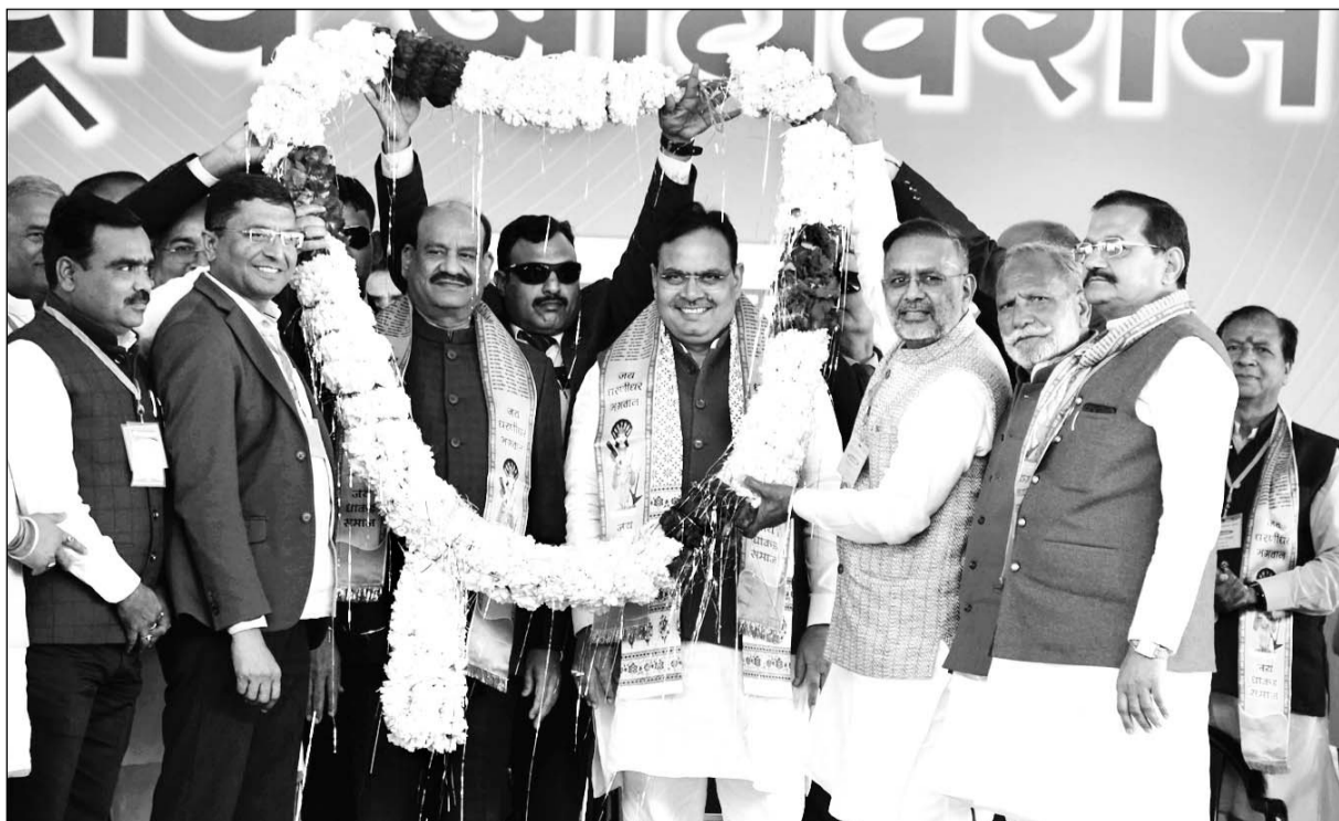
कोटा में लोकसभा अध्यक्ष ओम बिरला और मुख्यमंत्री भजनलाल शर्मा के मुख्य आतिथ्य में धाकड़ समाज का दो दिवसीय खुला अधिवेशन आयोजित हुआ। धाकड़ महासभा के राष्ट्रीय अध्यक्ष रोडमल नागर ने कार्यक्रम की अध्यक्षता की।

इस अवसर पर लोकसभा स्पीकर ओम बिरला ने कहा कि भारत को आगे