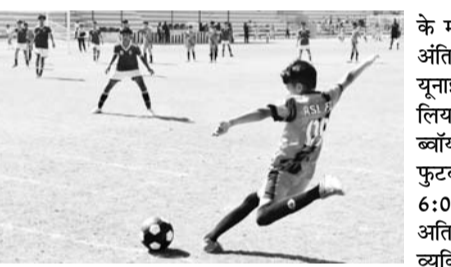
में राजस्थान फुटबाल स्कूल जयपुर ने जयपुर फुटसाल फुटबाल क्लब को 3:1 से पराजित किया। चौथे मैच में ब्रदर्स यूनाइटेड फुटबॉल क्लब और एस ल फुटबाल क्लब

जयपुर, 9 फरवरी। राजस्थान फुटबॉल संघ के तत्वाधान में एस एस जैन सुबोध शिक्षा समिति के प्रांगण में जारी आर लीग यूथ अंडर-13 फुटबॉल प्रतियोगिता में पांच मैच खेले गए। जयपुर एलिट फुटबाल क्लब जयपुर और जयपुर यूनाइटेड फुटबाल क्लब के बीच खेला गया जिसमें जयपुर एलिट क्लब ने मैच 6:0 से जीत लिया। दूसरा मैच चैंपियन मेकर्स और रॉयल फुटबाल स्कूल के बीच खेला गया दोनों टीमों ने शानदार प्रदर्शन किया व निर्धारित समय तक 7-1 से मैच चैंपियन मेकर्स अजमेर ने जीत हासिल की। तीसरे मैच