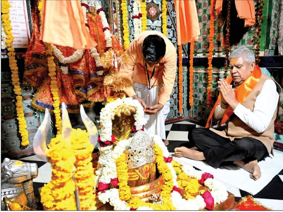
उपराष्ट्रपति डॉ. जगदीप धनखड़ ने चित्तौड़गढ़ में अखिल मेवाड़ क्षेत्र जाट समाज महासभा संस्थान के मातृकुंडिया धाम में महादेव के नवीन मंदिर प्रतिष्ठा महोत्सव में भाग लिया और पूजा-अर्चना की।

जयपुर, 9 फरवरी। उपराष्ट्रपति डॉ. जगदीप धनखड़ ने चित्तौड़गढ़ में अखिल मेवाड़ क्षेत्र जाट समाज महासभा संस्थान के मातृकुंडिया धाम में महादेव के नवीन मंदिर प्रतिष्ठा महोत्सव में भाग लिया और आयोजित जनसभा को भी संबोधित किया। उपराष्ट्रपति ने कहा कि किसान अन्रदाता हैं और ग्रामीण अर्थव्यवस्था