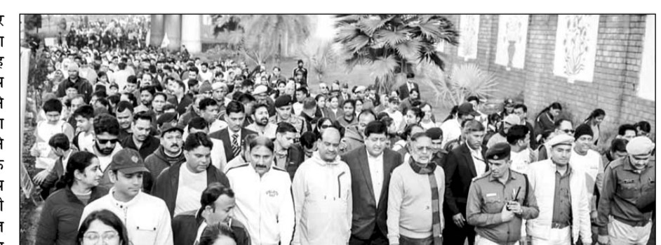
"वॉक-ओ-रन 2025" में लोकसभा अध्यक्ष ओम बिरला सहित अधिकारी व आमजन शामिल हुए।