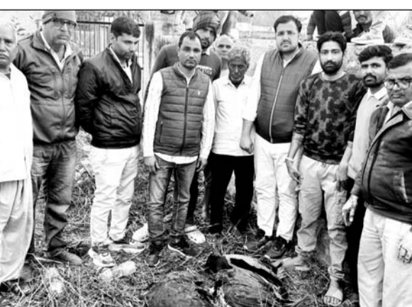
मृत मोर मिलने पर लोगों ने आक्रोश जताया।