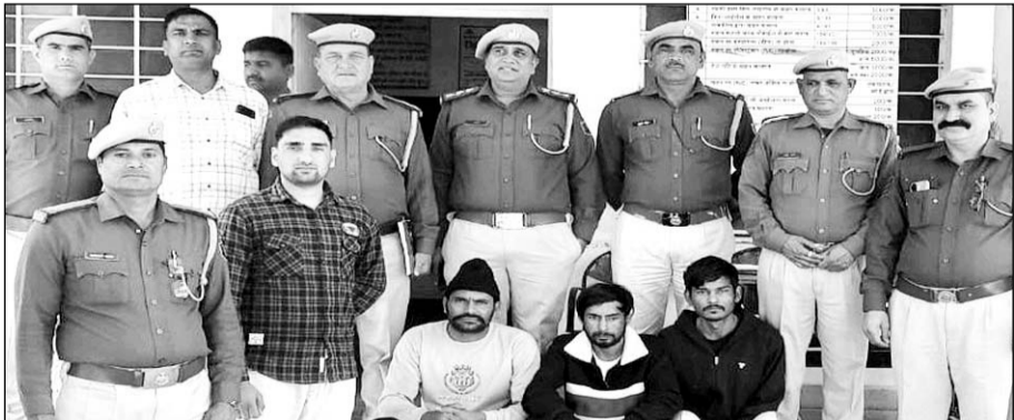
झालावाड़ जिले में कोतवाली थाना पुलिस ने आरोपियों को गिरफ्तार किया।