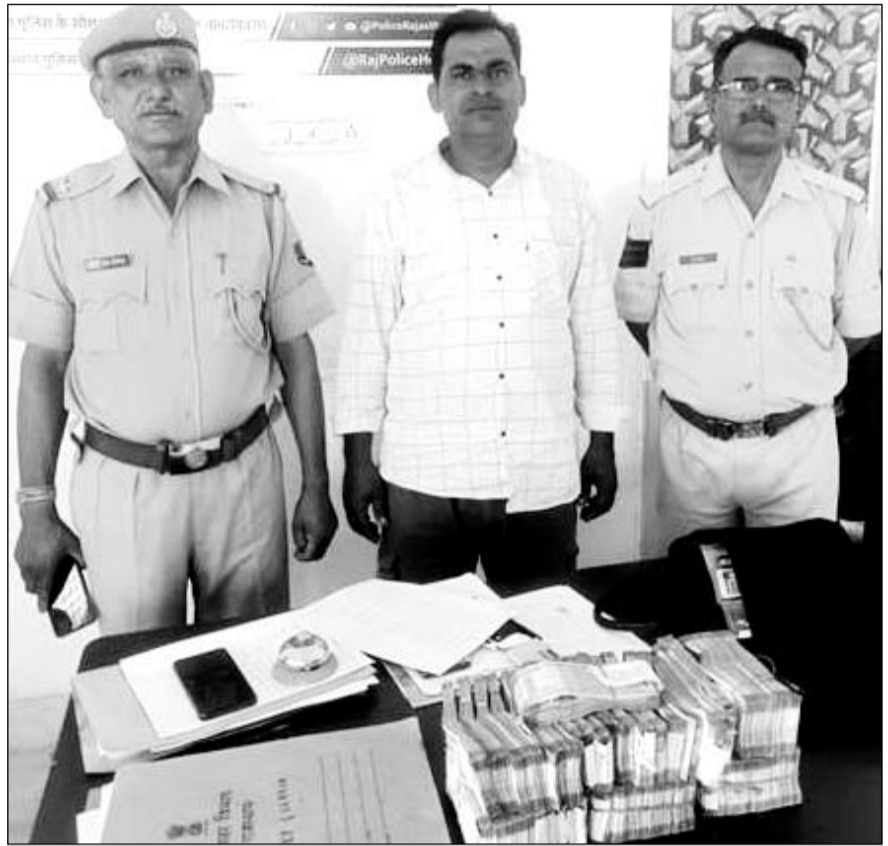
पोकरण पुलिस ने 25 लाख नकदी सहित युवक को पकड़ा।

संदिग्ध व्यक्ति को आयकर विभाग की टीम को सुर्पुद किया