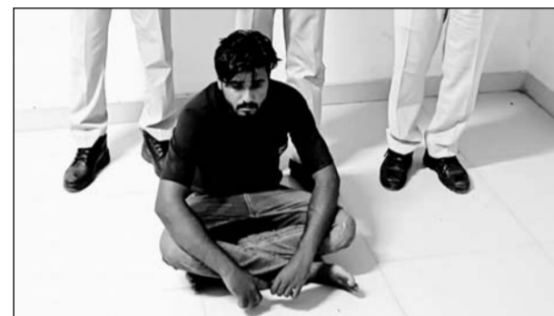
नकली नोटों के साथ आरोपी को गिरफ्तार किया।