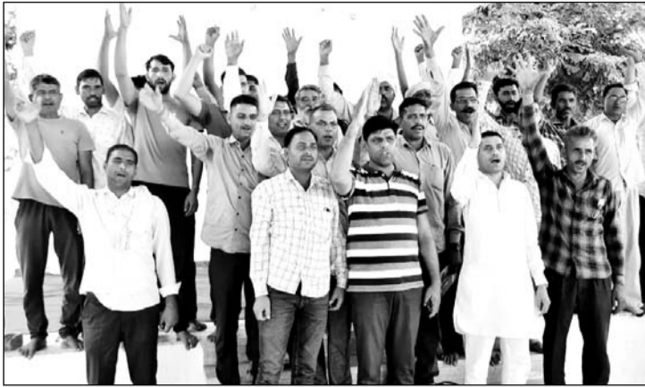
धरना समाप्त होने पर किसानों ने मिठाई बांटकर खुशी मनाई व विजय जुलूस निकाला।

(निर्स)। गोठड़ा में श्री सीमेंट संघर्ष समिति की ओर से 9 महीने चला किसानों का धरना समाप्त हो गया। उपखंड प्रशासन की मध्यस्थता में शुक्रवार को गोठड़ा में श्री सीमेंट कंपनी कार्यालय में किसानों व श्री सीमेंट कंपनी प्रबंधन के बीच हुई वार्ता में लिखित समझौता हुआ। समझौते पर शुक्रवार देर शाम सहमति बन गई थी। लेकिन धरने पर बैठे कुछ किसानों के सहमति पत्र पर शुक्रवार को हस्ताक्षर नहीं हो सके। इसके बाद शनिवार को सभी किसानों के हस्ताक्षर होने के बाद विधिवत धरना समाप्त होने की घोषणा हुई।