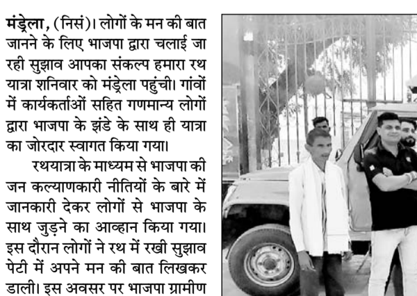
भाजपा की ओर से चलाई जा रही रथ यात्रा मंडेला पहुंची।