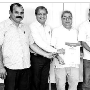
झुंझुनू एकेडमी सीबीएसई स्कूल को होटल जेडब्ल्यू मैरियट नई दिल्ली एयरोसिटी में अवॉर्ड से सम्मानित किया गया।

झुंझुनू, (निर्स)। संपूर्ण राजस्थान में अपने अभूतपूर्व परीक्षा परिणाम, असाधारण स्टूडेंट्स फैसलिटीज एवं एक्सक्यूल्सिव सह-शैक्षणिक गतिविधियों के लिए विख्यात झुंझुनू एकेडमी सीबीएसई स्कूल को होटल जेडब्ल्यू मैरियट नई दिल्ली एयरोसिटी में एजुकेशन वर्ल्ड इंडिया स्कूल रैंकिंग 2023-24 अवॉर्ड से सम्मानित किया गया है।