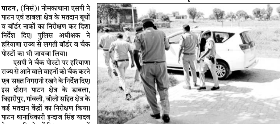
बॉर्डर का निरीक्षण करते नीमकाथाना पुलिस अधीक्षक।