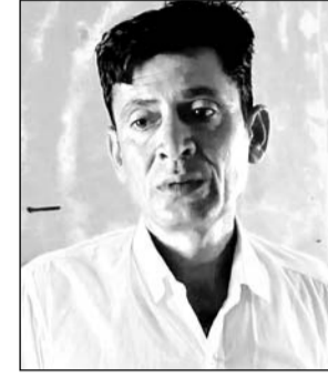
आरोपी भू-अभिलेख निरीक्षक।

जोधपुर-ग्रामीण एसीबी टीम ने आवास एवं अन्य ठिकानों पर तलाशी ली