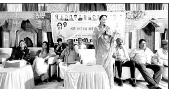
किसान सम्मान निधि समारोह लाभार्थी सम्मेलन को सांसद दिया कुमारी ने संबोधित किया।

भीम/राजसमंद, (निर्सं)। भारतीय जनता पार्टी द्वारा चलाए जा रहे विशेष जनसंपर्क अभियान के तहत किसान सम्मान निधि समारोह लाभार्थी सम्मेलन भीम विधानसभा क्षेत्र में बुधवार को आयोजित हुआ।