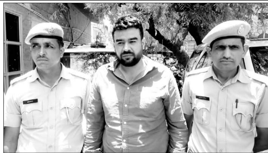
पुलिस ने कांस्टेबलों की हत्या के मामले में आरोपी को गिरफ्तार किया।