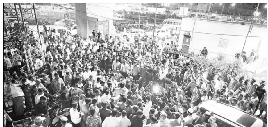
राजधानी के माणक चौक इलाके के जौहरी बाजार में एक रैली के दौरान समुदाय विशेष के खिलाफ आपत्तिजनक नारे लगाने और हथियार लहराने का वीडियो सोशल मीडिया पर वायरल होने के बाद आरोपियों पर कार्रवाई की मांग के लेकर बुधवार को थाने पर प्रदर्शन किया गया।

जयपुर (का.सं.)। राजधानी के माणक चौक इलाके के जौहरी बाजार में एक रैली के दौरान समुदाय विशेष के खिलाफ आपत्तिजनक नारे लगाने और हथियार लहराने का वीडियो सोशल मीडिया पर वायरल होने के बाद आरोपियों पर कार्रवाई की मांग के लेकर बुधवार को थाने पर प्रदर्शन किया गया। दौरान आरोपियों के खिलाफ एफआईआर दर्ज कराई गई।