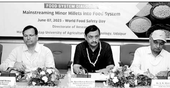
विश्व खाद्य सुरक्षा दिवस पर कृषि विवि तथा वाग्धारा संस्थान और भूमि-का के संयुक्त तत्वाधान में संवाद का आयोजन किया गया।

उदयपुर, (कासं)। विश्व खाद्य सुरक्षा दिवस पर कृषि विश्वविद्यालय तथा वाग्धारा संस्था और भूमि-का के संयुक्त तत्वाधान में रायच में छोटे अनाज को बढ़ावा देने तथा छोटे अनाज को सामान्य जन की भोजन थाली का हिस्सा बनाने के उद्देश्य से संवाद का आयोजन किया गया। संवाद में देशभर से 8 राज्यों के विषय विशेषज्ञों ने भाग लिया।