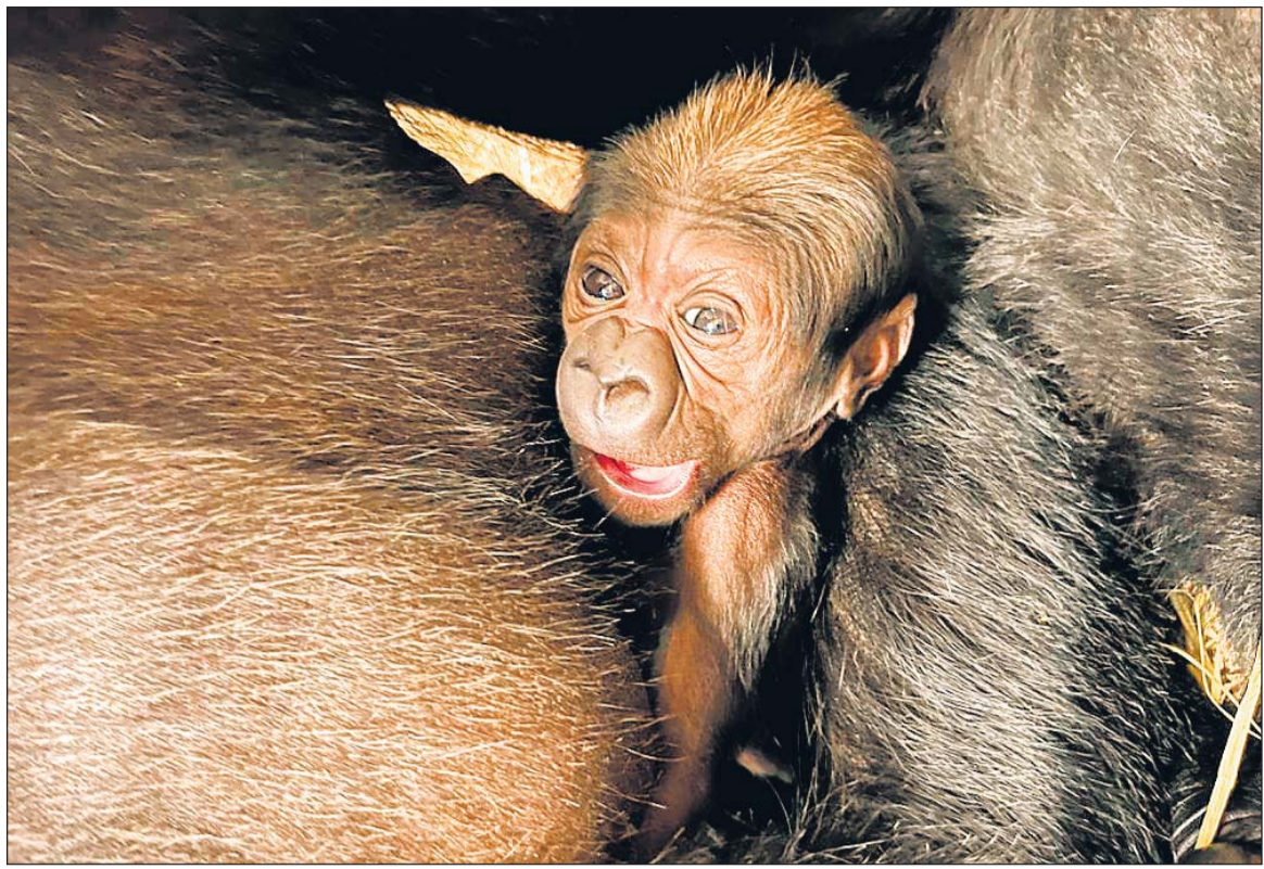
स्मिथसोनियन स नैशनल जू एण्ड कन्जर्वेशन बायॉलजी इन्स्टीट्यूट में, पाँच वर्षों में पहली बार अत्यंत संकटग्रस्त वैस्टर्न लोलैण्ड गोरिल्ला प्रजाति के बच्चे का जन्म हुआ है। अभी पता नहीं है कि बच्चा नर है या मादा। यह बच्चा 20 वर्षीय मादा कालाया और 31 वर्षीय नर बाराका की दूसरी संतान है। जू में नर-वानरों (प्राइमेट्स) की क्यूरेटर बैकी मालिस्की ने जू से जारी किये गये एक बयान में कहा, "हमें अपने वैस्टर्न लोलैण्ड गोरिला समूह में एक नये शिशु का स्वागत करते हुये अपार हर्ष हो रहा है। कालाया एक अनुभवी माँ है और मुझे पूरा विश्वास है कि वह अपने शिशु का बहुत अच्छा और वैसा ही खयाल रखेगी, जैसा उसने अपनी पहली संतान मोक का रखा था। मोक का जन्म वर्ष 2018 में हुआ था और तब से ही कालाया बहुत ही अच्छे तरीके से उसका पालन-पोषण कर रही है तथा उसके साथ खूब खेलती-कूदती है।" एसोसिएशन ऑफ जू एण्ड अक्वैरियम्स के स्पेशल सर्वाइवल प्लान के सुझाव पर कालाया और बाराका को प्रजनन के लिए चुना गया था। यह संस्था जैनेटिक मेकअप, स्वास्थ्य, स्वभाव व अन्य कारकों के आधार पर प्रजनन के लिए गोरिल्ला का चयन करती है। जू के अनुसार कालाया बहुत "प्रोटेक्टिव" व सतर्क स्वभाव की है, वहीं बाराका मस्त मौला किस्म का है, वह अपनी 5 वर्षीय संतान की शरारतों के प्रति बेहद सहिष्णु है। कालाया, बाराका व उनके दो बच्चों के साथ, स्मिथसोनियन के लोलैण्ड गोरिल्ला समूह में एक 41 वर्षीय मादा मंदारा व उसकी 14 साल की बेटा किबीबी भी शामिल है। जंगल में तो, नर हो या मादा, 8 साल के होने पर गोरिल्ला उस मूल समूह को छोड़ देते हैं, जिसमें उनका जन्म हुआ। नर को तो कभी-कभी जबरन निकाल दिया जाता है। समूह से निकाले गए नर प्रायः एक बैचलर युप बना लेते हैं और अपना स्वयं का समूह बनाने योग्य होने तक युप में सभी नर साथ रहते हैं।