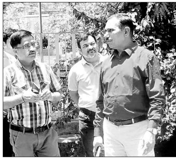
जिला कलेक्टर ने सूचना केन्द्र के जीर्णोद्धार व विकास कार्यों का अवलोकन किया।

उदयपुर, (कासं)। सूचना केन्द्र में आने वाले पाठकों और प्रबुद्धजनों को बेहतर सुविधाएं उपलब्ध कराने की मंशा से यूआईटी व भामाशाहों के सहयोग से हो रहे सूचना केन्द्र के जीर्णोद्धार व विकास कार्यों का जायजा लेने के लिए जिला कलक्टर ताराचंद मीणा ने सूचना केन्द्र का निरीक्षण किया। इस दौरान कलेक्टर मीणा ने सूचना केन्द्र परिसर में नगर विकास प्रन्यास की ओर से जारी रंगमंच जीर्णोद्धार और अन्य प्रागतिरत कार्यों का जायजा लिया। प्रन्यास के अधिकारियों को वहीं फोन कर जारी कार्य को गति प्रदान करते हुए वर्षाकाल से पूर्व कार्य पूर्ण करने के निर्देश दिए। इस दौरान कलक्टर ने हाल ही में चौकसी ग्रुप द्वारा रिनोवेटेड वाचनालय का भी निरीक्षण किया। कलक्टर ने सूचना केन्द्र की लाईब्रेरी को स्मार्ट लाईब्रेरी के रूप में विकसित करने के लिए अपनी प्रतिबद्धता जताई और कहा कि जल्द ही शहर को यह सीगात भी मिलेगी। इसके साथ ही यहां एसी सुविधायुक्त सभागार में भी शीघ्र कुर्सियां व साउण्ड सिस्टम की व्यवस्था की जाएगी। इस दौरान कलक्टर ने सूचना केन्द्र से प्रस्थान से पूर्व मोहता पार्क में नगर निगम द्वारा तैयार किए जा