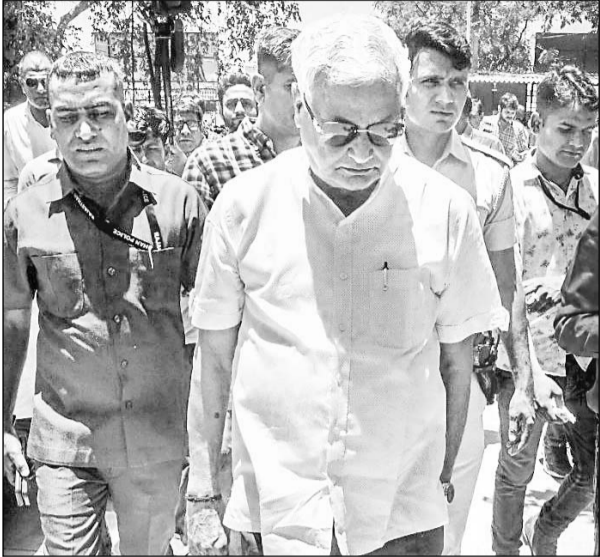
राज्यसभा सांसद डॉ. किरोड़ीलाल मीणा बुधवार को ईडी दफ्तर पहुंचे।

जयपुर। राजस्थान से राज्यसभा सांसद डॉ. किरोड़ीलाल मीणा ने बुधवार को ईडी दफ्तर पहुंचकर राजस्थान में 5000 करोड़ रुपये के नए घोटाले के सबूत पेश करने का दावा किया है। उन्होंने हाल ही डीओआईटी के ऑफिस की अलमारी से मिली करोड़ों रुपये की नकदी को लेकर सबूत भी सौंपे। सूचना एवं प्रौद्योगिकी विभाग के दफ्तर में सवा 2.31 करोड़ की नकदी उठाने की ईडी मिलने के बाद गहलोत सरकार प्रशासन के आरोपों से घिर गई है। भाजपा ने सरकार पर हजारों करोड़ रुपये के भ्रष्टाचार के आरोप लगाए हैं। राज्यसभा सांसद डॉ. किरोड़ीलाल मीणा ने राज्य सरकार के आईटी डिपार्टमेंट में 5000 करोड़ रुपये के गबन का आरोप लगाया है। बुधवार को डॉ. मीणा जयपुर स्थित प्रवर्तन निदेशालय (ईडी) के दफ्तर पहुंचे। करीब 20 से 25 मिनट तक ईडी के जॉइंट डायरेक्टर के साथ चर्चा की। बाद में मीडिया से बात करते हुए डॉ. मीणा ने दावा किया कि उन्होंने डिपार्टमेंट ऑफ इंफोर्मेशन एंड टेक्नोलॉजी (डीओआईटी) में हुए 5