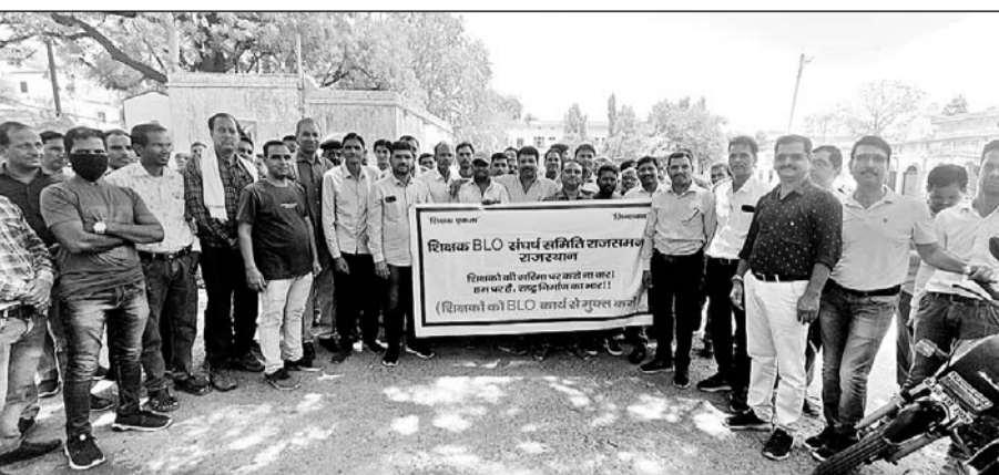
राजसमंद में शिक्षकों ने बीएलओ प्रशिक्षण का बहिष्कार कर विरोध प्रदर्शन किया।

राजसमंद, (निर्सं)। शिक्षक बीएलओ संघर्ष समिति के आह्वान पर किये जा रहे गैर शैक्षणिक कार्यों के विरोध में जिले के विभिन्न शिक्षक संगठनों के सानिध्य में बीएलओ प्रशिक्षण एवं बीएलओ कार्य का बहिष्कार दूसरे दिन बुधवार को भी जारी रहा।