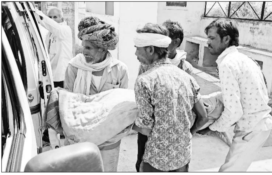
विवाहिता के शव को कब्जे में लेकर मेडिकल बोर्ड से पोस्टमार्टम कराया और परिजनों को सुपुर्द किया।

मृतका के परिजन उसे मांडलगढ़ अस्पताल लेकर आए। जहाँ उसकी मौत हो गई। परिजन शव को अस्पताल से घर लेकर चले गए। सूचना पर मृतक के पीहर पक्ष के लोग भाँड़ का खेड़ा आए और पुलिस को सूचना दी।