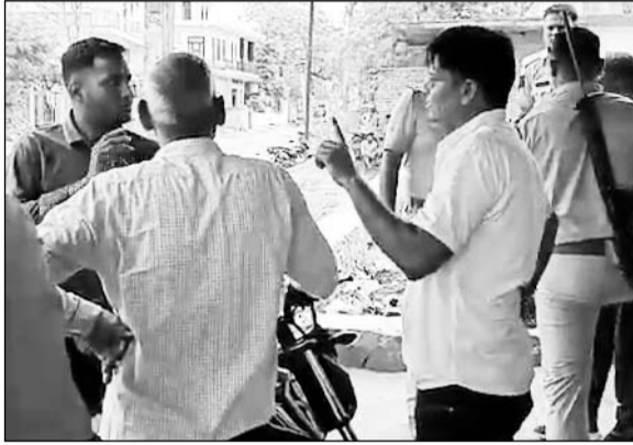
भुसावर पुलिस ने सीआईडी टीम को ग्रामीणों के चंगुल से छुड़वाया।

भुसावर, (निर्स)। भरतपुर जिले के भुसावर में शनिवार को सी.आई.डी. स्पेशल ब्रांच की टीम के साथ बंधक बनाकर मारपीट की गई। संदिग्ध आरोपी को पकड़ने सादा कपड़ों में पहुंची टीम को ग्रामीणों ने घेरकर हमला किया।