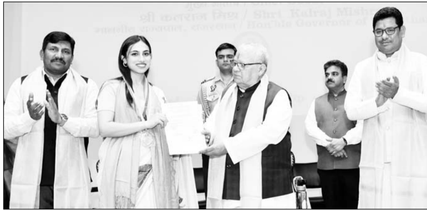
जोधपुर में राज्यपाल और कुलाधिपति कलराज मिश्र ने दीक्षांत समारोह को संबोधित किया।

जयपुर/जोधपुर, (कांस)। राज्यपाल और कुलाधिपति कलराज मिश्र ने कहा कि विद्यार्थी अर्जित शिक्षा का उपयोग राष्ट्र और समाज के उत्थान के लिए करें। उन्होंने फुटवियर डिजाइन के क्षेत्र में नवाचार अपनाते हुए इस क्षेत्र के उत्पादों के निर्यात से अर्थव्यवस्था के सुदृढ़ीकरण का आह्वान किया। राज्यपाल मिश्र ने शनिवार को जोधपुर में फुटवियर डिजाइन एंड डेवलपमेंट इंस्टीट्यूट के तृतीय दीक्षांत समारोह में संबोधित करते हुए कहा कि उद्यमिता विकास जरूरी है। नई पीढ़ी नौकरी करने की सोच की बजाय रोजगार प्रदाता बने। उन्होंने नई शिक्षा नीति के आलोक में पाठ्यक्रम अपडेट किए जाने पर भी जोर दिया।