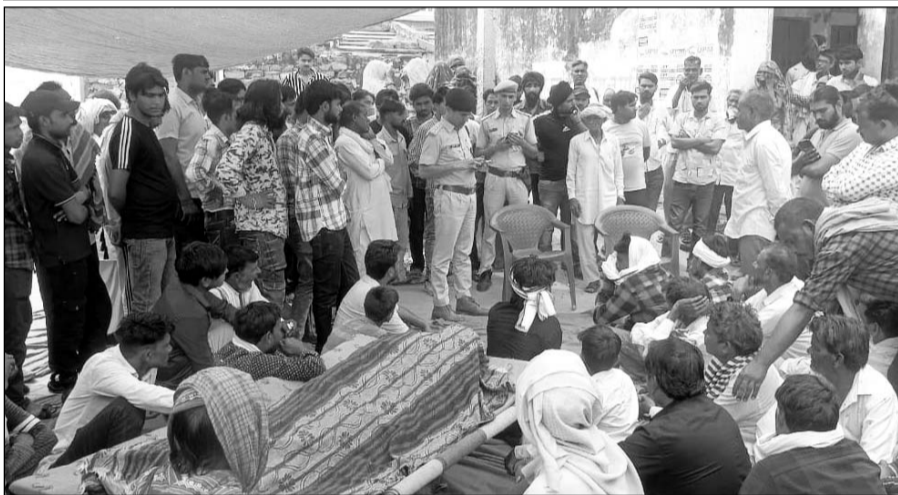
हत्या के बाद परिजन शव को लेकर धरने पर बैठ गए।

गिरफ्तारी की मांग को लेकर धरने पर बैठे ग्रामीण