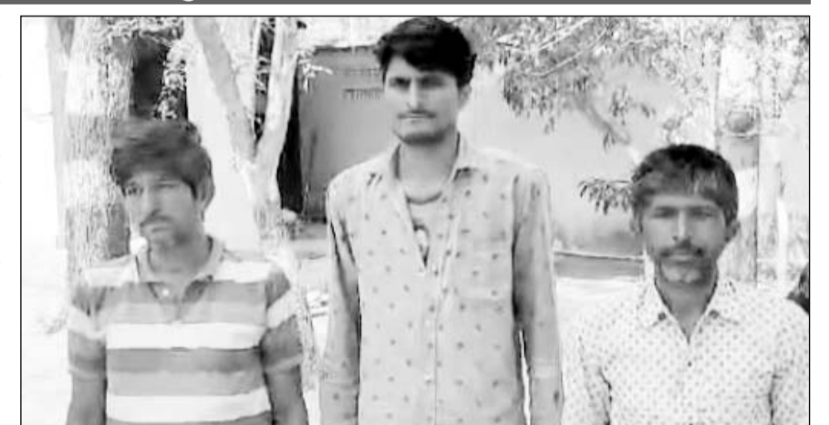
एक माह पूर्व हुई उक्त घटना में पुलिस ने 5 आरोपियों को गिरफ्तार कर न्यायालय में पेश किया।