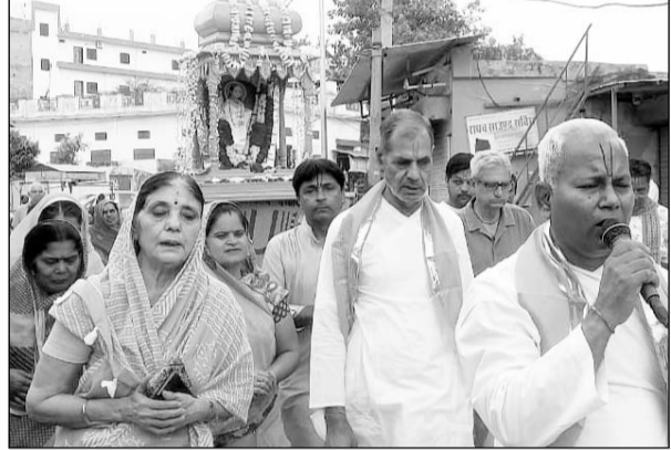
महाप्रभु की शोभा यात्रा निकालते भक्तगण।