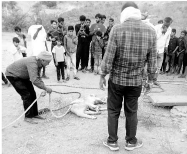
करौली के निकट सिमारा गांव में आये चीता को ट्रैकलाइज कर वापस मध्य प्रदेश भेजा।

चीता के मध्य प्रदेश स्थित कूनों सफारी पार्क से करौली पहुंचने की सूचना मिली थी वन विभाग के अधिकारियों का कहना था कि चीता को पकड़कर वापस कूनों पहुंचाया गया है। सिमारा गांव निवासी के जंगलों में बताया कि प्रातः जब कुछ ग्रामीण खेतों पर जा रहे थे तो उन्होंने एक जंगली जानवर को देखा। जंगली जानवर को देखकर वो डरकर वापस गांव