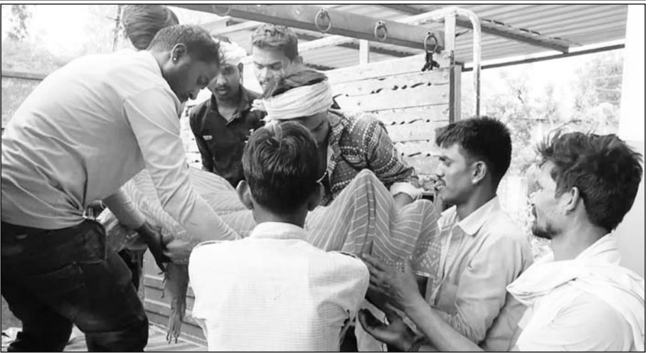
नहर में बालिकाओं की डूबने से मौत के बाद मौके पर एकत्रित भीड़ व पुलिस ने शवों को बाहर निकाला।