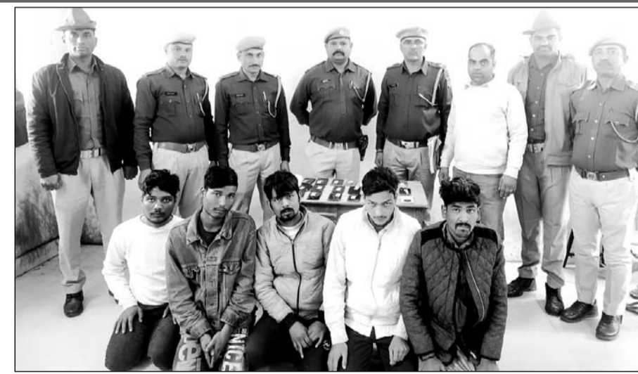
पुलिस ने मोबाइल चोरी के आरोपियों को पकड़ा।