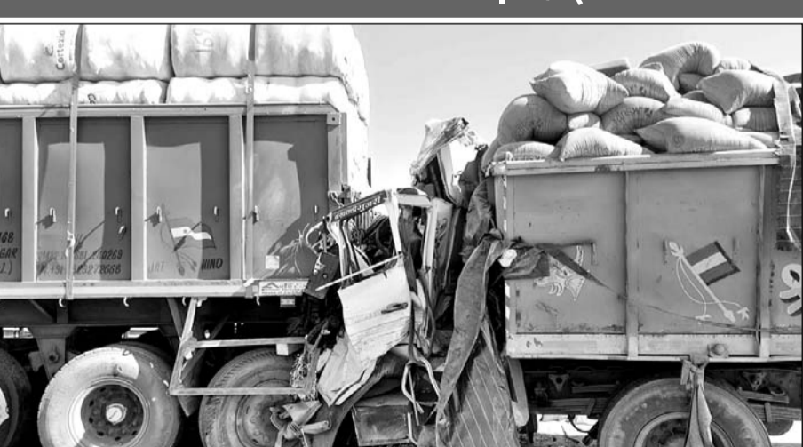
अजमेर-भीलवाड़ा हाईवे पर स्थित कोठारी नदी की पुलिया पर घने कोहरे से कई वाहन टकरा गए, इनमें एक यात्री बस भी शामिल है।

अजमेर-भीलवाड़ा हाईवे पर स्थित कोठारी नदी की पुलिया पर हादसा हुआ