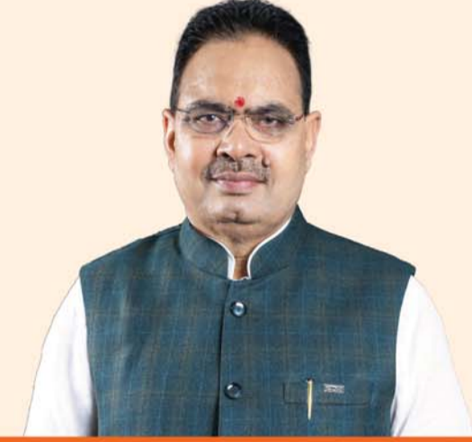
श्री भजनलाल शर्मा माननीय मुख्यमंत्री