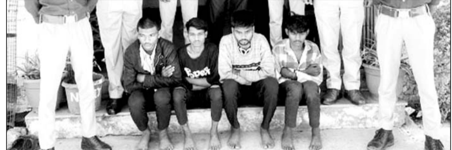
कार पर पथराव कर शीशे तोड़ने के आरोपियों को पुलिस ने गिरफ्तार किया।

डूंगरपुर, (निर्स)। कोतवाली थाना पुलिस ने चार बदमाशों को गिरफ्तार किया है। बदमाशों ने कार और ऑटो के बीच टक्कर के बाद पथराव कर दिया था, जिसमें कार के शीशे फूट गए थे। मामले में पुलिस आरोपियों से पूछताछ कर रही है।