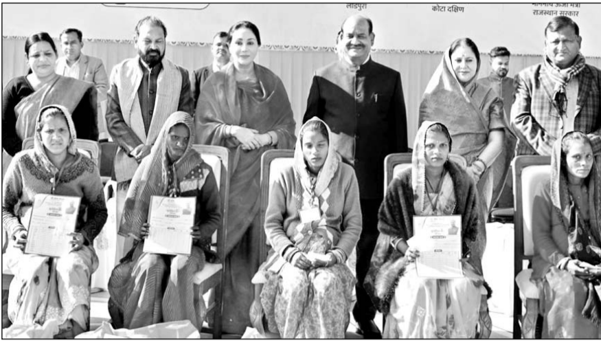
कोटा में "सुपोषित मां" अभियान के तहत लोकसभा अध्यक्ष ओम बिरला और उपमुख्यमंत्री दिया कुमारी ने गर्भवती महिलाओं को पोषण किट दिये।

कोटा, (निर्स)। कोटा-बूंदी संसदीय क्षेत्र में गरीब एवं वंचित वर्ग की गर्भवती महिलाओं के उचित पोषण एवं स्वास्थ्य सुरक्षा के उद्देश्य से संचालित "सुपोषित मां" अभियान के तीसरे चरण का शुभारम्भ शुक्रवार को यहां छपन भोग परिसर से लोकसभा अध्यक्ष ओम बिरला एवं उपमुख्यमंत्री दिया कुमारी ने किया। कार्यक्रम में गरीब एवं अभावग्रस्त परिवारों की 1500 गर्भवती महिलाओं को पोषण किट वितरित किए गए।