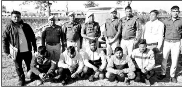
पुलिस ने हमला करने के आरोपियों को गिरफ्तार किया।