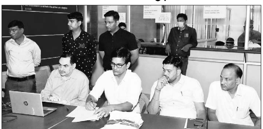
जेडीए प्रशासन ने बुधवार को अमृत कुंज योजना के आवंटियों को भूखंडों का आवंटन लॉटरी के माध्यम से किया।