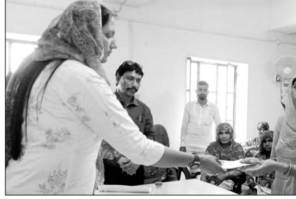
किसानों को 34 लाख 20 हजार रूपये की सहायता राशि के चैक वितरण करती सादलपुर विधायक पदमश्री डॉ. कृष्णा पूनियां।

पूर्ति के लिए मण्डियों को विकसित किया जा रहा है। वहीं इसी कड़ी में विधायक डॉ. कृष्णा पूनियां ने बताया कि तिलहन फसलों में तेल की मात्रा की जाँच के लिए 10.03 लाख की लागत