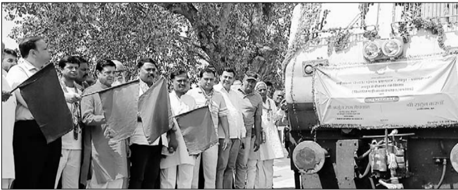
चिड़ावा पहुंचने के बाद ट्रेन के ड्राइवर, गाई व स्टाफ का माला पहनाकर और मुंह मीठा करवाकर स्वागत किया गया।