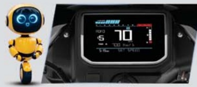
मल्टीकलर डिस्प्ले 60+ फीचर्स