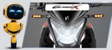
ऑल LED सेटअप