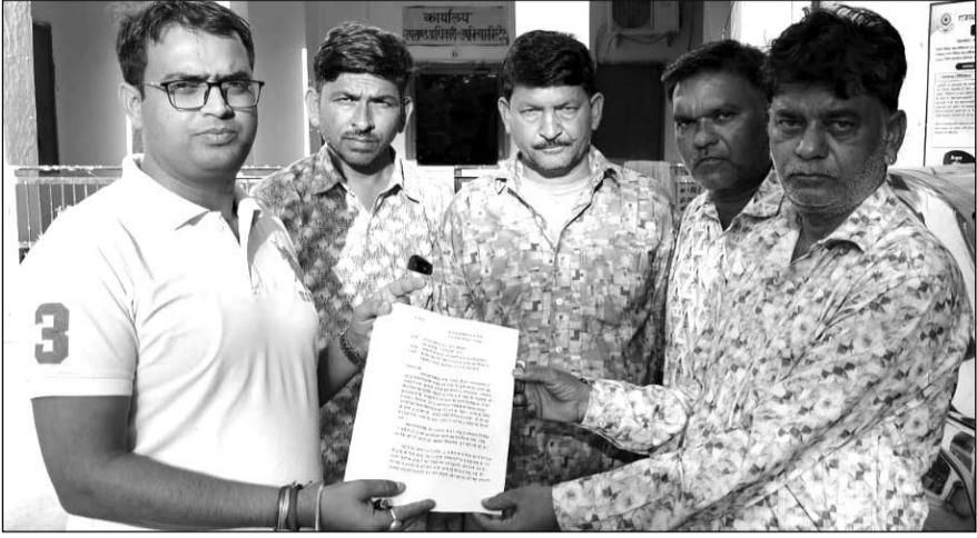
माण्डलगढ़ में समाजजनों ने एसडीएम को मुख्यमंत्री के नाम ज्ञापन दिया।