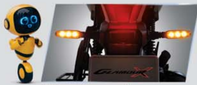
पैनिंक ब्रेक अलर्ट