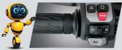
राइड बाय वायर 3 राइड मोड्स