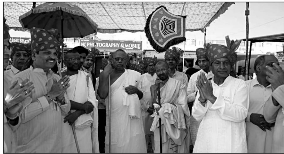
राजसमंद के श्री नाकोड़ा धाम पड़ासली में आयोजित प्रतिष्ठा महोत्सव में जैन संतों का मंगल प्रवेश हुआ।

मंगल प्रवेश के दौरान श्रद्धालुओं की बड़ी संख्या उपस्थित रही, जिन्होंने जयकारों और भक्ति भाव से संतों का अभिनंदन किया। इस अवसर पर 35 फीट ऊंची नाकोड़ाजी की भव्य प्रतिमा सभी के आकर्षण का केंद्र रही। संतों ने प्रतिमा के दर्शन कर इसे ऐतिहासिक एवं दुर्लभ स्थल बताया और इसकी भव्यता की सराहना की। उन्होंने कहा कि इस प्रकार के धार्मिक स्थल समाज में आस्था और संस्कृति के संवाहक होते हैं। कार्यक्रम समिति के संयोजक