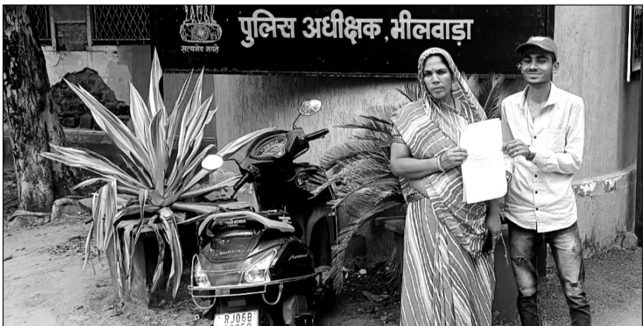
पुलिस अधीक्षक भीलवाड़ा

च्या दिलाने की मांग को लेकर पीड़िता एसपी कार्यालय पहुंची