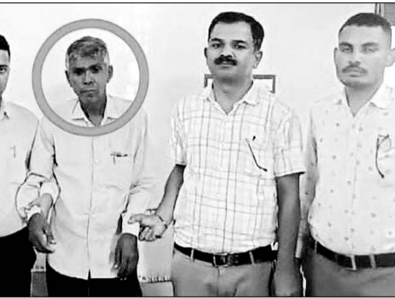
बिछीवाड़ा ब्लॉक अन्तर्गत आरा स्कूल के शिक्षाकर्मी को रिश्त मामले में गिरफ्तार किया।

साथी शिक्षाकर्मी का पेंशन प्रकरण तैयार कर भेजने की एवज में 20 हजार की रिश्त मांगी थी