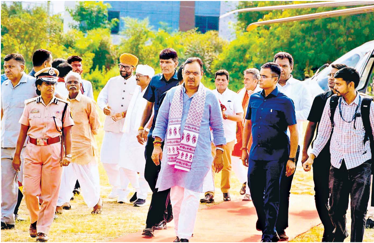
मुख्यमंत्री भजनलाल शर्मा ने बुधवार को डूंगरपुर में चौरासी व सलुम्बर उपचुनावों के संदर्भ में भाजपा कार्यकर्ताओं की बैठक की तथा जिले में विभिन्न विभागों की योजनाओं की समीक्षा की। डूंगरपुर पहुँचने पर पुलिस लाइन हेलीपैड पर उनका स्वागत किया गया व गार्ड ऑफ ऑनर दिया गया।