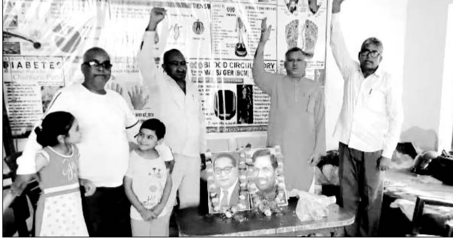
पुण्य तिथि के अवसर पर पार्टी पदाधिकारी कार्यकर्ताओं ने पुण्य अर्पित कर भावभीनी श्रद्धांजलि दी।