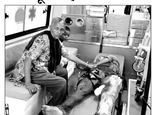
एंबुलेंस से घायल पीड़िता को जेएलएन अस्पताल पहुंचाया गया।

अजमेर, (कासं)। क्रिश्चियनगंज थाना के इंदगाह क्षेत्र में उस समय अफरा-तफरी मच गई जब शुक्रवार को एक प्रेमी ने अपनी प्रेमिका पर चाकू से हमला कर जखमी कर दिया। हमले के बाद आरोपी मौके से फरार हो गया। सूचना पर पहुंची 108 एंबुलेंस को सहायता से घायल पीड़िता को जेएलएन अस्पताल पहुंचाया। सूचना मिलते ही क्रिश्चियन गंज थाना पुलिस पहुंच गई, पुलिस मामले की जांच में जुटी है।