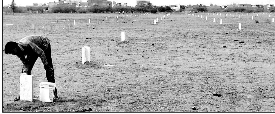
जालोर में बिना भू-रूपानान्तरण के कृषि भूमि पर प्लांटिंग की गई।

जालोर में प्रशासनिक उदासीनता के चलते जालोर शहर के आसपास कृषि भूमि पर भू-माफियाओं द्वारा नियम विरुद्ध बिना किसी प्रकार से भू-रूपानान्तरण किये कॉलोनियां काटकर भूखण्ड बेचे जा रहे हैं। जबकि राज्य सरकार के आदेशानुसार बिना भू-रूपानान्तरण किये किसी भी प्रकार से कृषि भूखण्ड पर कॉलोनियां नहीं काटी जा सकती है। वहीं कृषि भूखण्ड पर कॉलोनियां काट कर उसकी बेचाननामा