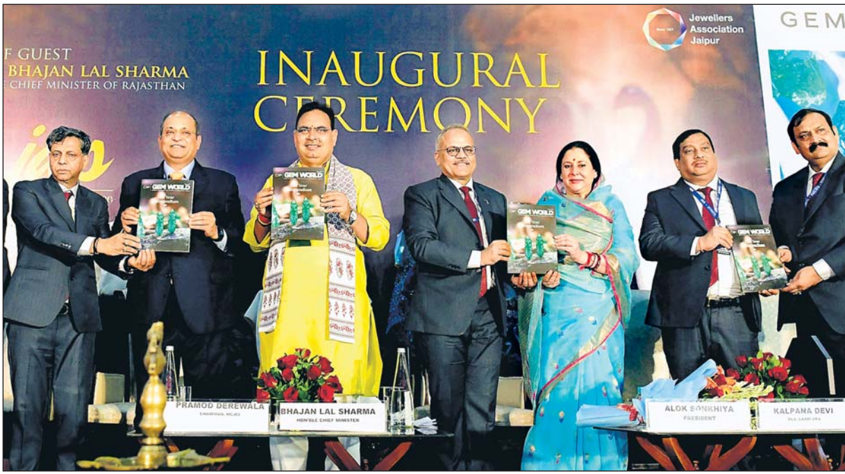
मुख्यमंत्री भजनलाल शर्मा ने शुक्रवार को सीतापुरा में जूलरी एसोसियन द्वारा आयोजित "जस-2024" का उद्घाटन किया।