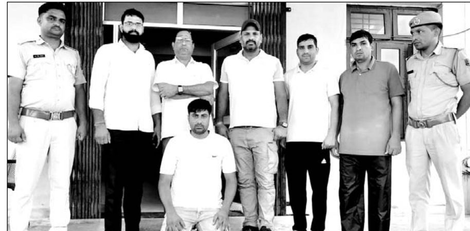
गंगापुर सिटी नगर परिषद चेयरमैन की हत्या के आरोपी को दस्तयाब किया।