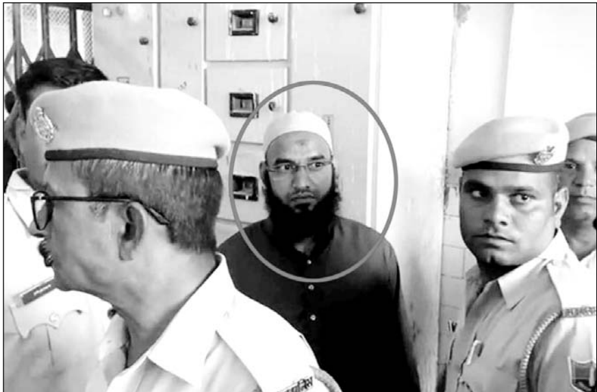
कन्हैयालाल हत्याकांड के आरोपी (गोले में) को कड़ी सुरक्षा में पुलिस जेएलएन अस्पताल लेकर गई।

जेल प्रशासन द्वारा आरोपी को भारी सुरक्षा बंदोबस्त के बीच हथियारबंद जवानों के साथ पुलिस जेएलएन अस्पताल की मुख्य ओपीडी लेकर आई, जहां