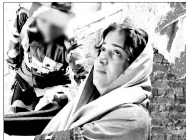
बीएसएफ ने भारत-पाक बॉर्डर पर घुसपैठ कर रही महिला को पकड़ा।

श्रीगंगानगर, (निर्सं)। जिले के अनुपगढ़ में बीएसएफ ने घुसपैठ कर रही पाकिस्तानी महिला को पकड़ा है। महिला सोमवार सुबह करीब 6:55 बजे भारत-पाकिस्तान बॉर्डर की तारबंदी पार कर भारतीय क्षेत्र में घुस गई थी। विजेता पोस्ट पर बीएसएफ के जवानों ने उसे तुरंत हिरासत में ले लिया। महिला ने पाकिस्तान वापस जाने से साफ इनकार कर दिया है। बीएसएफ के अधिकारी उससे पूछताछ कर रहे हैं। हालांकि अभी तक उसे पुलिस के हवाले नहीं किया गया है। महिला ने भारत में शरण मांगी है। महिला का कहना है कि अगर वह पाकिस्तान लौटती है तो उसे मार दिया जाएगा। वह डोमैस्टिक वॉयलेंस के कारण परेशान थी, इसलिए बॉर्डर क्रॉस करके आ गई।