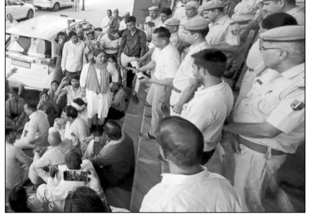
अलवर में अग्रसेन पुलिस के पास गोवंश के अवशेष मिलने के मामले में तूल पकड़ा।

■ विहिप का कहना है कि वह प्रशासन की जांच और कार्रवाई से संतुष्ट नहीं है