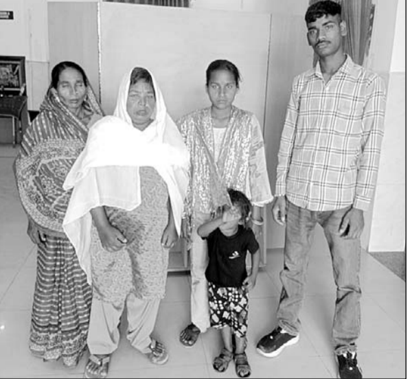
अपना घर आश्रम, भरतपुर में एक मां का अपनी बेटी और दामाद से करीब 12 वर्षों बाद मिलन हुआ।