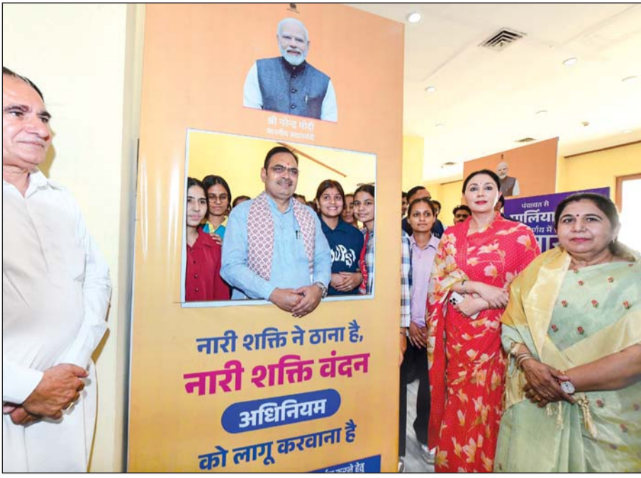
मुख्यमंत्री भजनलाल शर्मा ने बुधवार को बिड़ला ऑडिटोरियम में आयोजित नारी शक्ति वंदन सम्मेलन को संबोधित किया। इस अवसर पर मुख्यमंत्री के साथ छात्राओं ने सेल्फी व्हाइट पर सेल्फी ली।

■ मुख्यमंत्री भजनलाल शर्मा ने कहा कि नारी शक्ति वंदन अधिनियम से महिलाओं को शिक्षा, सुरक्षा, नीति निर्माण जैसे महत्वपूर्ण विषयों में सीधी भागीदारी मिलेगी।