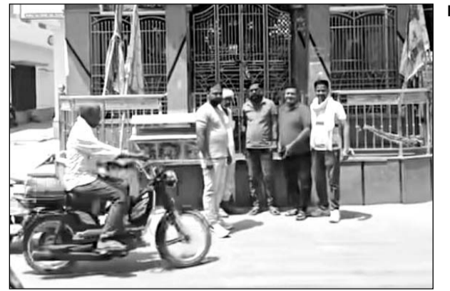
तेजाजी के मंदिर मे रखे दान पात्र को चोर ले गये।

बिजयनगर, (निसं)। तेजा चौक स्थित तेजाजी की थाने के बाहर रखे दान पात्र को निशाना बनाते हुए दान पात्र में रखी नगदी को चुरा कर ले गए। शहर में बढ़ रही चोरी की वारदातों के क्रम में विगत दिनों सब्जी मंडी स्थित बालाजी मंदिर सहित विभिन्न मंदिरों में अज्ञात चोरों ने चोरी की वारदात को अंजाम दिया। शहर के धार्मिक स्थलों को चोरों के द्वारा निशाना बनाया जा रहा है नागरिकों में भय का माहौल है। शहर में अपराध