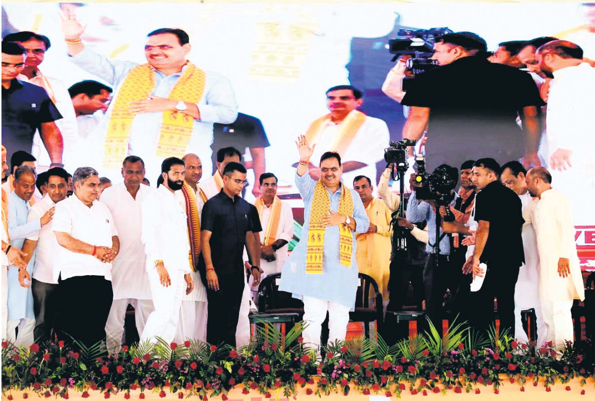
मुख्यमंत्री भजनलाल ने चित्तौड़गढ़ के नरबदिया में अनगढ़ बावजी परिसर में वृक्षारोपण कार्यक्रम के दौरान उपस्थित जन समुदाय का अभिवादन किया। मुख्यमंत्री ने जनता को संबोधित करते हुए कहा कि हरियाली राजस्थान के तहत 5 साल में 50 करोड़ पेड़ लगाए जाएंगे।