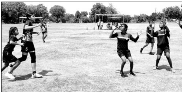
प्रतियोगिता में जोश और दमखम के साथ प्रदर्शन करते खिलाड़ी।

डूंगरपुर, (निर्सं)। राउत्रावि नंबर 14 शिवाजी नगर की मेजबानी में यहां आयोज्य प्रारंभिक शिक्षा विभाग के 14 वर्षीय छात्र-छात्राओं की 68 वीं राज्य स्तरीय हैंडबॉल प्रतियोगिता के तीसरे दिन खिलाड़ियों ने पूरे जोश और दमखम के साथ प्रदर्शन किया। वहीं दर्शकों ने भी भरपूर आनंद लिया।