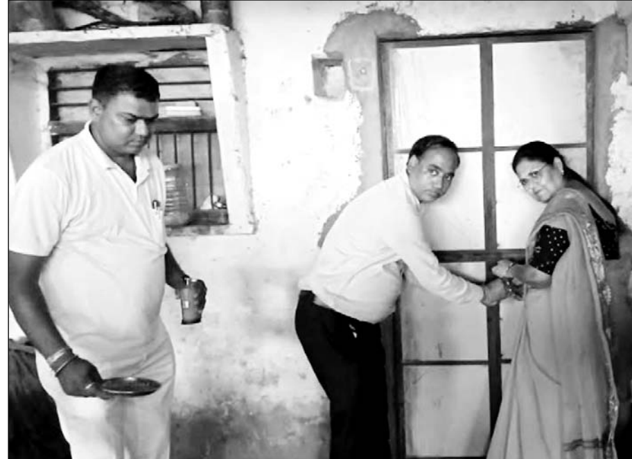
नसीराबाद उपखंड के गांव देराढ़ में खाद्य सुरक्षा विभाग की टीम ने गुड़ के कारखाने को सीज किया।

खाद्य सुरक्षा विभाग की टीम ने 4 हजार किलो सड़ा-गला गुड़ मौके पर ही नष्ट कराया