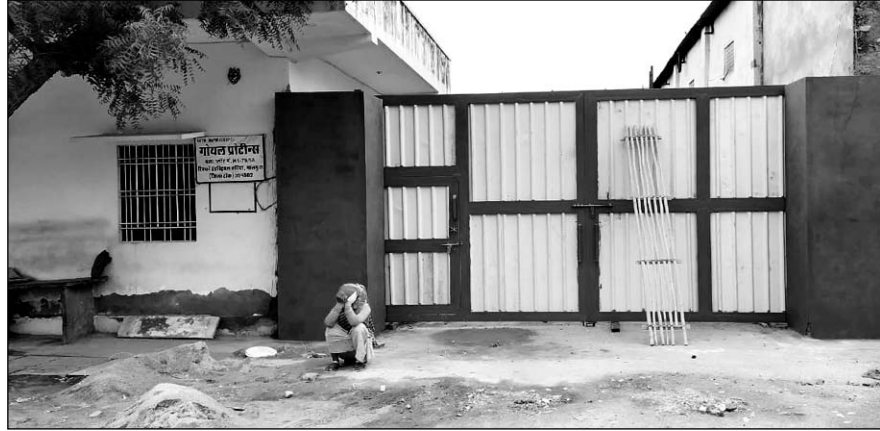
व्यापारियों ने रीको एरिया में तेल मिल व अन्य कारखानों के ताले लगा दिये।

मिली जानकारी के अनुसार मालपुरा शहर व रीको सहित कृषि मंडों में काम करने वाले व्यापारी वाणिज्य कर विभाग की आंखों में धूल झांक करोड़ों रूपयों की जीएसटी की चोरी करते हुये बिना बिल के महज पर्ची पर ही व्यापार कर करोड़ों की मोटी चांदी कूट रहे हैं। मामले की जानकारी मिलने पर कर विभाग जयपुर की दो टीमों ने मालपुरा में दो स्थानों पर सर्च की कार्यवाही शुरू की।