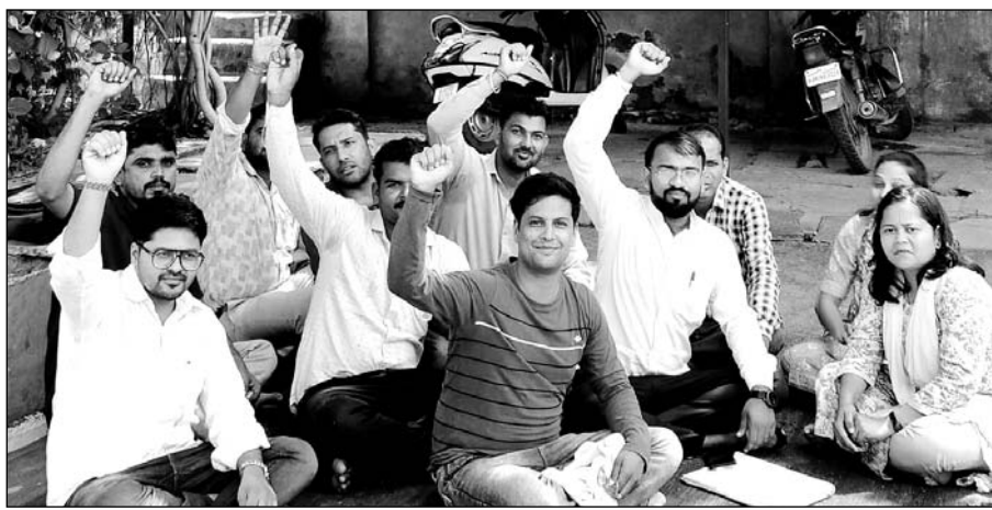
पटवार संघ की ओर से मांग पत्र पर सहमति लागू करवाने और गिरदावरी ऐप में संशोधन की मांग को लेकर कलम डाउन हड़ताल तहसील परिसर में जारी रही।

भीण्डर, (निर्सं)। जैन समाज के पर्युषण पर्व समाप्ति के अवसर पर गुरुवार को दिगम्बर जैन समाज व नागदा समाज की अलग-अलग शोभायात्रा धूमधाम से निकाली गई। दशा नरसिंह पुरा दिगम्बर जैन समाज द्वारा आदिनाथ मन्दिर एवं नागदा समाज की शांतिनाथ मन्दिर से शोभायात्रा रवाना हुई।