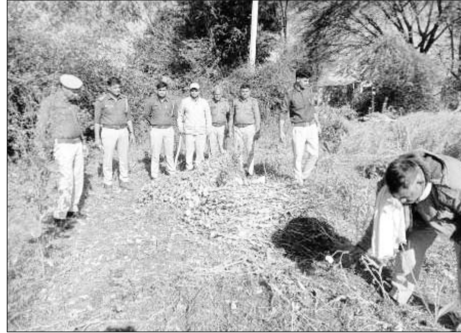
जिला मुख्यालय के समीप पदेवा गांव में पुलिस ने अवैध रूप से की जा रही अफीम की खेती पकड़ी।

पुलिस को पदेवा गांव के खेतों में अफीम की अवैध खेती होने की सूचना मिली थी