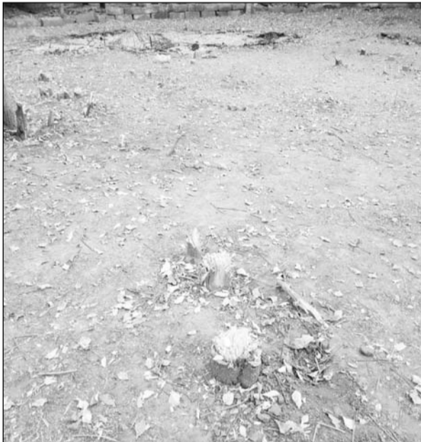
देवली में मनरेगा कार्य की आड़ में हरे पेड़ों की कटाई हो रही है।

देवली, (निसं)। इन दिनों पालिका ने बिना कारण हरे वृक्षों को काटे जाने की हठधर्मिता अपनाई हुई है। यहां आएदिन हरे वृक्ष पालिका की मनमानी व बद नियत के शिकार हो रहे हैं। ऐसा ही एक मामला फिर से सोमवार को सामने आया कि शहर के पेट्रोल पंप चौराहे स्थित सार्वजनिक निर्माण विभाग के विश्राम गृह परिसर में फल फूल रहे अनगिनत वृक्षों में से लगभग 5 दर्जन हरे वृक्षों की कटाई पालिका के नरेगा कर्मियों ने कर डाली।