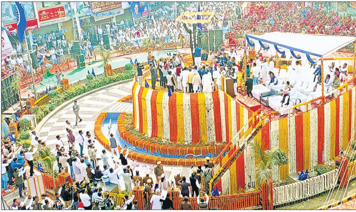
पूर्व उपमुख्यमंत्री सचिन पायलट ने श्रीगंगानगर में बाबा साहेब भीमराव अम्बेडकर की 11 फीट ऊंची प्रतिमा का अनावरण किया। इस मौके पर पायलट ने कहा, संविधान सभा के प्रमुख अम्बेडकर ने देश के दलित तबकों को जो आरक्षण दिलाया वह असल में कोई गरीबी उन्मूलन कार्यक्रम नहीं है। इसका एकमात्र उद्देश्य देश और समाज के गरीब तबकों और हर व्यक्ति को समानता के पायदान पर लाना है।