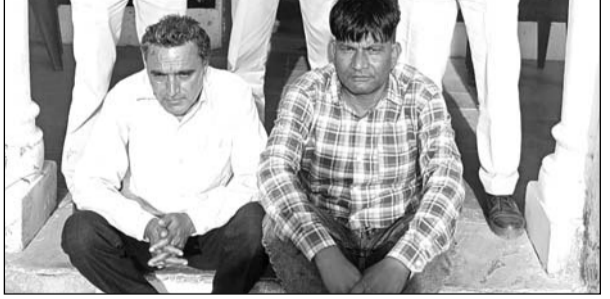
खेतड़ी पुलिस ने जुआ खेलते दो जनों को गिरफ्तार किया।