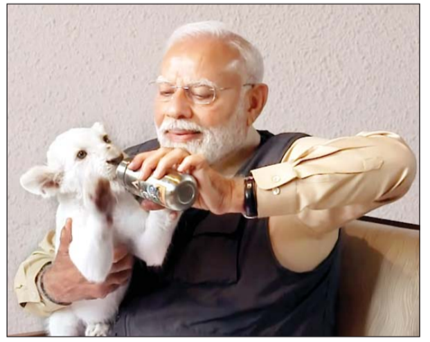
प्रधानमंत्री मोदी ने विश्व वन्यजीव दिवस "वनतारा" में जानवरों के साथ मनाया। यहां उन्होंने सफेद शेर, बाघ व गैंडा के शावकों को दूध पिलाया।

अम्बानी परिवार ने गुजरात के जामनगर में 3000 एकड़ में "वनतारा" बनवाया है जहां जानवरों की मल्टी स्पेशलिटी अस्पताल व नर्सरी है जिनमें जानवरों के नवजात बच्चों की देखरेख की जाती है।