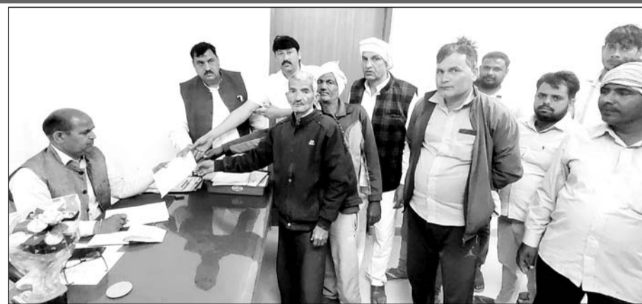
ग्रामीणों ने तहसीलदार को ज्ञापन देकर की अतिक्रमण हटाने की मांग की।

ग्रामीणों की ओर से दिए ज्ञापन में बताया कि हुकमा की ढाणी से माकड़ों जाने वाले आम रास्ते पर कुछ लोगों ने अतिक्रमण करने से आमजन का निकलना दुभर हो रहा है। पहले भी अतिक्रमण से होने वाली परेशानी को लेकर ग्रामीणों की शिकायत पर तहसीलदार द्वारा कार्रवाई कर अतिक्रमण हटवाया गया था, लेकिन अब दोबारा से आम रास्ते में इंटरलॉकिंग ईट डाल देने से वाहन नहीं निकल पा रहे हैं। इसके अलावा रास्ता बंद होने से गांव में