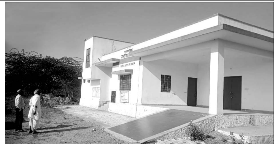
ग्राम पंचायत छाजा की नांगल में लाखों रुपये की लागत से बने पशु चिकित्सालय भवन में बीते तीन महीनों से चिकित्सक एवं पशुधन सहायक नहीं हैं।