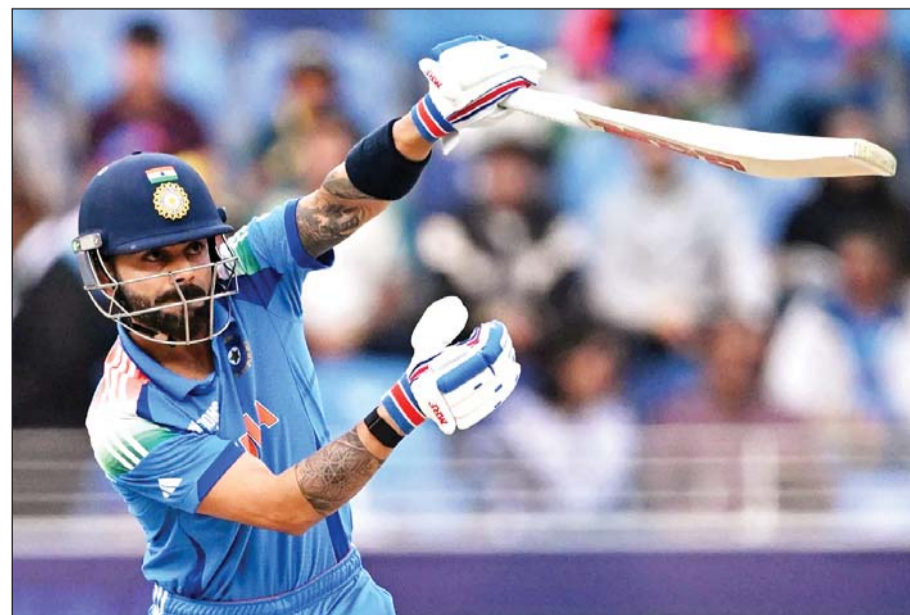
भारत को चैंपियंस ट्रॉफी का सेमीफाइनल जितकर फाइनल में पहुंचने में अहम भूमिका निभाई विराट कोहली ने। शानदार बल्लेबाजी के लिए उन्हें "प्लेयर ऑफ द मैच" का अवार्ड दिया गया।

इन याचिकाओं में स्पेशल कोर्ट के उस आदेश को रद्द करने की मांग की गई थी, जिसमें भ्रष्टाचार निरोधक ब्यूरो (एसीबी) को 1994 में बीएसई पर एक कंपनी की लिस्टिंग के दौरान हुई धोखाधड़ी के आरोपों पर उनके खिलाफ एफआईआर दर्ज करने का निर्देश दिया गया था। याचिकाओं में कहा गया कि यह आदेश "अवैध और मनमाना" था।