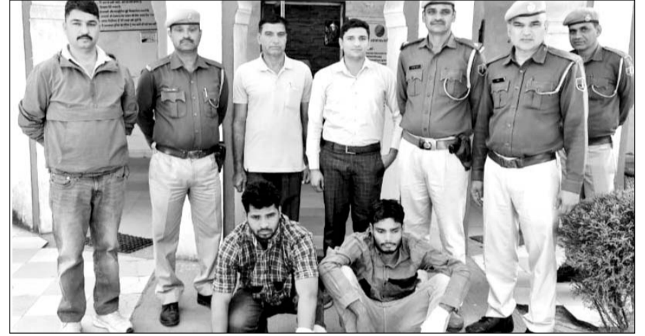
पुलिस ने दोनों आरोपियों को गिरफ्तार कर चोरी की वारदातों का खुलासा किया।