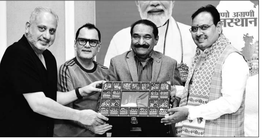
आईफा अवार्ड्स आयोजन समिति के सदस्यों ने मुख्यमंत्री भजनलाल शर्मा से मंगलवार को उनके निवास पर मुलाकात की।

जयपुर। मुख्यमंत्री भजनलाल शर्मा से मंगलवार को आईफा अवार्ड्स आयोजन समिति के सदस्यों ने मुख्यमंत्री निवास पर मुलाकात कर आईफा अवार्ड्स समारोह में शामिल होने का निमंत्रण दिया। समिति सदस्यों ने 8 एवं 9 मार्च को राजधानी जयपुर में आयोजित होने वाले समारोह सहित विभिन्न कार्यक्रमों की विस्तृत जानकारी