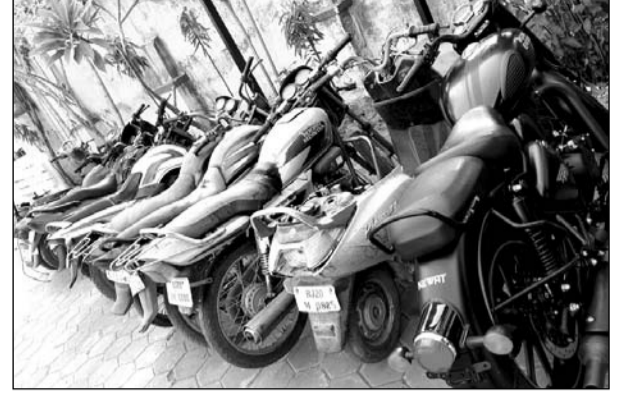
कबाड़ियों के पास कागजात नहीं मिलने पर 10 दुपहिया वाहनों को थाने पर लाकर खड़ा किया।

कोटा, (निस्)। शहर के अलग-अलग थाना इलाकों में पुलिस टीम ने शहर एस्प्री के निर्देश पर मंगलवार तड़के संदिग्ध कबाड़ियों के गोदामों पर छापा मारा कार्यवाही की। पुलिस की तड़के अचानक हुई कार्यवाही से कबाड़ियों में हड़कंप मच गया। पुलिस टीम ने कार्रवाई के दौरान कबाड़ियों के पास कागजात नहीं मिलने पर 10 दुपहिया वाहनों को थाने पर