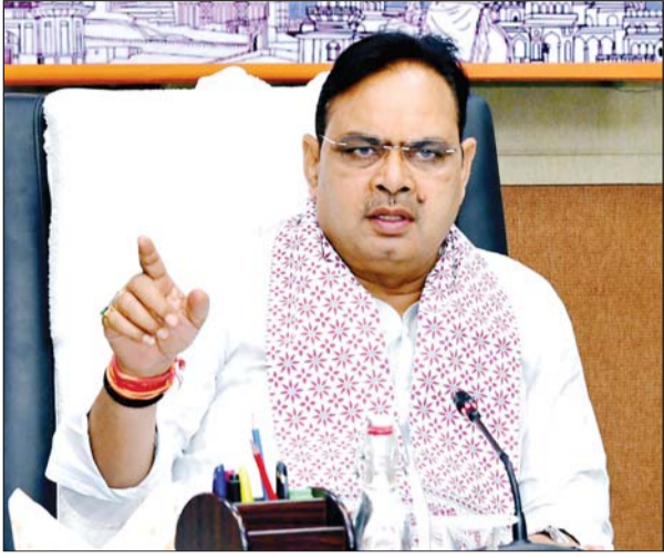
मुख्यमंत्री भजनलाल शर्मा ने जयपुर में प्रस्तावित राजस्थान मण्डपम की कार्ययोजना के संबंध में उच्चस्तरीय बैठक को संबोधित किया।

जयपुर, 17 मार्च। मुख्यमंत्री भजनलाल शर्मा ने कहा कि प्रदेश को 350 बिलियन डॉलर की अर्थव्यवस्था बनाने के लक्ष्य की पूर्ति के लिए राज्य सरकार औद्योगिक, पर्यटन एवं सांस्कृतिक गतिविधियों के प्रोत्साहन के लिए कृतसंकल्पित होकर कार्य कर रही है। उन्होंने कहा कि राजस्थान मंडपम के माध्यम से व्यापारिक एवं सांस्कृतिक कार्यक्रमों के लिए विश्वस्तरीय सुविधाएं उपलब्ध करवायी जाएंगी, ताकि प्रदेश बड़े-बड़े आयोजनों के लिए पहली पसंद बने और यहां कॉन्फ्रेंस टूरिज्म को बढ़ावा मिल सके। शर्मा ने सोमवार को मुख्यमंत्री निवास पर जयपुर में प्रस्तावित राजस्थान मण्डपम की कार्ययोजना के संबंध में उच्चस्तरीय बैठक को संबोधित किया। उन्होंने कहा कि राजस्थान मंडपम में होलिस्टिक अप्रोच के साथ आवश्यक व्यवस्थाओं एवं सुविधाओं को पुख्ता कार्ययोजना बनाई जाए ताकि यहां पर छोटे से लेकर बड़े प्रकार के आयोजन सुगमता से हो सके।