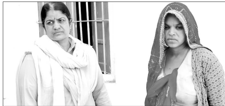
पुलिस ने मासूम बेटे की हत्या के आरोप में मां को गिरफ्तार किया।