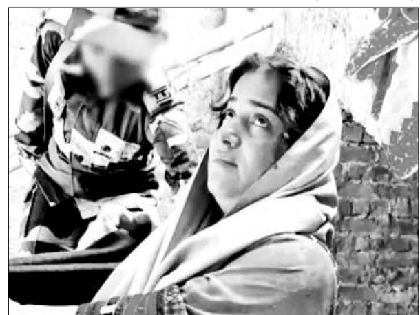
बीएसएफ ने भारत-पाक बॉर्डर पर घुसपैठ कर रही महिला को पकड़ा।