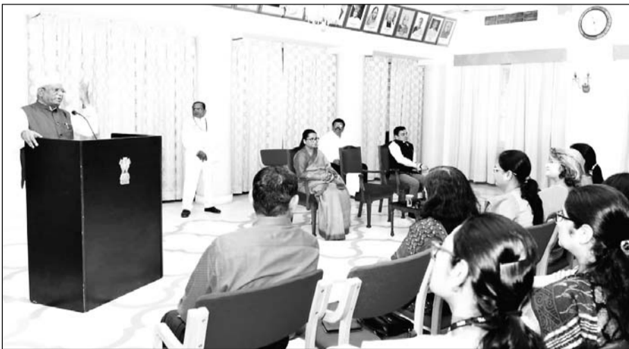
राज्यपाल हरिभाऊ बागडे़ से राजस्थान प्रशासनिक और लेखा सेवा के प्रशिक्षु अधिकारियों ने भेंट की।

जयपुर। राज्यपाल हरिभाऊ बागडे़ ने कहा है कि प्रशासनिक और लेखा सेवा में राष्ट्रहित को सर्वोपरि मानते हुए अधिकारी पूर्ण पारदर्शिता की कार्य की संस्कृति का विकास करें। उन्होंने समय के साथ जीवन प्रबंधन को जोड़ते हुए नैतिक मूल्यों के लिए कार्य करने पर जोर दिया। उन्होंने कहा कि राजकीय सेवा में आने के बाद अधिकारियों को यह चाहिए कि वे जन कल्याण से जुड़े कार्यों और विकास योजनाओं का प्रभावी रूप में क्रियान्वयन करें।