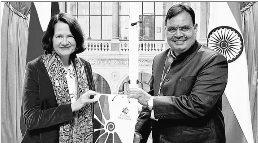
मुख्यमंत्री भजनलाल शर्मा, उप मुख्यमंत्री दीपा कुमारी और राजस्थान सरकार के उच्चस्तरीय प्रतिनिधिमंडल ने ब्रिटेन सरकार की मंत्री (इण्डो पैसिफिक क्षेत्र) कैथरीन वेस्ट के साथ मुलाकात की और लंदन के पैलेस ऑफ वेस्टमिंस्टर में ब्रिटेन की संसद का दौरा किया।

ब्रिटेन सरकार की मंत्री (इंडो-पैसिफिक क्षेत्र) कैथरीन वेस्ट के साथ मुलाकात की।