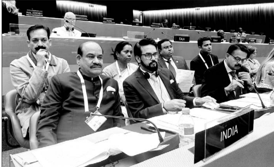
जिनेवा में अंतर-संसदीय संघ की बैठक में लोकसभा अध्यक्ष ओम बिरला के नेतृत्व में भारतीय संसदीय शिष्टमंडल ने भाग लिया।

स्पीकर ओम बिरला समापन दिवस पर आईपीयू की शासी परिषद की बैठक में शामिल हुए। बिरला ने कहा कि भारतीय शिष्टमंडल ने एसेम्बली के मुख्य विषय से जुड़े उन प्रमुख वैश्विक मुद्दों की ओर ध्यानाकर्षित किया, जिनमें भारत ने उल्लेखनीय प्रगति की है और सर्वोत्तम प्रथाओं को साझा किया। इसके साथ ही भारत की वैश्विक प्रतिबद्धताओं को दोहराते हुए परस्पर सहयोग की नीतिगत चर्चा-संवाद में शामिल होकर योगदान दिया। संसदीय सहयोग के माध्यम से समावेशी विकास और शांति की स्थापना के लिए वैश्विक प्रतिबद्धता को आगे बढ़ाने के लिए