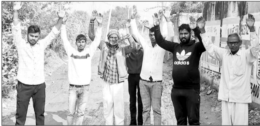
सड़क पर जमा गंदे पानी से परेशान ग्रामीणों ने विरोध प्रदर्शन कर समस्या समाधान की मांग की।

समस्या को लेकर विरोध कर रहे ग्रामीणों ने बताया कि लोयल से चिड़ासन जाने वाली सड़क पर पानी एकत्रित होने से बड़े-बड़े गड्ढे हो रहे हैं, जिनमें बरसात का पानी इकट्ठा हो जाता है। मुख्य रास्ते में पानी जमा होने से आमजन को बहुत परेशानी होती है। वहीं दुपहिया वाहन एवं पैदल आने जाने वाले लोगों को भारी परेशानियों का सामना करना पड़ रहा है। पानी जमा होने व सड़क में गड्ढे दिखाई नहीं देने के कारण कई बार दो पहिया वाहन एवं राहगीर पानी में गिर भी जाते हैं, जिससे उनको गंभीर चोटें आती हैं। ग्रामीणों ने