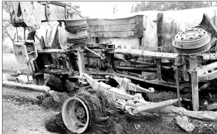
घर्षण से लगी आग से टैंकर जलकर राख हो गया।

कोटपूतली में तत्काल प्रभाव से ट्रैफिक को रोक दिया गया। कोटपूतली एएसपी, डीएसपी, सफुड थाना अधिकारी और हाईवे पेट्रोलिंग टीम मौके पर पहुंची। बहरोड़ में बाबा भास्करानंद मंदिर के पास दिल्ली-जयपुर मार्ग पर वाहनों को