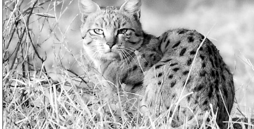
रामगढ़ विषधारी टाइगर रिजर्व के जंगलों में "एशियाई वन बिलाव" दिखाई दिया।

बून्दी, (निसं)। जिले के रामगढ़ विषधारी टाइगर रिजर्व के जंगलों में वन्य जीवों की संख्या व लुप्तप्राय प्रजातियों की उपस्थिति बनी हुई है। हाल ही में टाइगर रिजर्व में दुर्लभ प्रजाति की सियागोश बिल्ली के मिलने के बाद अब यहां "एशियाई वन बिलाव", एशियाई वाइल्ड कैट की भी मौजूदगी दर्ज की गई है। इसे भारतीय रेगिस्तानी बिल्ली, एशियाई जंगली बिल्ली या एशियाई मैदानी जंगली बिल्ली भी कहा जाता है। यह घरेलू बिल्ली के आकार की बिल्ली दक्षिण-पश्चिमी और मध्य एशिया, पाकिस्तान, भारत, मंगोलिया और चीन में व्यापक रूप से पाई जाती है। भारत में यह मुख्य रूप से पश्चिमी भारत के गुजरात, राजस्थान, मध्य प्रदेश और महाराष्ट्र के कुछ हिस्सों के शुष्क और अर्ध-शुष्क क्षेत्रों में पाई जाती है। राजस्थान में यह आमतौर पर यह वन बिलाव अब तक पश्चिमी रेगिस्तानी क्षेत्र व डेजर्ट नेशनल पार्क में देखी गया है। रेगिस्तान में इसकी मौजूदगी के कारण ही इसे "डेजर्ट कैट" के नाम से भी जाना जाता है। बून्दी के जंगलों में इसका मिलना एक सुखद एवं रोमांचक अनुभव है। रामगढ़ टाइगर रिजर्व बनने के साथ ही यहां पर लगातार बड़ी व छोटी बिल्लियों की संख्या बढ़ रही है जो इस टाइगर रिजर्व के लिए अच्छा संकेत है। भारतीय रेगिस्तानी वनबिलाव, बिल्ली जैसा ही दिखता है। इसके अगले