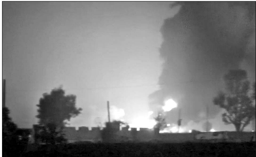
टैंकर में लगी आग दूर तक दिखाई दी।

दिल्ली-जयपुर राष्ट्रीय राजमार्ग स्थित ग्राम पनियाला के पास बैजिल केमिकल से भरा टैंकर पलट गया था