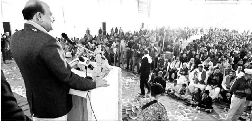
लोकसभा अध्यक्ष ओम बिरला ने कार्यक्रम को संबोधित किया।

लोकसभा स्पीकर ओम बिरला ने कहा कि बीते 5 वर्षों में ग्रामीण रोड कनेक्टिविटी में तेजी से सुधार हुआ है। कई प्रमुख सड़कों का निर्माण जारी है, कई काम जल्द शुरू होने हैं। इटावा-