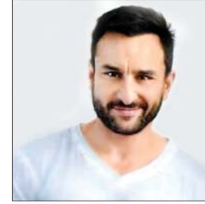
सैफ अली खान

हमलावर लूट के इरादे से उनके घर में घुसा और एक करोड़ रु. मांगे