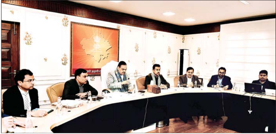
मुख्यमंत्री भजनलाल शर्मा ने जयपुर में प्रस्तावित राजस्थान मंडपम एवं यूनिटी मॉल की कार्ययोजना के संबंध में मुख्यमंत्री कार्यालय में उच्चस्तरीय बैठक ली तथा राजस्थान मंडपम बनाए जाने वाले कन्वेंशन सेंटर, एग्जीबिशन सेंटर, मीटिंग हॉल एवं आंगंतुक पार्किंग के संबंध में आवश्यक दिशा-निर्देश दिये।

मुख्यमंत्री भजनलाल ने कन्वेंशन सेंटर, एग्जीबिशन सेंटर, मीटिंग हॉल एवं आंगंतुक पार्किंग पर दिशा-निर्देश दिए