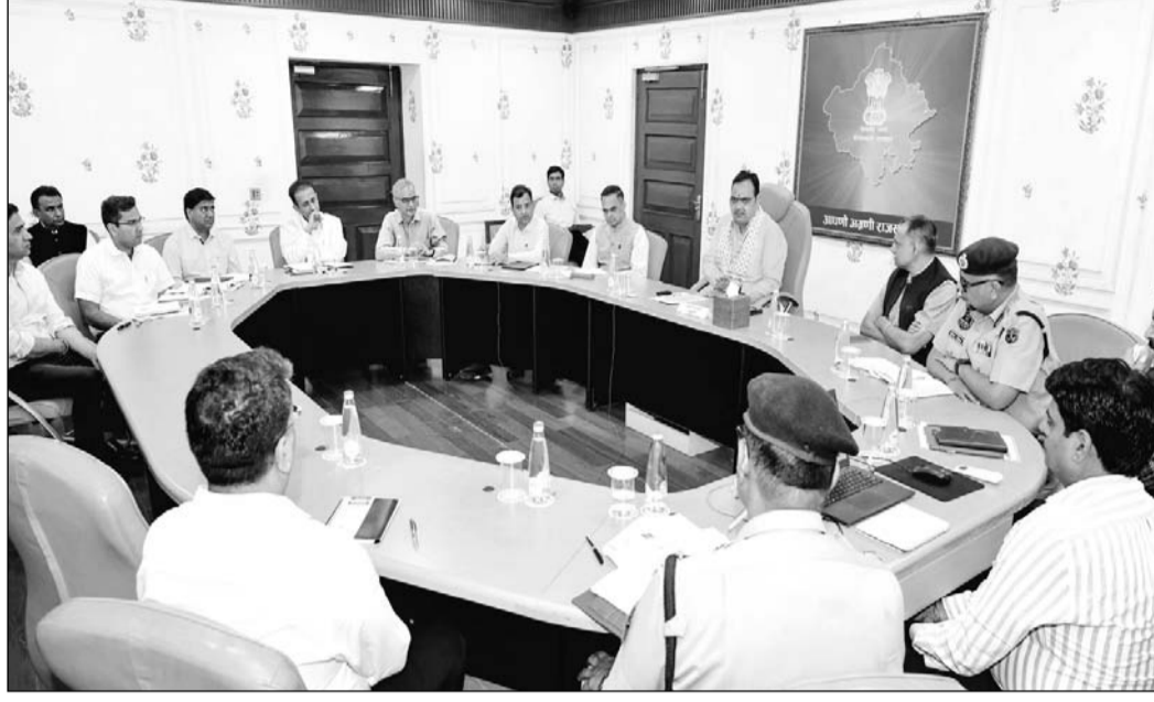
मुख्यमंत्री भजनलाल शर्मा ने गुरुवार को जयपुर शहर के यातायात सुधार के लिए अधिकारियों की उच्चस्तरीय बैठक ली।

उन्होंने जेडीए की सीबीआई फाटक, सालिग्रामपुरा फाटक एवं सिविल लाइन फाटक आरओबी, गोपालपुरा एलिबेटेड रोड, सांगानेर एलिबेटेड रोड के काम को गति प्रदान करने एवं पूर्ण गुणवत्ता से पूरा करने के लिए निर्देशित किया। साथ ही, उन्होंने जेलएन मार्ग पर यातायात प्रबंधन का प्रभावी प्लान बनाने के भी निर्देश दिए।