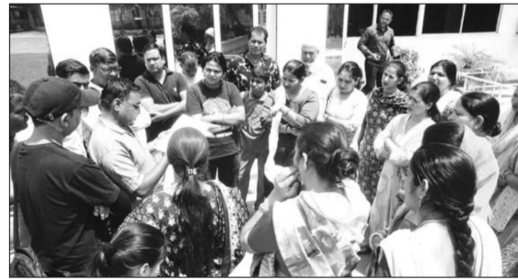
राजधानी जयपुर के श्याम नगर इलाके में “ट्री हाऊस हाई स्कूल” तीसरे दिन गुरुवार को भी बंद रहा, जिसे लेकर अभिभावकों ने कड़ई नाराजगी जताई।