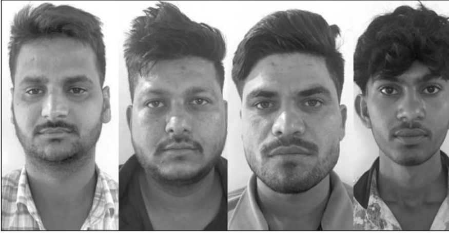
बरोनी पुलिस ने अपहरण करने के आरोपियों को गिरफ्तार किया।