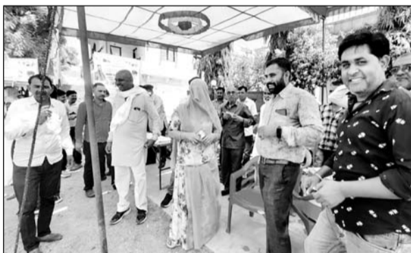
चुनाव के लिए मतदान करने जाते महिला व पुरुष।

भीण्डर पंचायत समिति सदस्य के लिए भोपाखेडा व अमरपुरा खालसा मतदान गाडी जो कि 7 बूथों पर मतदान प्रक्रिया सुबह 7 बजे से शुरू हुई। दोनों मतदान केन्द्रों पर गर्मी को देखते हुए ग्रामीण सुबह से मतदान करने के लिए पहुंचते लगे। सुबह 7 से 10 बजे तक ग्रामीणों ने जमकर