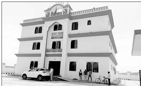
धौलपुर में नव निर्मित भाजपा कार्यालय।

धौलपुर, (निसं)। जिला भारतीय जनता पार्टी के नव निर्मित कार्यालय का उद्घाटन बुधवार 11 मई को पार्टी के राष्ट्रीय अध्यक्ष जगत प्रकाश नड्डा वीडियो कॉन्फ्रेंसिंग के माध्यम से वचुअल रूप से करेंगे। नवीन कार्यालय का कार्य पूर्ण हो चुका है जिसमें आधुनिक सुख सुविधाओं से सुसज्जित कॉन्फ्रेंस हॉल, बैठक कक्ष, पदाधिकारी बैठक कक्ष, प्रेस कॉन्फ्रेंस हॉल, आईटी और अकाउंट्स के ऑफिस, अधिकारी आवास आदि बनाए गए हैं। जिनका उपयोग भारतीय जनता पार्टी द्वारा राष्ट्र निर्माण के लिए किया जाएगा। कार्यक्रम में मुख्य अतिथि भारतीय जनता पार्टी किसान मोर्चा के राष्ट्रीय