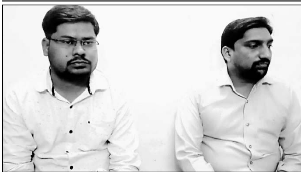
एसीबी की गिरफ्त में रिश्वत लेने के आरोपी कनिष्ठ अभियंता।

ठेकेदार से बिल पास करने की एवज में 11500 रुपये की रिश्वत लेते रेस्टोरेंट से दबोचा