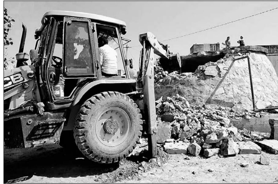
पेयजल सुलभ करवाने के लिए बनाये गये जीएलआर को तोड़ती जेसीबी मशीन।

इस तर्क के बावजूद ग्राम पंचायत के पास जीएलआर को तोड़ने का कोई अधिकार नहीं है, क्योंकि जीएलआर जलदाय विभाग की संपत्ति है और बिना जलदाय विभाग की अनुमति के उसे नहीं तोड़ा जा सकता। इस संबंध में जब जलदाय विभाग से जानकारी की मांगी