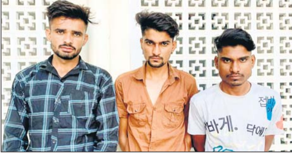
पुलिस ने मादक पदार्थ तस्करी करते तीन युवक पकड़े।