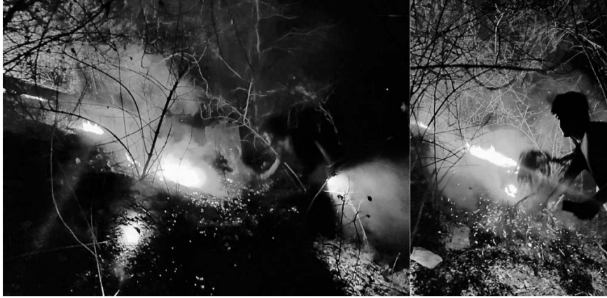
जलदाय विभाग के पीछे स्थित जंगल क्षेत्र में लगी भीषण आग को दमकल की सहायता से बुझाने की मशकत करते दमकलकर्मियों।

जिस पर वार्डवासी के द्वारा वरुण गांधी को सूचना दी वहीं गांधी ने मौके पर पहुंचकर नगरपरिषद के अग्नि शमन विभाग व वन विभाग के अधिकारियों को भी सूचना दी गई जिस पर वन विभाग के अधिकारियों ने बताया गया कि वन विभाग के कर्मियों सबला के वन्य क्षेत्रों में लगी आग बुझाने सबला जाना बताया जिस पर पुनः नगर परिषद के दमकल कर्मियों को मोबाइल से सूचना दी जिस पर अग्निशमन अग्नि शमन दस्ता मौक पर तत्काल पहुंचा परंतु नगर परिषद की छोटी अग्निशमन गाड़ी जो कि 12 वर्ष पुरानी है वह मौके पर खराब हो गई जिसको वजह से गाड़ी आगे ना जा पायेगी जिसके बाद अग्निशमन