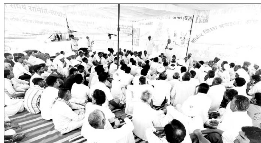
सांचोर जिला बचाओ संघर्ष समिति के धरने को वक्ताओं ने संबोधित किया।

पूर्व राज्यमंत्री सुखराम बिश्नोई ने कहा कि सांचोर जिला बचाओ संघर्ष समिति के नेतृत्व में आज 87 वें दिन धरना जारी है। सरकार समझ ले जो सांचोर जिले को निरस्त किया है जिसको नियमानुसार बहाल कर दे। सांचोर जिला जो जालोर जिले से 145 कि.मी. दूर व अंतिम गांव आकोड़ियां, रणछाण करीब 250 किमी दूर हैं। सरकार ने कौनसे आधार पर सांचोर जिले को निरस्त किया, कोई स्पष्ट नहीं है। जिला बनने से जिला मुख्यालय नजदीक होने पर आमजन के लोगों के सभी जिले स्तर के कार्य जल्द होते थे। वर्तमान सरकार आमजन का त्वरित कार्य नहीं करना चाह रही है और आमजन को इधर-उधर भटकाने के आर्थिक नुकसान करना चाहती है। वर्तमान