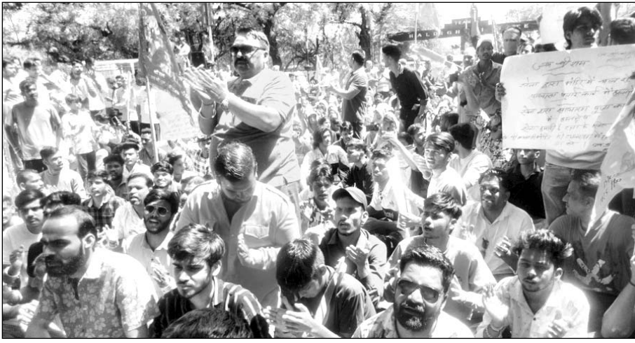
चांदमारी बालाजी मंदिर का पुराना रास्ता खोलने की मांग को लेकर प्रदर्शन किया।

इस दौरान हनुमान चालीसा का पाठ किया। इसमें बड़ी संख्या में बुजुर्ग और महिलाएं शामिल रही। इससे स्टेशन और जामेन मुखाई बंद हो गया और