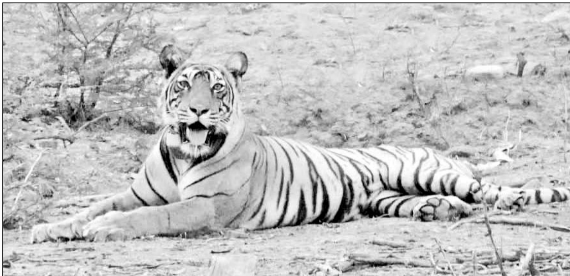
बूंदी के रामगढ़ विषधारी टाइगर रिजर्व में डेढ़ साल पहले बाघिन आरवीटी-2 की मौत हो गई थी। (फाइल फोटो)

उम्मीद के रूप में उभरी हैं। दोनों मादा शावक तीन साल की युवा बाघिन हो चुकी हैं जो रामगढ़ महल के आसपास मेज नदी को अपनी टैरेटरी बना चुकी हैं। युवा होती दोनों बाघिन एनक्लोजर