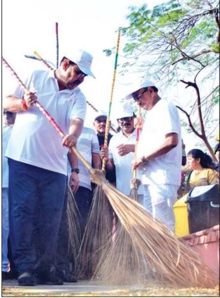
मुख्यमंत्री भजनलाल शर्मा ने शनिवार को एल्बर्ट हॉल से प्रदेशव्यापी स्वच्छता संकल्प एवं जागरूकता कार्यक्रम की शुरुआत की।

मुख्यमंत्री ने कहा कि राज्य सरकार ने प्रदेशवासियों को स्वच्छता से जोड़ने के लिए विशेष कार्यक्रम आयोजित किए हैं। जल महल की पाल एवं मानसरोवर सिटी पार्क में स्वच्छता के लिए कार्यक्रम आयोजित किए जा चुके हैं। इसी क्रम में एल्बर्ट हॉल से राजस्थान दिवस के उपलक्ष्य में स्वच्छता कार्यक्रम की शुरुआत की गई है।